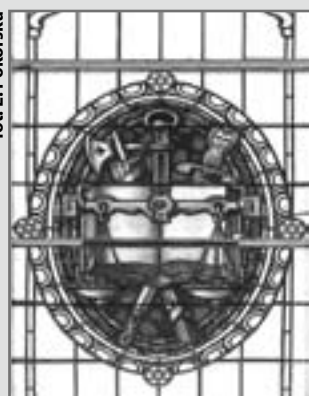
Emblematy sądownictwa w oknie gmachu Sądu Rejonowego

przyjętej zasady – witraż z żydowskiego domu przedpogrzebowego przy ul. Poniatowskiego (tzw. Małej Synagogi). Autorka oprawy graficznej pokusiła się nawet o jego wirtualne odtworzenie, co umożliwiło jej ukazanie piękna – zachowanego tylko fragmentarycznie – przeszkleń.