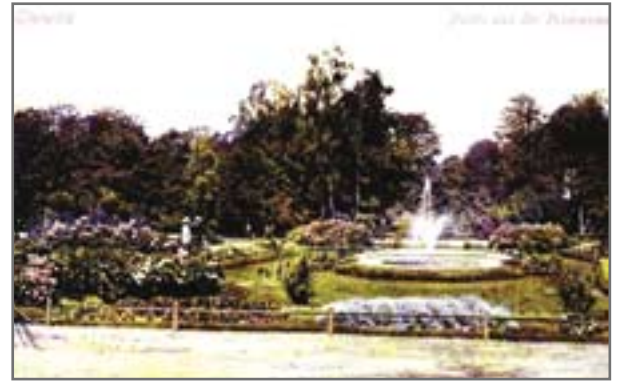
Fontanna przy promenadzie – wspomnienie przeszłości