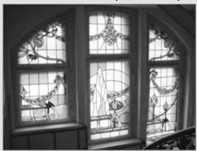
Witraż przedstawiający śródziemnomorski krajobraz w budynku przy ul. Kozielskiej

Żadnych kłopotów w tym względzie nie ma natomiast z przeszkleńiami w budynkach stanowiących w całości własność miasta Gliwice. Należycie chronione są np. witraże w domach przy ulicach Kozielskiej 16, Lipowej 36, Dworcowej 23. Ostatni z nich po zabiegach konserwatorskich znowu zdobi okna wykusza secesyjnej kamienicy. W innych