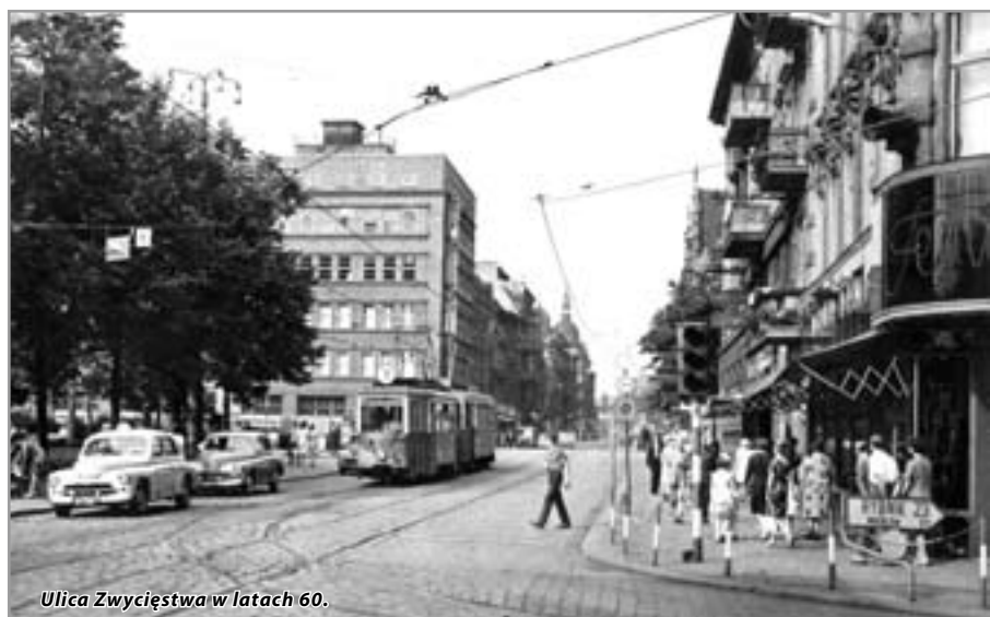
Ulica Zwycięstwa w latach 60.

Przed 15 laty tramwaje przestały jeździć z Gliwic do Zabrza. 10 sierpnia 1993 roku rozpoczął się remont wiaduktu łączącego ul. Chorzowską z ul. Zaborską. Podjęcie robót renowacyjnych było konieczne, bo stan techniczny obiektu przedstawiał się fatalnie. Prace trwały ponad trzy lata. W tym czasie tramwaje kursowały tylko na odcinku pomiędzy remontowanym wiaduktem a pętlą w Wójtowej Wsi. Było to możliwe dzięki eksploatacji specjalnego taboru dwukierunkowego. W firmie „GEC Alstom-Konstal” w Chorzowie skonstruowano dwuwagonowe zestawy, które na