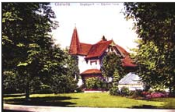
Dawny domek ogrodnika – perła parku

Z mapy wydanej w 1909 roku można się dowiedzieć, że ówczesny park był podzielony na dwie części kanałem łączącym odnogę Kłodnicy z Kanałem Kłodnickim. Południowa (najstarsza) część kompleksu była prawdopodobnie ogrodem z basenem przy pałacu lub rezydencji. Obok głównej alei parkowej stał postument z rzeźbą Iwa. W centralnej części parku znajdowały się zaś piękne drzewa: dąb szypułkowy (pozostałość naturalnego lasu) oraz buk miedziany. Rosną one do dziś. – Są najstarszymi okazami parkowej przyrody. Pierwsze drzewo liczy sobie 260 lat, a drugie 145 – informuje Iwona Kokowicz.