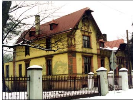
To zdjęcie ukazało się 3 marca br. w MSI,