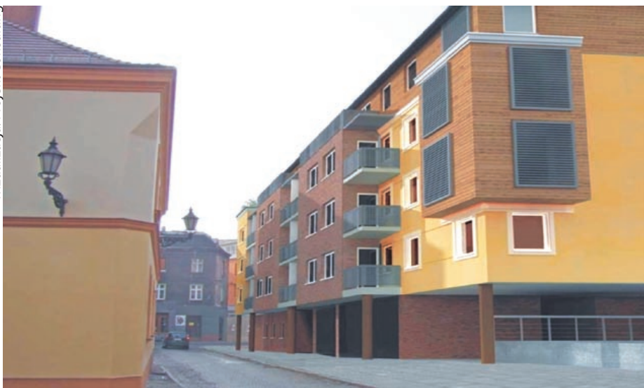
Elewacja w pastelowych barwach i plac zabaw na dachu – tak ma wyglądać „plomba” przy ul. Raciborskiej Bramy

lejnym roku ruszą inwestycje przy ul. Uszczyka (27 lokali) i Targowej (33 lokale). Zaś na 2014 r. zaplanowano wzniesienie domów przy ul. Warszawskiej i Toszeckiej, a w latach 2014 – 2015 realizację trzeciego etapu przy ul. Granicznej. W sumie do 2016 r. „dwójka” ma oddać do użytku 388 lokali mieszkalnych i 12 użytkowych. Wartość tych zadań wyniesie 102 mln zł. – Na złożone wcześniej wnioski otrzymaliśmy już promesy Banku Gospodarstwa Krajowego udzielającego preferencyjnych kredytów Towarzystwom Budownictwa Społecznego. Dotyczą one inwestycji w Łabędach i Żernikach. Na kolejne przedsięwzięcia będziemy składać wnioski w tym roku. Nasze projekty spełniają wymagania określone przez bank, więc z pożyczką nie powinno być problemów. Jesteśmy dobrej myśli – przekonuje Bożena Orłowska, szefowa „dwójki”.