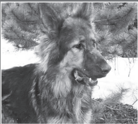
LORDEM – dużym psem w typie owczarka niemieckiego, wykastrowanym, łagodnym i czujnym.