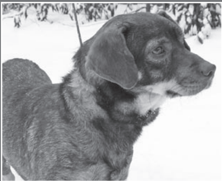
LUCKIEM – małym, brązowym pieskiem znalezionym kilka miesięcy temu koło hipermarketu „Arena”, spał w donicy w silne mrozy.

Schronisko dla Zwierząt organizuje adopcje od poniedziałku do piątku, w godz. od 10.00 do 16.00 i w soboty od 10.00 do 15.00. Wydawane zwierzęta są zaszczepione, wysterylizowane i przyjaźnie nastawione do ludzi.