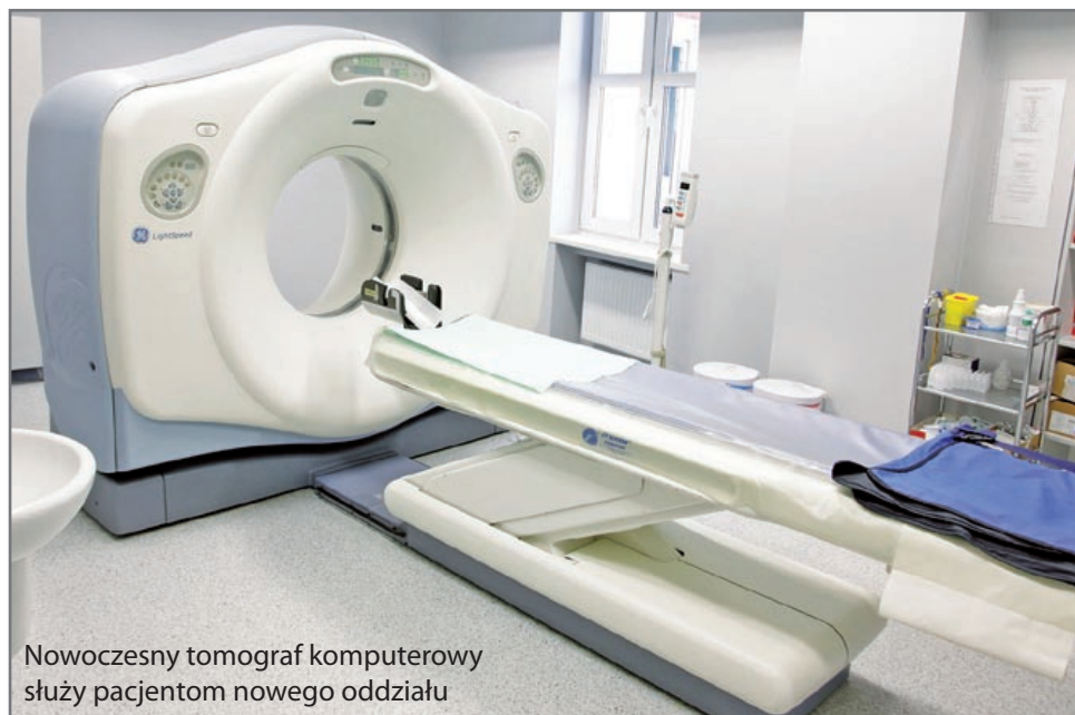
Nowoczesny tomograf komputerowy służy pacjentom nowego oddziału

W szpitalu przy ul. Radiowej otwarto w połowie marca Oddział Udarowy. Dysponuje on 16 łózkami dla pacjentów. – Leczenie udarów mózgu jako stanu zagrożenia życia w specjalnie przeznaczonym do tego celu oddziale pozwoli na osiągnięcie znacznie lepszych wyników terapii – mówi lekarze. Nowa jednostka organizacyjna szpitala jest już trzecim z kolei oddziałem w tej placówce, po internie i neurologii.