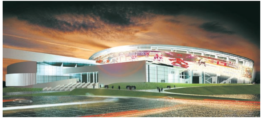
Modern Construction System PERBO-PROJEKT