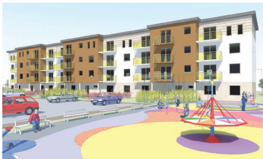
Jesienią 2012 roku zaplanowano oddanie do użytku budynku przy ul. Targowej

wych i bliźniaczych segmentów przy ul. Aronii i Agrestowej oraz 6 – przy ul. Polnej. Komercyjne przedsięwzięcie zrealizowano także przy ul. Granicznej – powstało tam 31 mieszkań na sprzedaż, z których większość znalazła już właścicieli. W planach jest budowa kolejnych 44 domów i 27 mieszkań w tym rejonie. Podobne obiekty pojawią się także na Podlesiu przy ul. Tarnogórskiej (9 segmentów) oraz przy ul. Jana Pawła II (38 mieszkań).