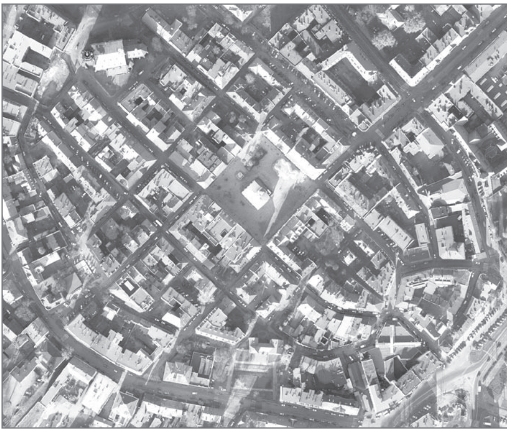
Nowa ortofotomapa jest zdecydowanie dokładniejsza od poprzedniej z 2003 r.