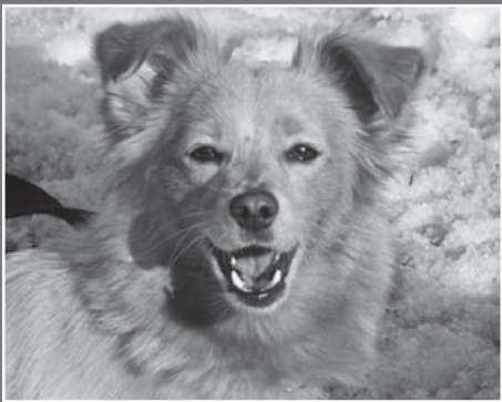
LISICZKA – malutką suczką, bardzo łagodną i udomowioną, która trafiła do schroniska w czasie największych mrozów.