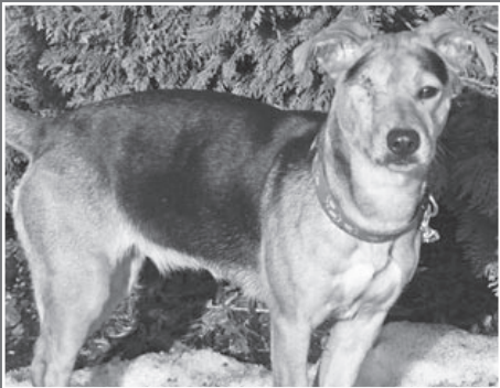
SABINKA – małą, roczną suczką. Piesek nie ma oczka, został znaleziony z opatrunkiem po zabiegu w okolicach Podlesia.