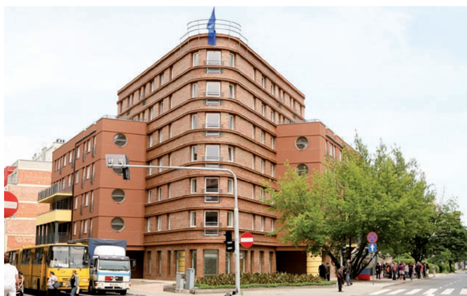
W sąsiedztwie oryginalnego „transatlantyka” powstaną kolejne mieszkania w ramach TBS

Ile kosztowało wybudowanie dotychczasowych domów mieszkalno-usługowych TBS wraz z towarzyszącą im infrastrukturą? W sumie – ok. 193 mln zł (ok. 108 mln zł – „jedyńka”, ok. 85 mln zł – „dwójka”). Przedsięwzięcia zostały sfinansowane z kredytów bankowych, dotacji pochodzącej z budżetu miejskiego, własnych środków pieniężnych obydwu gliwickich Towarzystw Budownictwa Społecznego oraz wpłat wniesionych przez lokatorów (tzw. partycypacji).