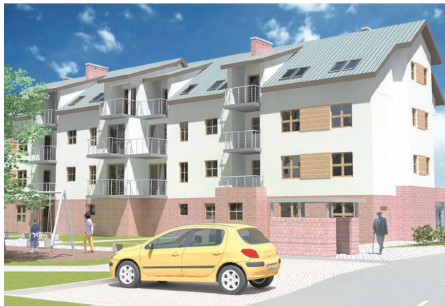
Za dwa lata do domów przy ul. Granicznej wprowadzą się nowi lokatorzy

Jak przekonują prezesi spółek w Gliwicach, zainteresowanie taką formą wynajmu mieszkania jest bardzo duże. Znacznie większe niż w ościennych miastach. Na jeden lokal przypada aż 5 chętnych. – Wynika to z faktu, że udziałowcem gliwickich TBS-ów jest gmina, która wnosi swój wkład w postaci gruntów, jak i partycypuje w kosztach inwestycji. To gwa-