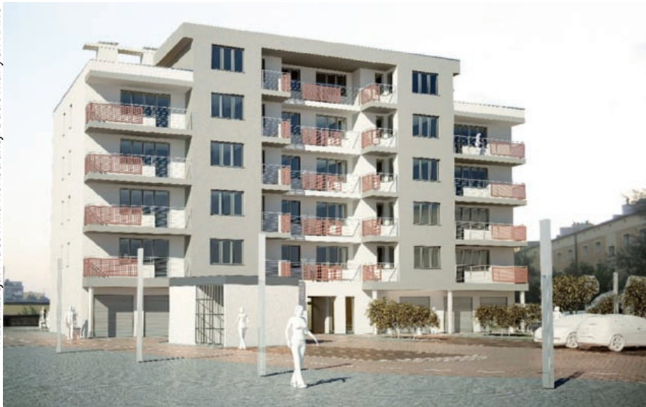
W bloku przy ul. Mikołowskiej 19 zaprojektowano 23 mieszkania

wizualizacja: Pracownia Konstrukcji Budowlanych KARO