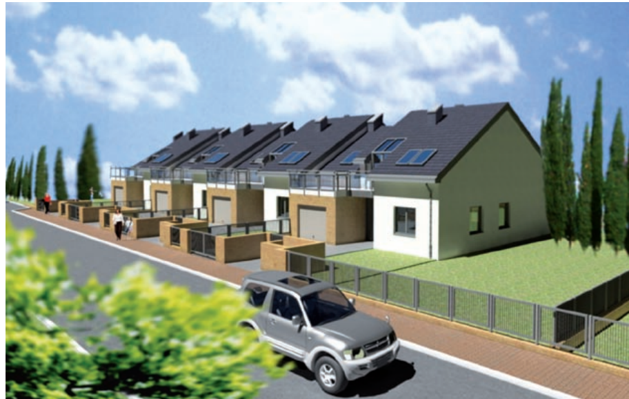
Nowe domy w systemie deweloperskim powstaną m.in. na Podlesiu

wizualizacja: Biuro Usług Architektonicznych PROFIL