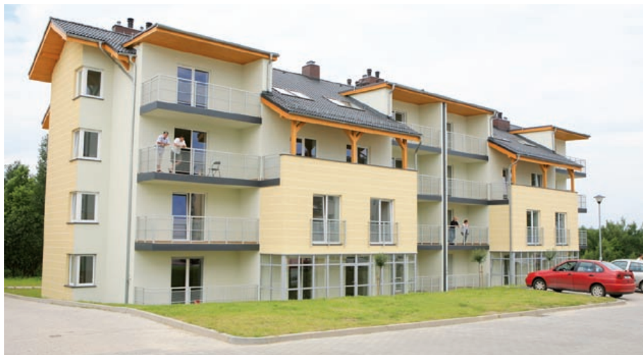
Na osiedlu Bajkowym zamieszkało już ponad 500 rodzin

Pierwsze mieszkania w systemie budownictwa społecznego (45 lokali) oddano do użytku jeszcze pod koniec 2000 r. w budynkach przy ul. Zaburskiej i Daszyńskiego. W kolejnych latach powstawały następne domy TBS, m.in. przy ulicach: Witkiewicza, Lipowej, Żabińskiego na osiedlu Bajkowym (w sąsiedztwie osiedla Waryńskiego), Dworskiej, Uszczyka, Bernardyńskiej, Strzelców Bytomskich oraz Wieczorka. Z inicjatywy ZBM I TBS wzniesiono 700 mieszkań, a 549 lokali zbudowano dzięki staraniom ZBM II TBS. W ubiegłym roku oddano do użytku w sumie 242 lokale. 128 rodzin zamieszkało przy ul. Andersena, 32 – przy ul. Aronii i Agrestowej na Podlesiu, a 82 – przy ul. Granicznej w pobliżu Żernik.