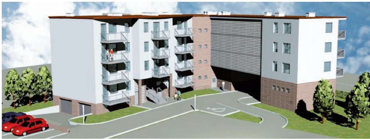
Rozpoczęła się już budowa 25 mieszkań przy ul. Strzelców Bytomskich w Łabędach

Równie ambitne plany ma ZBM II TBS. Pod koniec stycznia ruszyła budowa domu z 25 mieszkaniami przy ul. Strzelców Bytomskich w Łabędach. Nowi lokatorzy wprowadzą się już w przyszłym roku. Natomiast w maju rozpocznie się realizacja drugiego etapu przedsięwzięcia przy ul. Granicznej. W tym rejonie przewidziano budowę 107 mieszkań. W drugiej połowie roku rozpoczną się także prace u zbiegu ulic Mikołowskiej i Jana Pawła II, gdzie powstanie 18 mieszkań (część przeznaczona będzie na sprzedaż). W ko-