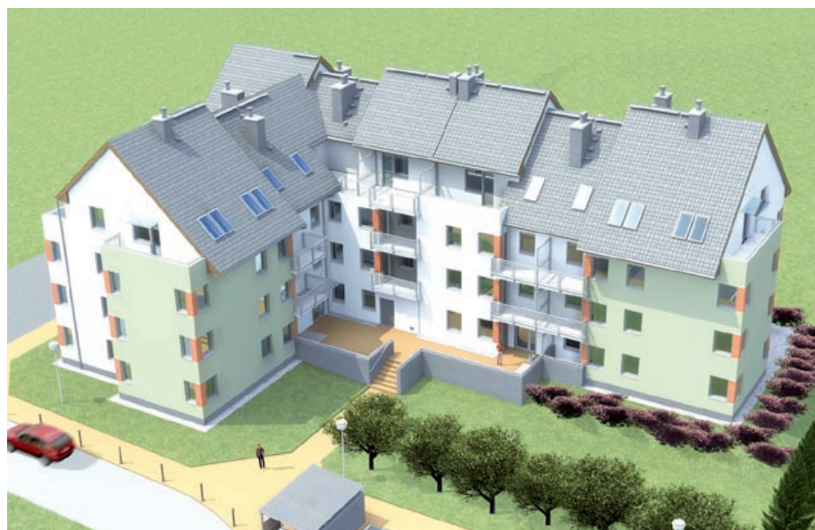
Zielono-biały blok zostanie wybudowany przy ul. Uszczyka

Plac przy kościele Wszystkich Świętych pozostaje od lat nieurządzony. W 2005 r. gliwicy radni uchwalili miejscowy plan zagospodarowania przestrzennego dla tej części miasta. Zapisano w nim, że teren ten jest przeznaczony pod intensywną zabudowę mieszkaniowo-usługową. Od tamtej pory powstały trzy projekty architektoniczne planowanego obiektu. Ostatni został opracowany pod koniec ubiegłego roku. – Nowy kształt budynku to kompromis uwzględniający możliwości finansowe spółki oraz postulaty mieszkańców sąsiedniej ka-