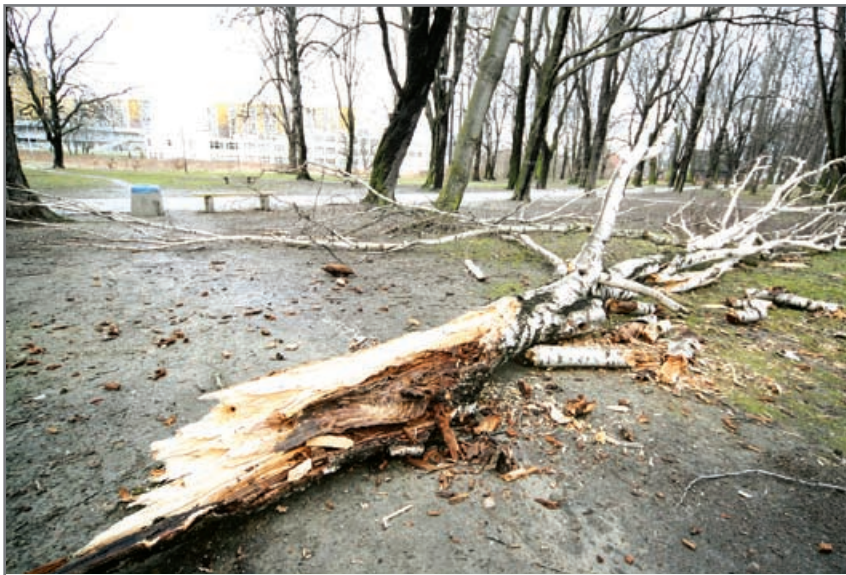
Skutki wichury w Parku Starozielskim

– Większość zgłoszeń (61 w mieście i powiecie) dotyczyła powalonych drzew, które padając, zrywały często pobliskie linie energetyczne. Spora część interwencji dotyczyła też usuwania drobnych uszkodzeń dachów w budynkach mieszkalnych i gospodarczych – wylicza Tomasz Wójcik. Huraganowy wiatr