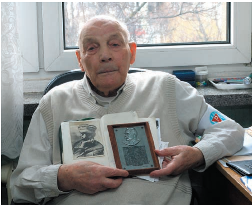
Z miłymi sercu pamiątkami...