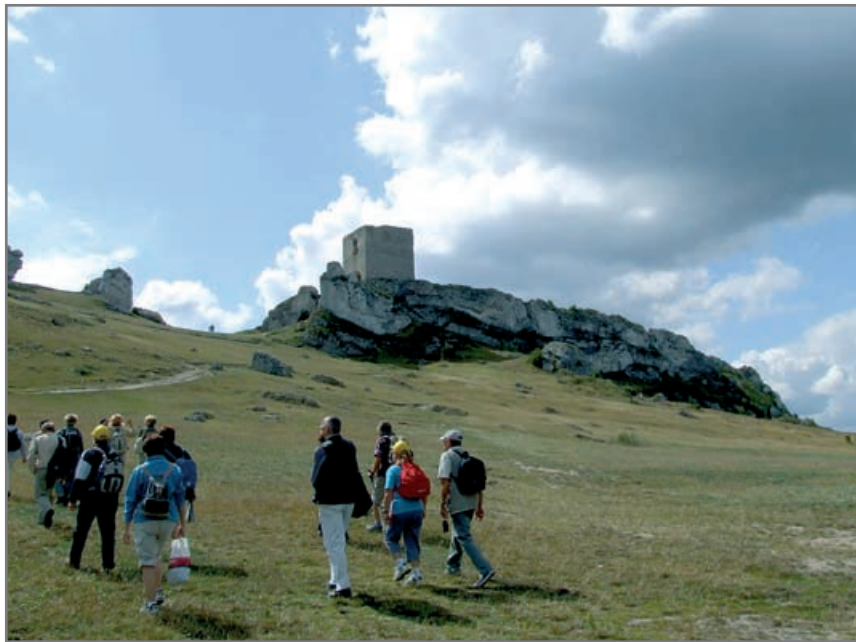
Gliwiczanie wielokrotnie zwiedzali m.in. Jurę Krakowsko-Częstochowską

Oddział PTTK Ziemi Gliwickiej obchodzi w tym roku 55-lecie swojego istnienia. Zrzesza on obecnie ok. 600 osób należących do 21 jednostek organizacyjnych w mieście i powiecie gliwickim. Pod auspicjami stowarzyszenia działają szkolne koła turystyczno-krajoznawcze w 7 gliwickich placówkach oświatowych. Oblicza się, że w imprezach przygotowywanych przez oddział bierze udział rocznie ok. 35 tysięcy miłośników różnych form turystyki. Jakie były początki działalności stowarzyszenia w naszym mieście?