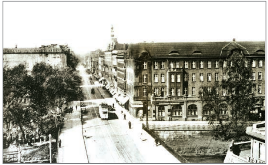
Wilhelmstraße – widok na most na Kanale Kłodnickim ok. 1930 r. (obecnie ul. Zwycięstwa)

Ciekawym wydarzeniem okresu międzywojennego była zmiana szerokości torów tramwajowych na Górnym Śląsku – z 785 mm na 1435 mm. Do tej operacji technicznej przystąpio-