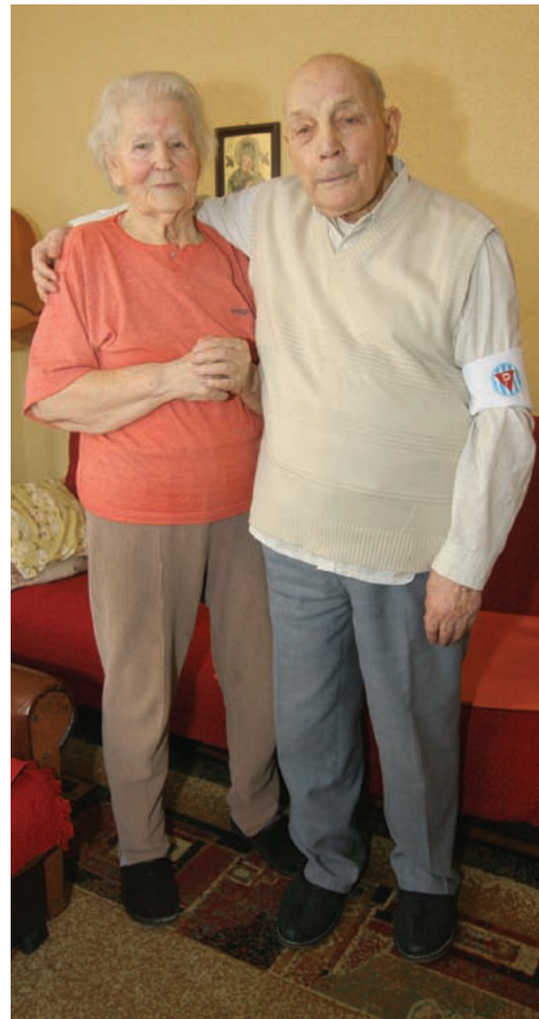
...i ukochaną żonę