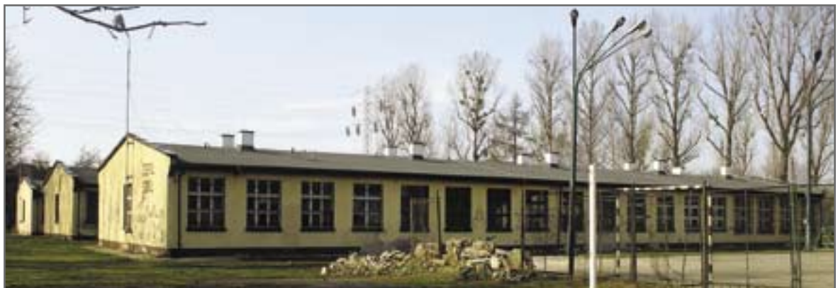
Przyszła siedziba MZUK – budynki dawnej szkoły przy ul. Strzelców Bytomskich w Łabędach

Na tym nie kończy się jednak lista przewidywanych w tym roku inwestycji. Miejski Zarząd Usług Komunalnych planuje: przeprowadzić gruntowny remont dachu Palmiarni Miejskiej, zmodernizować schronisko dla zwierząt w Sośnicy (trzeba tam wzniesić tzw. „pawilon kwarantanny”), dostosować do obowiązujących wymagań tereny