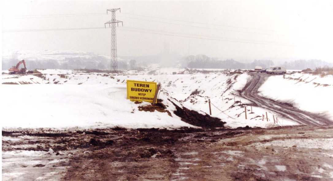
W tym miejscu na pograniczu Gliwic i gminy Gierałtowie – w rejonie ulic Pszczyńskiej i Granicznej – będą się w przyszłości krzyżować transeuropejskie autostrady A4 i A1

Szybka realizacja całego śląskiego odcinka autostrady A1 jest niezbędna dla praktycznego funkcjonowania budowanego od kilku lat systemu obsługi komunikacyjnej regionu - uznali wójtowie gmin, burmistrzowie i prezydenci miast oraz starostowie powiatów województwa śląskiego, uczestniczący w ubiegłym tygodniu w spotkaniu w gliwickim Ratuszu.