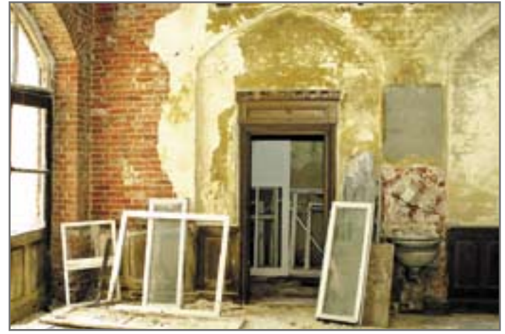
Lato 2007 roku. Wnętrze Małej Synagogi przed zadekowaniem otworów okiennych i drzwi

Mała Synagoga podupada w przerażającym tempie. Mimo pierwotnych deklaracji władz miasta przeprowadzenie jesienią ubiegłego roku jakichkolwiek większych napraw w obrębie jej