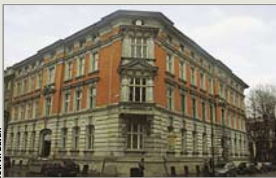
fol. W. Baran

Większość potrzebnych wiadomości i wskazówek można zacytować u pracowników instytucji w godzinach funkcjonowania oddziału – w poniedziałki w godz. od 7.30 do 16.45