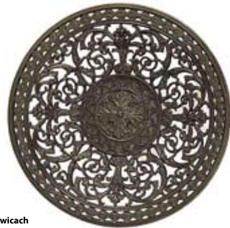
Talerz żeliwny ażurowy odlany wg projektu K. F. Schinkla, sygnowany „BUDERUS”. Niemcy – Górna Hesja, Hirzenhein, XIX w.

Imprezie ma towarzyszyć pokaz filmu „Jak odlewano żeliwo” pochodzący z Kunstguss – Museum Lauchhammer. Organizatorzy przedstawią również polsko-niemiecką publikację, prezentującą powstanie i rozwój giserni oraz ich wyroby. (kik)