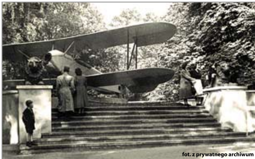
Kamienne lwy przy ul. Barlickiego były w przeszłości niemyimi świadkami bezkolizyjnego upadku rosyjskiego „kukużużnika” na plac przy Parku Chopina

Kamiennym lwom zlecono ważne „zadanie”. Miały dumnie strzec zbudowanego w latach 1924-1945 militarne mauzoleum. Lwie rzeźby pozostały tam do