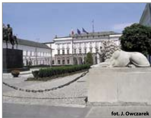
Czuwający lew przed Pałacem Prezydenckim w Warszawie