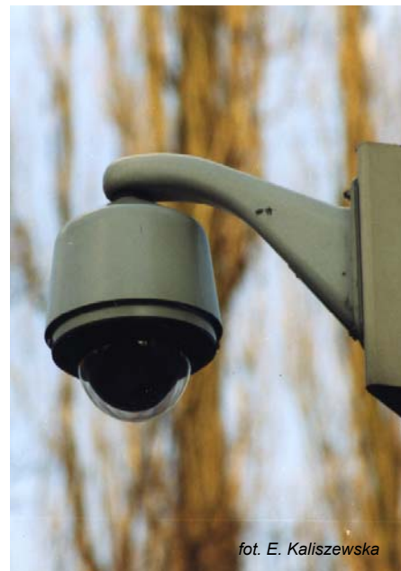
fol. E. Kaliszewska

2002 przestępczość w rejonie objętym monitoringiem zmalała o prawie 57% (w roku 2003 odnotowano 198 przestępstw, a w roku poprzednim - aż 461). Spadła zwłaszcza liczba kradzieży (ze 165 na 82) oraz rozbojów i wymuszeń rozbójniczych (z 55 na 27). Policja wystąpiła z wnioskiem do prezydenta miasta o rozważenie możliwości sfinansowania przez samorząd montażu następnych kamer w miejscach zagrożonych przestępczością. (luz)