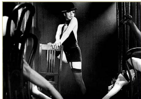
Liza Minnelli w „Cabarecie” Boba Fosse'a.