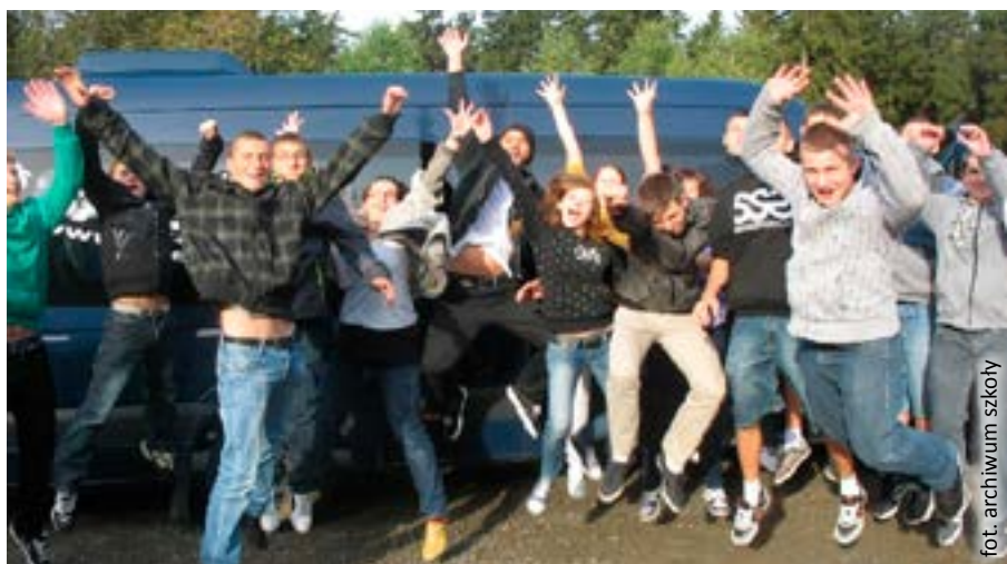
fot. archiwum szkoły