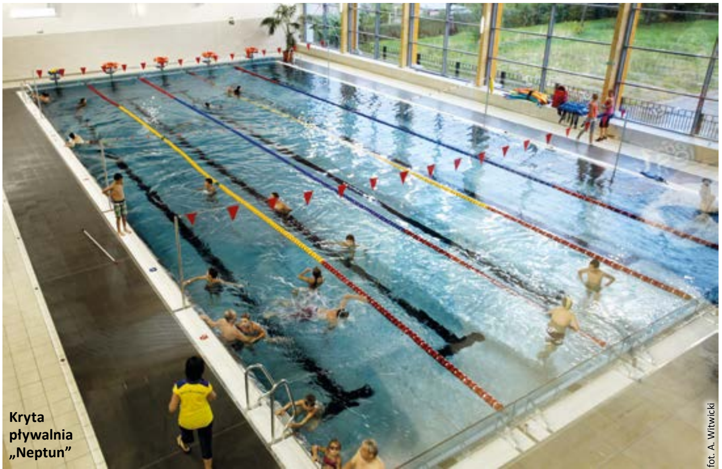
Kryta pływalnia „Neptun”

W tegorocznej edycji przedsięwzięcia oceniano 43 realizacje z 28 miejscowości. Nasze miasto reprezentowało sześć obiektów: fontanna miejska na Placu Piłsudskiego, kryta pływalnia „Neptun” w Sośnicy, stadion miejski przy ul. Okrzei, zmodernizowany Rynek, nowa siedziba