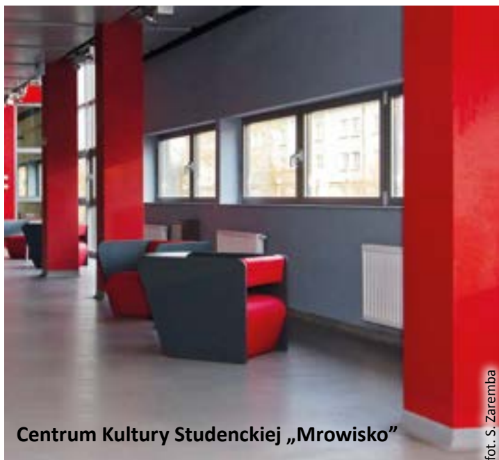
Centrum Kultury Studenckiej „Mrowisko”