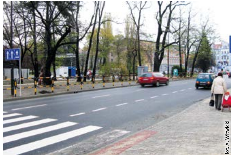
fol. A. Witwicki

Fragment Nowego Świata od skrzyżowania z ul. Rybnicką i Jana Pawła II do skrzyżowania z ul. Pszczyńską, Wrocławską i Mikołowską został przebudowany – na jezdni prowadzącej w stronę ul. Pszczyńskiej powstał trzeci pas ruchu. Inwestycja objęła też m.in. przebudowę podziemnego uzbrojenia, korektę łuków drogowych i modyfikację sygnalizacji świetlnej na obydwu skrzyżowaniach, zmianę przebiegu chodników w rejonie zieleńca. Przewidziano również zainstalowanie dodatko-