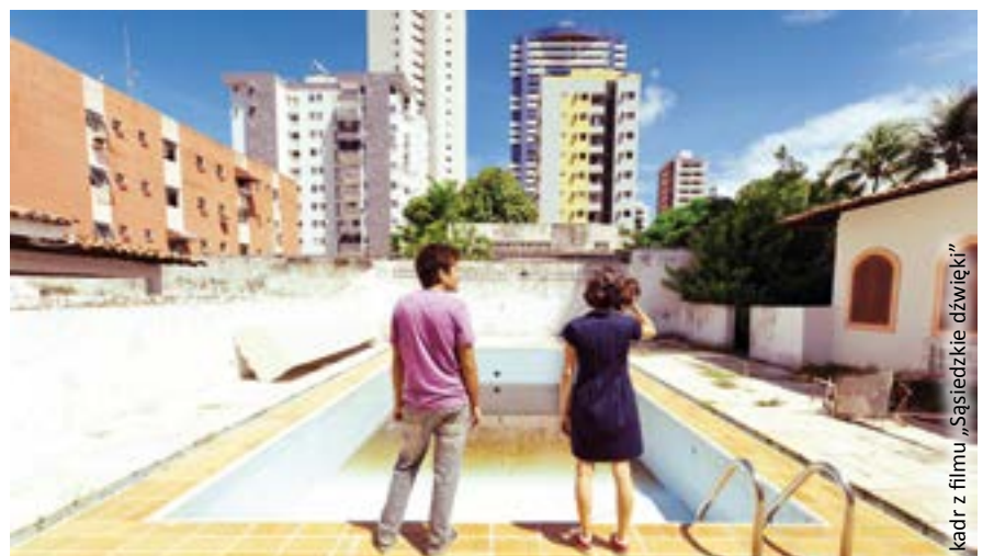
kadr z filmu „Sąsiedzkie dźwięki”