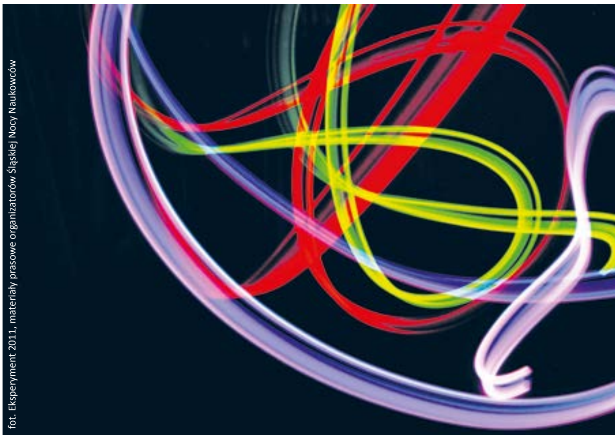
foto. Eksperyment 2011, materiały prasowe organizatorów Śląskiej Nocy Naukowców

Śląska Noc Naukowców stanowi element Europejskiej Nocy Naukowców – projektu zrodzonego w 2005 r. z inicjatywy Komisji Europejskiej w ramach 6. Programu Ramowego. Celem przyświecającym twórcom Nocy jest zachęcenie młodych ludzi do nieustannego poszerzania wiedzy i wyboru zawodu naukowca.