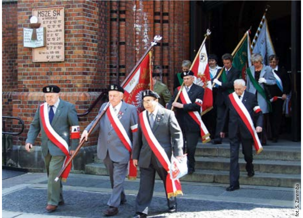
fol. S. Zaremba