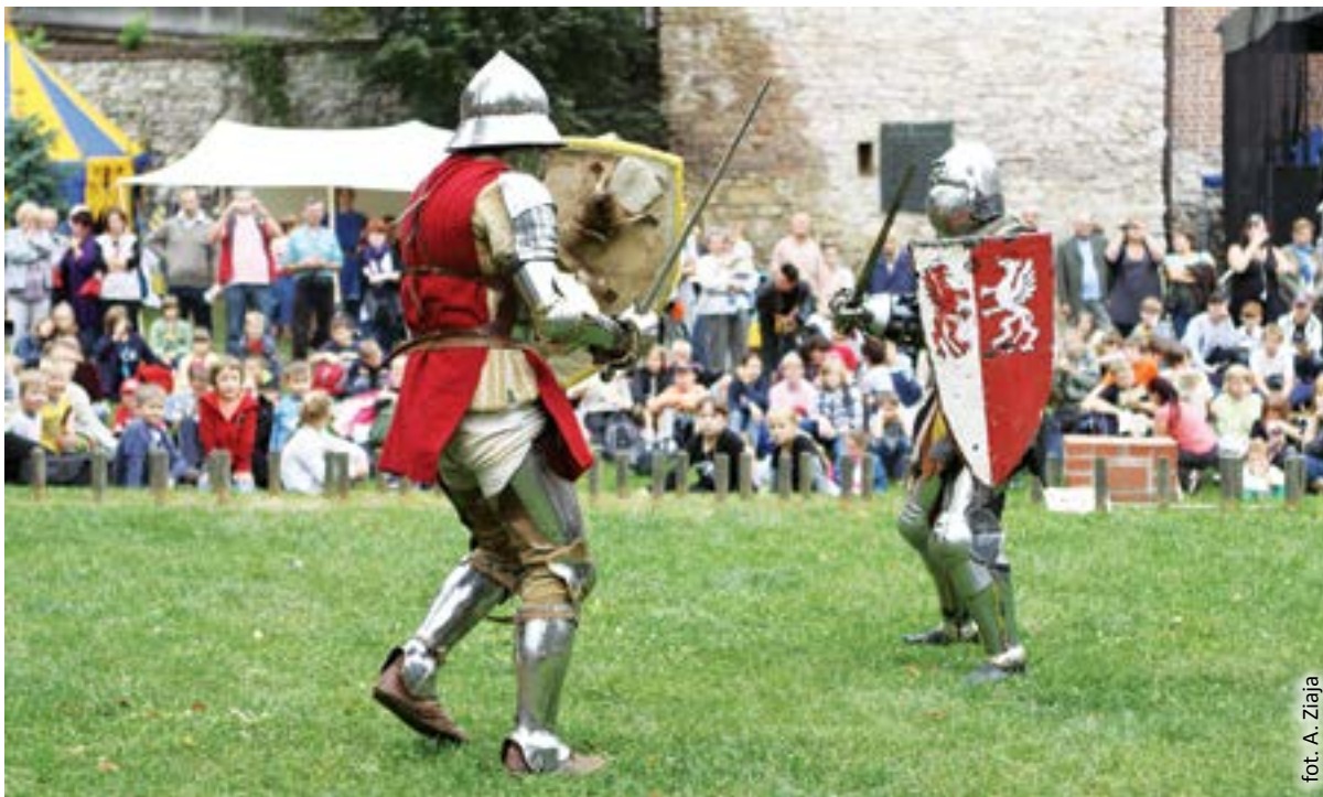
fol. A. Zięta