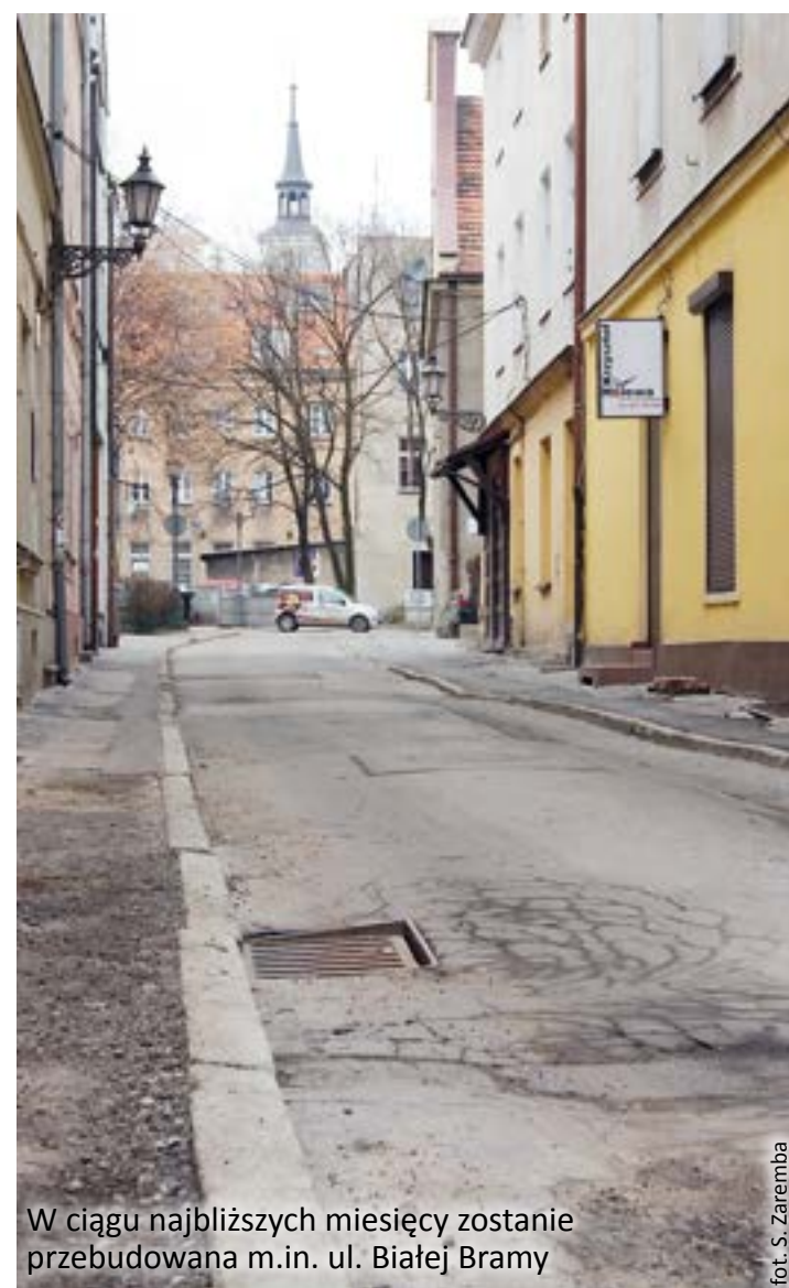
W ciągu najbliższych miesięcy zostanie przebudowana m.in. ul. Białej Bramy