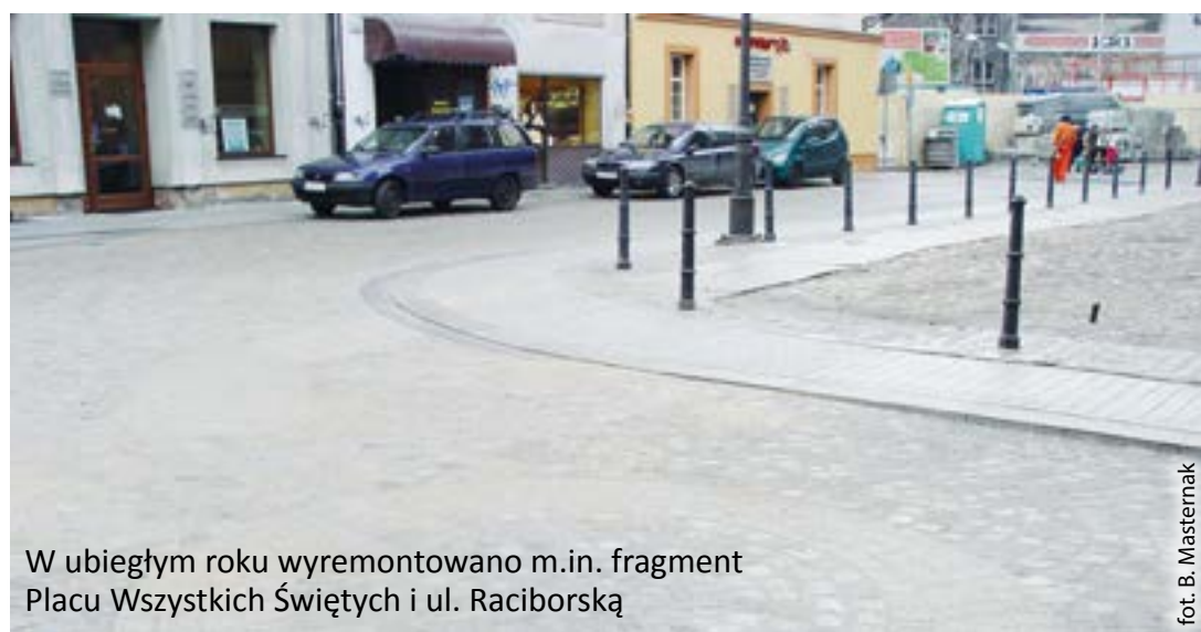
W ubiegłym roku wyremontowano m.in. fragment Placu Wszystkich Świętych i ul. Raciborską

Przypomnijmy, że gruntowna modernizacja uliczek Starego Miasta rozpoczęła się w czerwcu 2011 roku. Całe przedsięwzięcie zaplanowano na pięć lat. W tym czasie przebudowane zostaną wszystkie uliczki Starówki. Na ten cel zostanie wydane ponad 41 mln zł z budżetu miejskiego. Inwestycję realizuje konsorcjum gliwickich firm – Przedsiębiorstwo Remontów Ulic i Mostów SA oraz Zakład Instalacji Budowlanych Witold Szostak, Andrzej Duda. (bom)