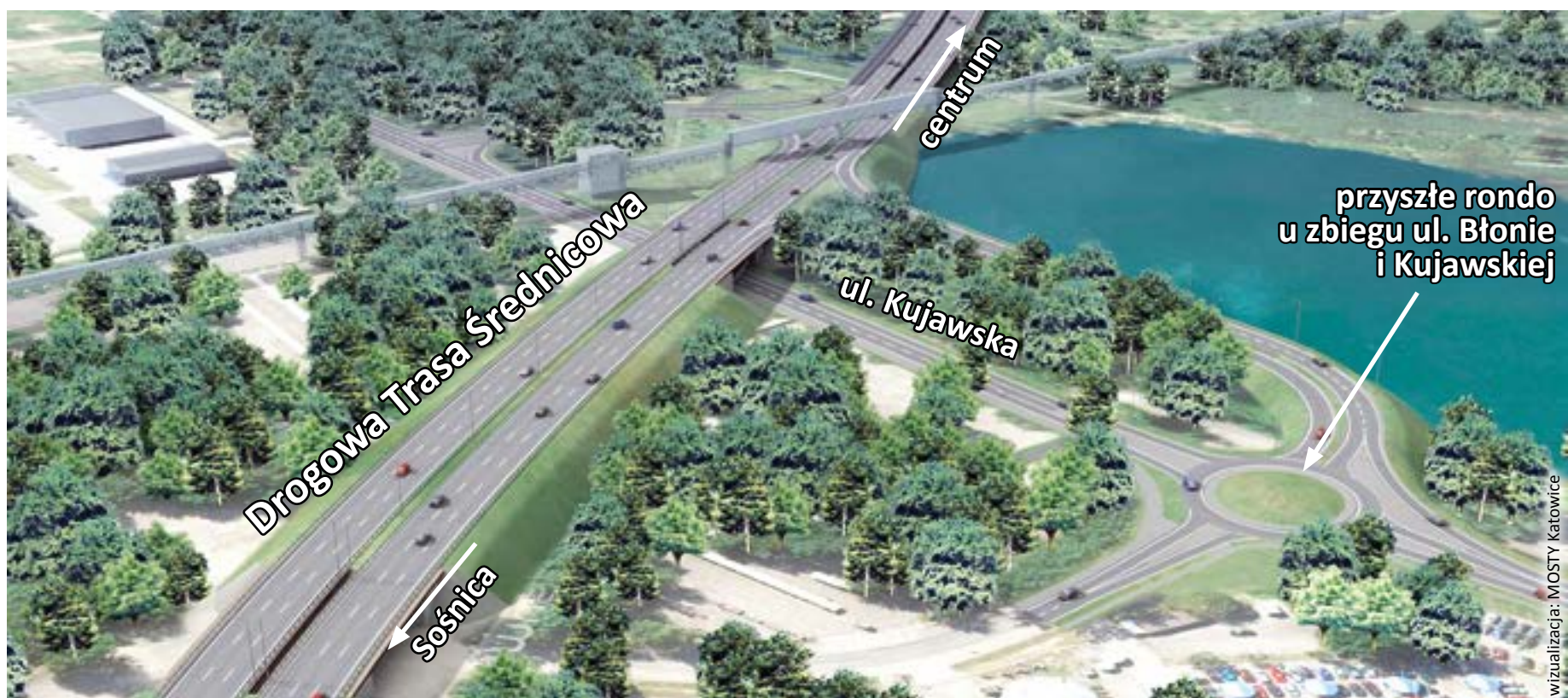
wizualizacja: MOSTY Katowice