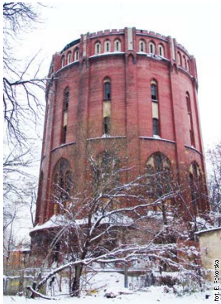
fol. E. Pokorska

Obecnie należy odpowiedzieć na pytanie, jak ratować wieżę. Brak zadaszenia jest największym problemem. Wizja w terenie, zorganizowana 22 lutego, o którą zwróciło się do wojewódzkiego konserwatora zabytków (WKZ) Miasto Gliwice, uświadomiła po raz kolejny, jakie emocje budzi ten obiekt wśród gliwiczian. Jednak, jak już wielokrotnie pisałam, ratowanie zabytków przemysłowych jest bardzo trudne. Wymyślenie nowej funkcji pociąga za sobą modernizację i przebudowę całej budowli. W przypadku wieży – o nietypowym, trudnym do rozwiązania rzucie – to konieczność dobudowy lub znalezienie miejsca na tak prozaiczne pomieszczenia, jak np. WC. Często teren zabytku techniki kryje w sobie całą tablicę Mendelejewa. Reaktywacja takich budynków jest prawie niemożliwa. O tym się jednak zapomina.