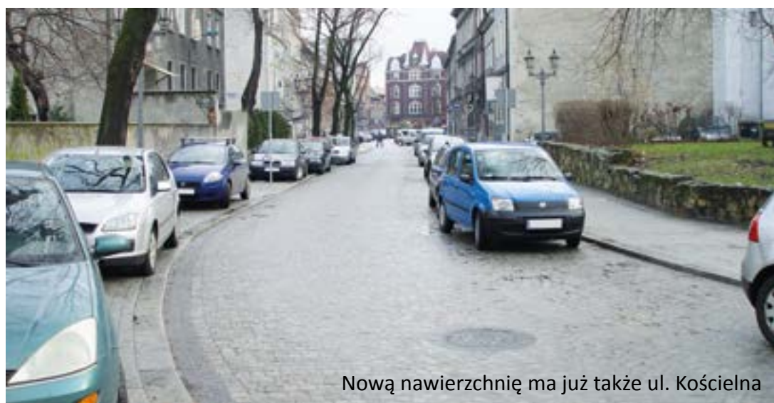
Nową nawierzchnię ma już także ul. Kościelna