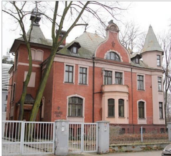
fol. A. Zygmantowska

o zaliczeniu na poczet pierwszej opłaty z tytułu użytkowania wieczystego nieruchomości grunto-