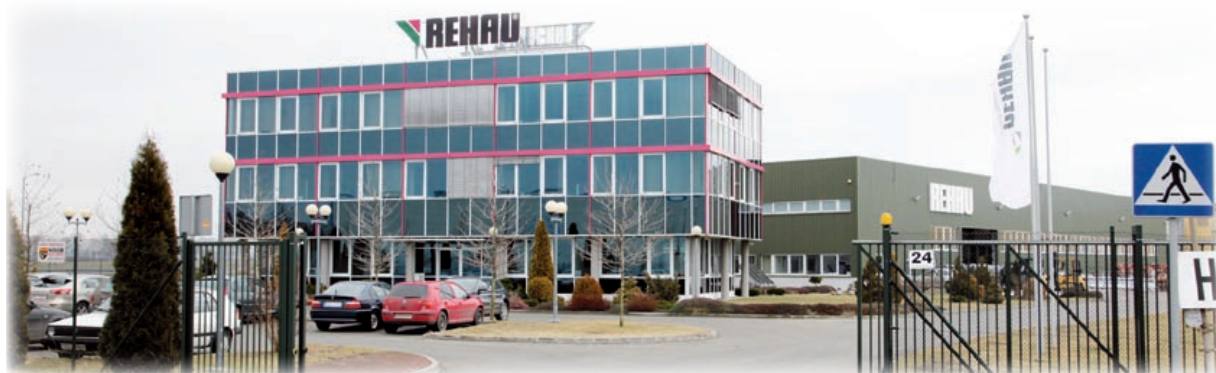
Produkcja okien, uszczeltek, zderzaków czy błotników, plastikowych elementów przydatnych w lotnictwie – tym zajmuje się REHAU