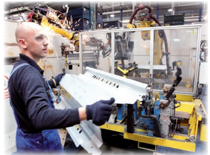
Fiat, Mercedes, BMW – AUTROBOT STREFA projektuje i realizuje przedsięwzięcia dla czołowych marek