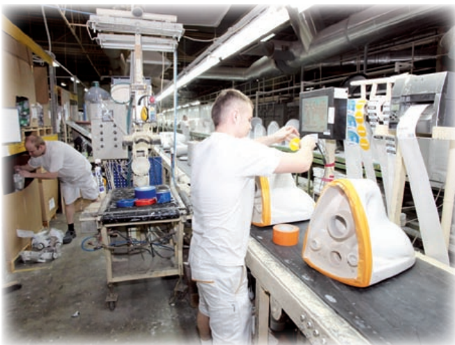
Fabryka w Gliwicach jest najnowocześniejszym zakładem koncernu ROCA w tej części Europy

Pomimo trwającej recesji gospodarczej w gliwickiej podstrefie pojawiły się 4 firmy. Aquatic Investments uruchomiło magazyny dystrybucyjne sieci Tesco przy ul. Bojkowskiej. HL Display, przedsiębiorstwo ulokowane w południowej części obszaru SSE (funkcjonującego po obydwu stronach DK 88 – alei Jana Nowaka-Jeziorańskiego), zadeklarowało produkcję systemów ekspozycji sklepowych. Domeną BMZ Poland (część północna podstawowego