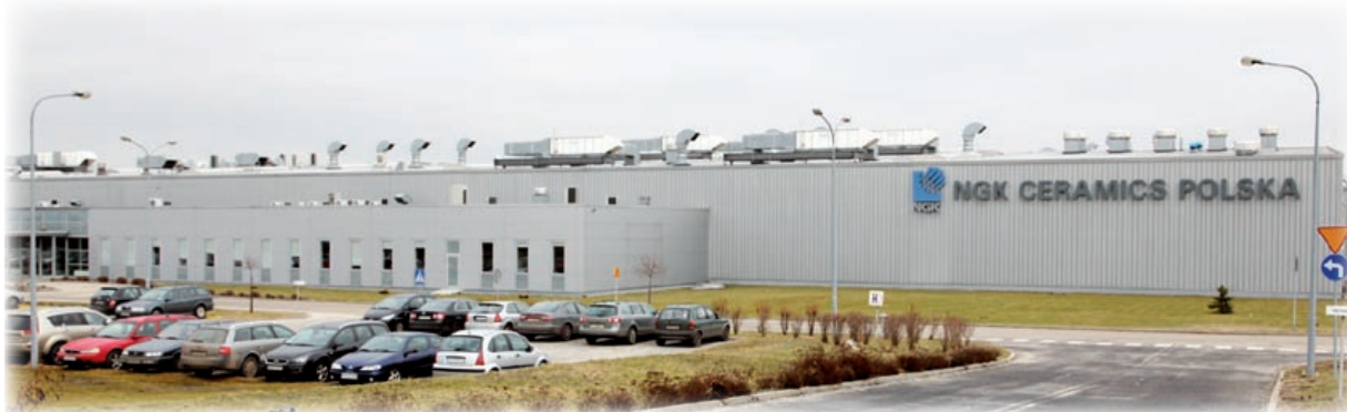
W NGK CERAMICS powstają ceramiczne wkłady do silników diesla. Służą one do filtracji spalin

Przed dwoma laty Katowicka Specjalna Strefa Ekonomiczna wydała 13 zezwoleń na działalność. W 2010 r. zainteresowanie ze strony przedsiębiorców było jeszcze większe! Jak wynika z raportu Państwowej Agencji Informacji i Inwestycji Zagranicznych (PAIiZ), tylko do listopada ub. r. KSSE udało się pozyskać 18 nowych projektów inwestycyjnych – polskich i zagranicznych. Warto też wiedzieć, że liczba udzielonych do tej pory zezwoleń strefowych przekroczyła pułap 300.