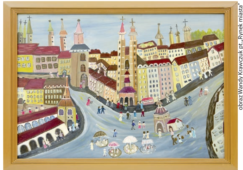
obraz Wandy Krawczuk pt. „Rynek miasta”

– Na wystawie zaprezentujemy zbiór około 50 specjalnie wybranych prac, które – mamy nadzieję – zainteresują zarówno znawców, jak i amatorów sztuki. Zachwyć mnogością tematów, przede wszystkim zaś pozwolą zobaczyć Śląsk pełen kolorów. Zakochaj się w kolorowym Śląsku! – zachęcają muzealnicy. Aby ułatwić to zadanie, w Dniu św. Walentego, 14 lutego, od godziny 10.00 do 18.00 wstęp do Willi Caro będzie bezpłatny dla wszystkich zwiedzających. Wystawa będzie czynna do 14 maja. (bom)