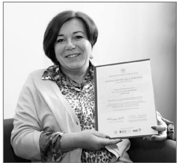
fol. A. Włtwicki

– Na te tematy rozmawialiśmy na wielu lekcjach – nawet na angielskim. Najlepiej uczyć się jednak w praktyce, także poprzez zabawę. Posłaliśmy więc przykładowo do teatru, aby dzieci zrozumiały, że w miejscach publicznych trzeba nosić schludny ubiór, grzecznie się zachowywać, mówić „dzień dobry” i „dziękuję”. Pokazywaliśmy, czym grozi bieganie po korytarzach i schodach, zabawa w domu z zapalkami czy grzebanie w gniazdku elektrycznym. Zasady zdrowego odżywiania wpajaliśmy podczas dni