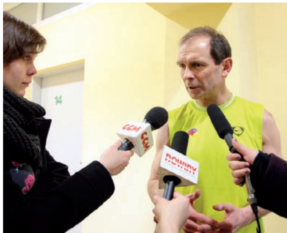
Prezydent miasta wsparł drużynę samorządowców w towarzyskim meczu siatkówki