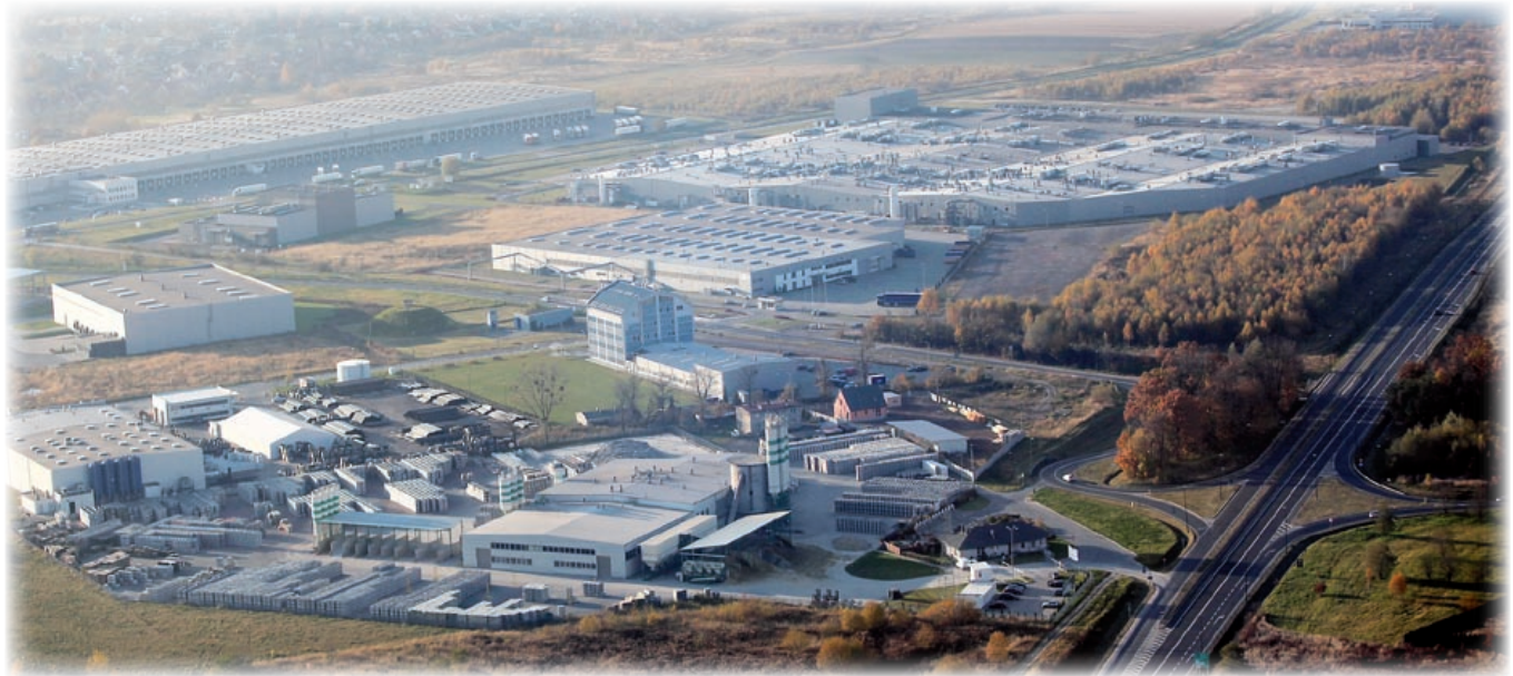
Gliwicką podstrefę zlokalizowano na obszarach wcześniej niezagospodarowanych, w pobliżu ważnych dróg

Gliwicka podstrefa stanowi obecnie największą część Katowickiej Specjalnej Strefy Ekonomicznej (jednej z 14 stref w całym kraju). Powstała w 1996 r. Ma działać do końca 2020 r. Powołano ją w celu przyspieszenia procesów restrukturyzacji przemysłu oraz stworzenia nowych miejsc pracy w regionie. Początkowo znajdowała się tylko w naszym mieście. Z czasem wykraczała poza granice Gliwic i województwa śląskiego. Obejmuje dzisiaj tereny usytuowane w Zabrzcu, Knurowie, Rudzińcu i Lublińcu oraz Strzelcach Opolskich, Ujeździe, Kietrzcu, Gogolinie, Krapkowicach i Kędzierzynie-Koźlu (patrz mapa na stronie obok). Do 2009 r. zajmowała łącznie 678 ha. W styczniu ubiegłego roku uległa powiększeniu do 981 ha. Jej powierzchnia w Gliwicach wynosi obecnie 378 ha. Pierwotnie miała 349 ha.