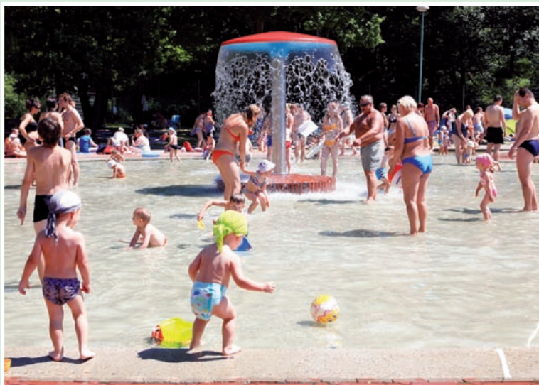
fol. A. Wittwicki

boiska do siatkówki i koszykówki oraz plac zabaw dla dzieci.