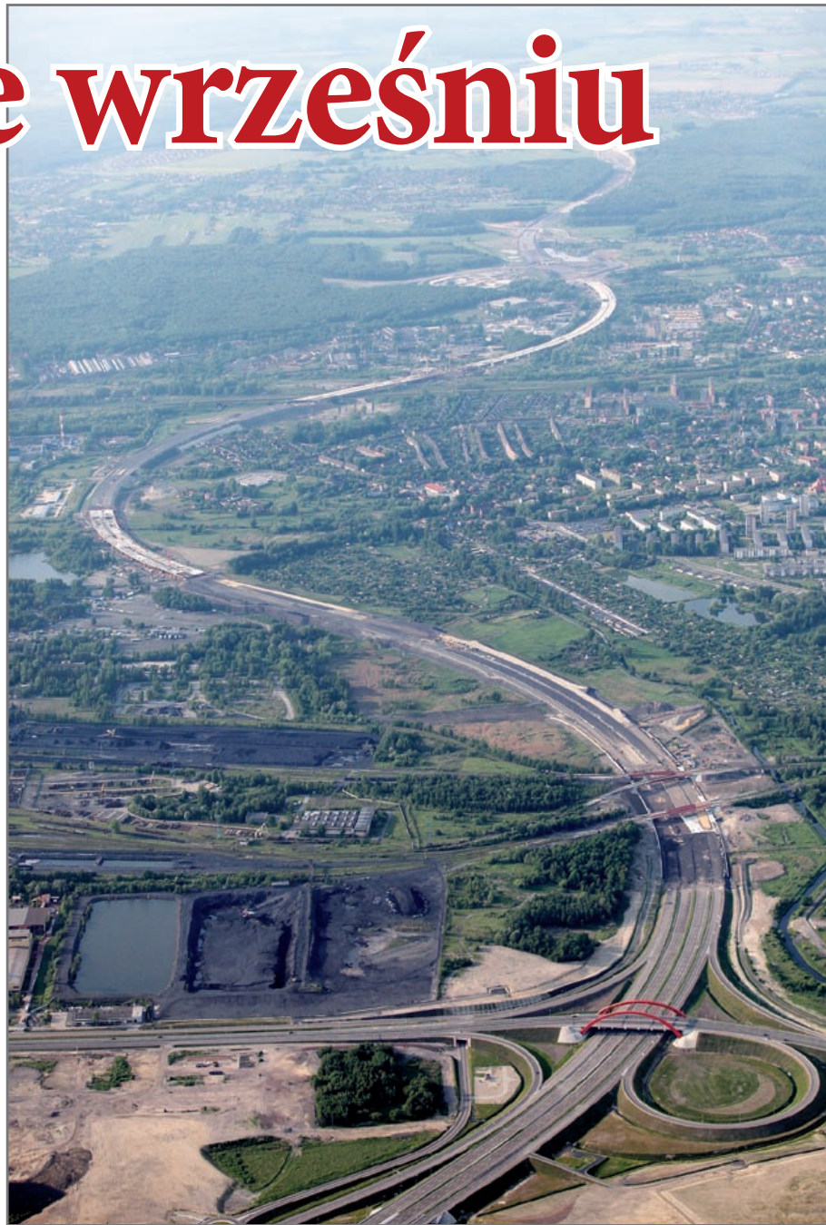
Odcinek autostrady A1 „Sośnica-Maciejów” w całości przebiega przez nasze miasto. Na trasie znalazły się m.in. takie przeszkody, jak ul. Chorzowska, rzeka Bytomka, tory kolejowe, ul. Królewskiej Tamy, rzeka Kłodnica, ul. Kujawska i droga krajowa nr 88.

– To ciekawe rozwiązanie. Na początek powstało 6 stanowisk do nasuwania, na których betonowano 20- lub 40-metrowe fragmenty nasuwane potem nad ulice czy tory bez konieczności zatrzymywania ruchu. Wystarczyło jedynie wprowadzić ograniczenie prędkości