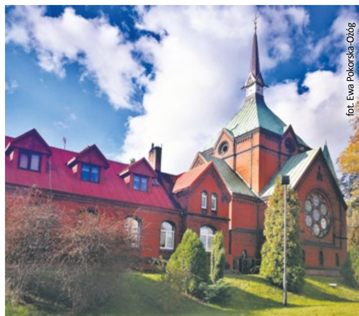
fol. Ewa Pokorska-Ożóg