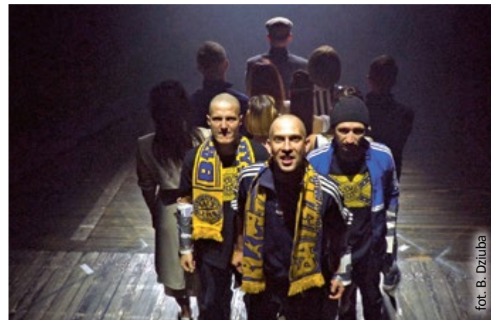
fol. B. Dziuba

– To zrealizowany jako tzw. Mastershot Teatr TV, z elementami umownymi, formalnymi, jak i prawie filmowymi wariacjami na temat. W tym teatralnym labiryncie wszystko doskonale się ze sobą splata i wszystko jest bardzo ze sobą połączone.