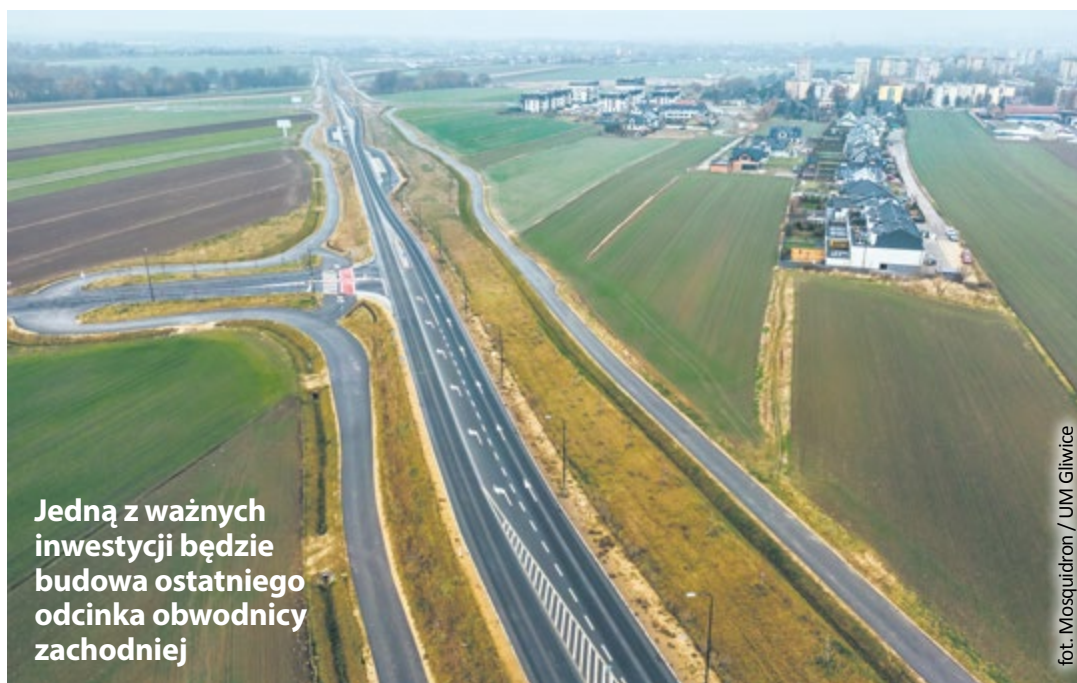
Jedną z ważnych inwestycji będzie budowa ostatniego odcinka obwodnicy zachodniej

Aby utrzymać budżet w ryzach, miasto ogranicza zaciąganie nowych dużych kredytów, bo koszty ich obsługi bardzo wzrosły. Równocześnie na razie nie są dostępne środki zewnętrzne