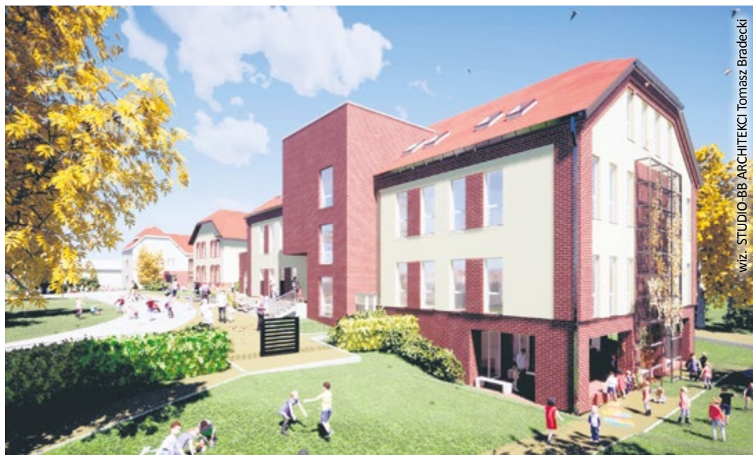
wiz. STUDIO-BB ARCHITEKCI Tomasz Bradecki

W nowoczesnej placówce powstaną sale dla dzieci z bezpośrednim dostępem do toalet, szatnie, duża kuchnia z zapleczem i stołówka, zaplecze socjalne, pomieszczenia dla specjalistów, a przy budynku place zabaw. Zlokalizowana będzie tam również kotłownia, co umożliwi oddzielne i samodzielne ogrzewanie nowego budynku. Do tej pory stary budynek był zasilany, tak jak pozostałe, z jednej ko-