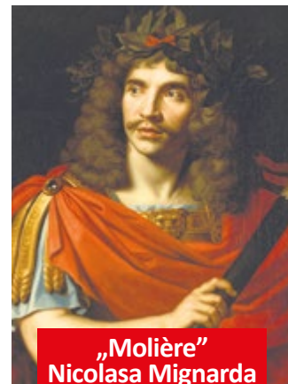
„Molière” Nicolasa Mignarda

Jean Baptiste Poquelin – z wykształcenia prawnik, który nigdy nie pracował w zawodzie, jako Molière przeszedł do historii teatru. Założył w Paryżu trupę teatralną, która zbankrutowała, a sam Molière trafił do więzienia za długi. Nie ostudziło to jego entuzjazmu i wkrótce po zakończeniu odsiadki wrócił do pracy wędrownego aktora.