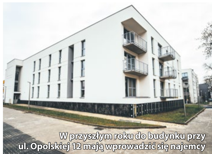
W przyszłym roku do budynku przy ul. Opolskiej 12 mają wprowadzić się najemcy

– 160 mieszkań z 5 budynków z ul. Dworskiej zostanie zasiedlonych na podstawie umów najmu zasobu komunalnego