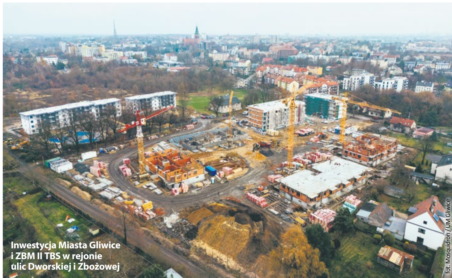
Inwestycja Miasta Gliwice i ZBM II TBS w rejonie ulic Dworskiej i Zbożowej

W dwóch miejskich budynkach powstających przy ul. Zbożowej znajdzie się 55 wygodnych mieszkań, w tym 3-pokojowe o powierzchni od 55 m 2 do 65 m 2 (12 lokali) oraz 2-pokojowe o powierzchni od 54 m 2 do 59 m 2 (35 lokali), z odrębną kuchnią bądź aneksem kuchennym. Sześć lokali to kawalerki o powierzchni 40 m 2 . Dodatkowo dwa 2-pokojowe mieszkania o powierzchni 59 m 2 będą dostosowane stricte