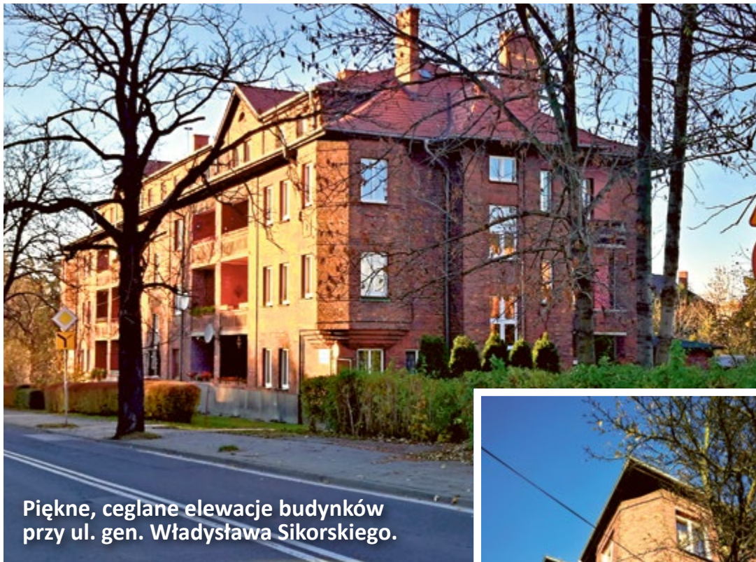
Piękne, ceglane elewacje budynków przy ul. gen. Władysława Sikorskiego.