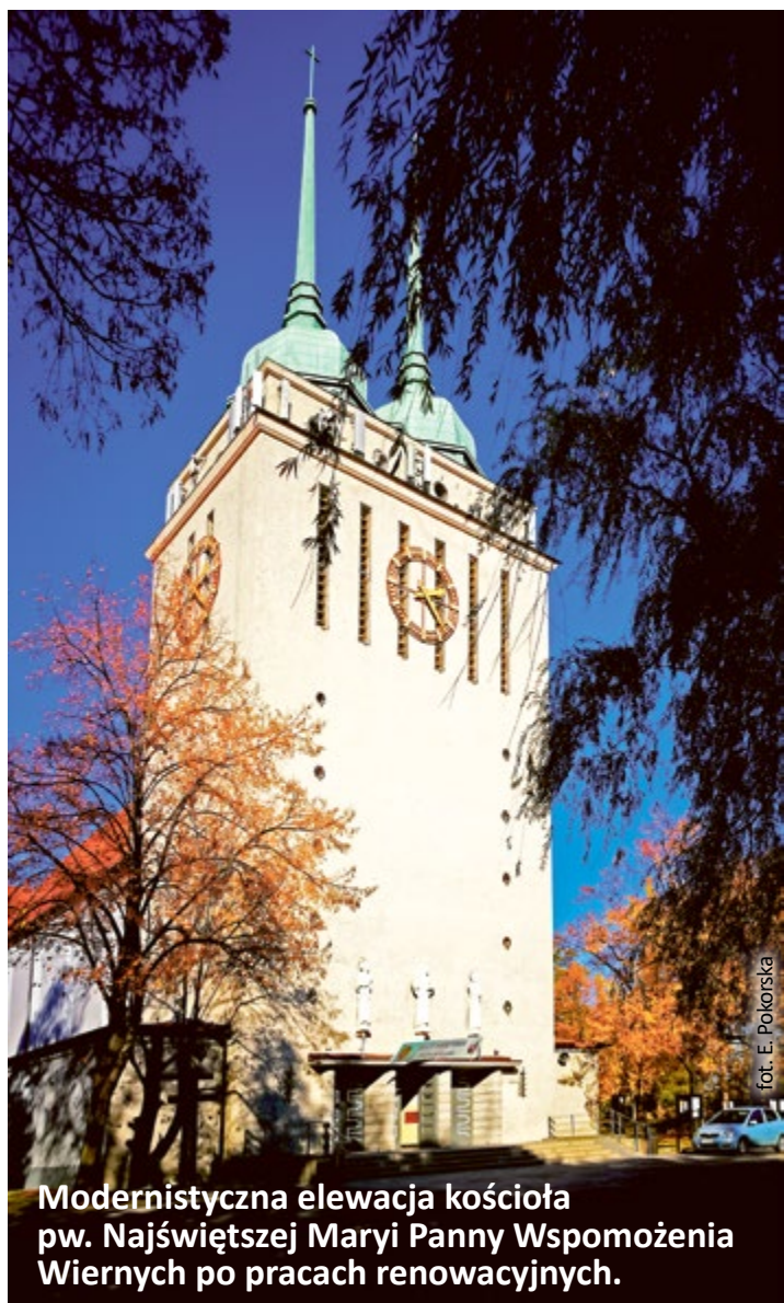
Modernistyczna elewacja kościoła pw. Najświętszej Maryi Panny Wspomożenia Wiernych po pracach renowacyjnych.