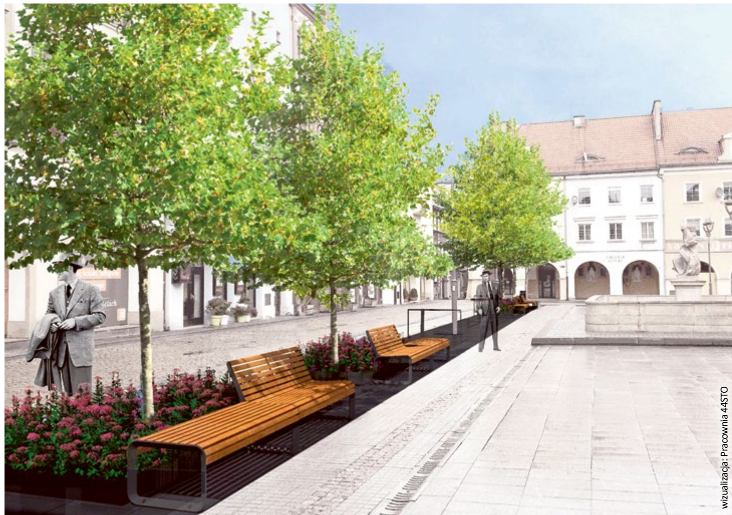
wizualizacja: Pracownia 44STO

Taki system ZDM zastosuje po raz pierwszy. Wykorzysta go także podczas sadzenia drzew przed dworcem kolejowym – przy okazji budowy Centrum Przesiadkowego. Pozwoli on na odpowiednie umocowanie drzew, napowietrzanie i nawadnianie. Niewłaściwemu rozrostowi korzeni zapobiegą maty antykorzeniowe i folie ochronne, które równocześnie zabezpieczą – wraz z niewielkim cokółkiem – przed spływaniem