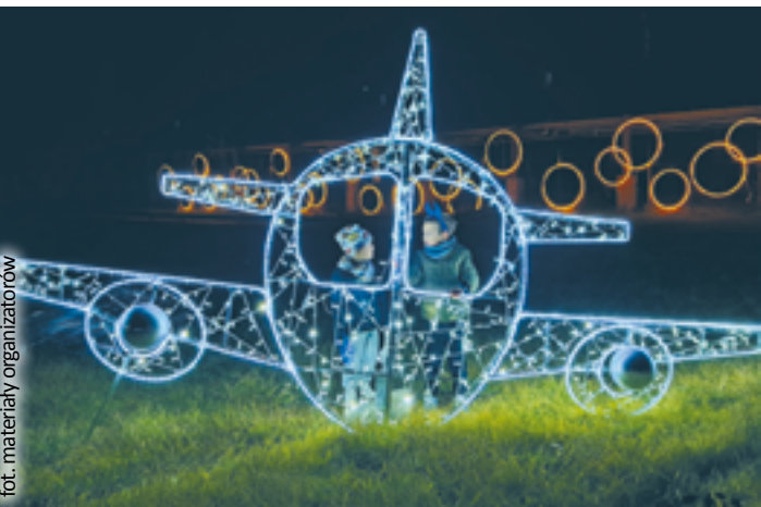
fol. materiały organizatorów