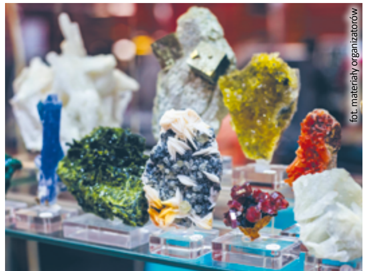
fol. materiały organizatorów

Bilety na giełdę kosztują 10 i 15 zł. Dzieci do 5. roku życia wchodzi