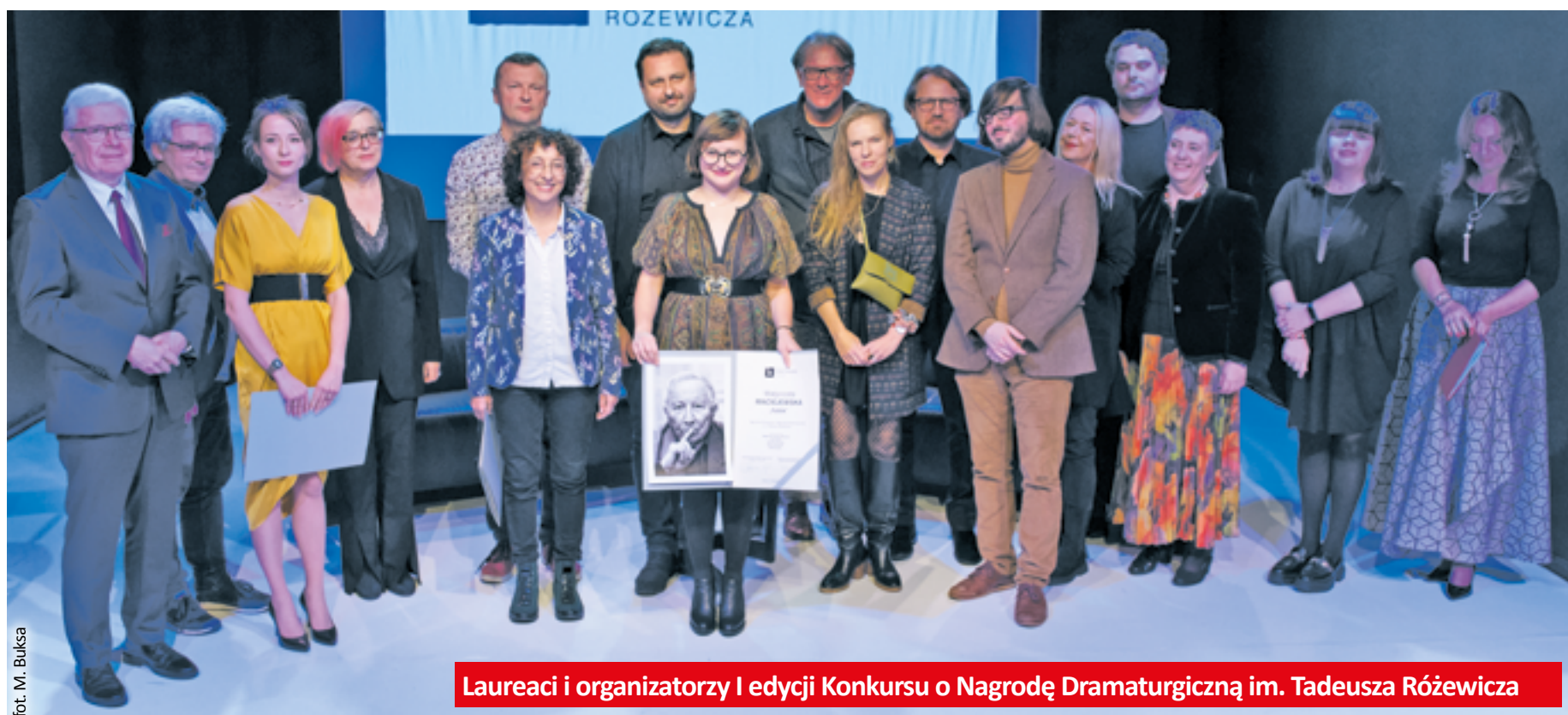
Laureaci i organizatorzy I edycji Konkursu o Nagrodę Dramaturgiczną im. Tadeusza Różewicza