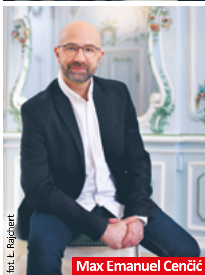
Max Emanuel Cenčić