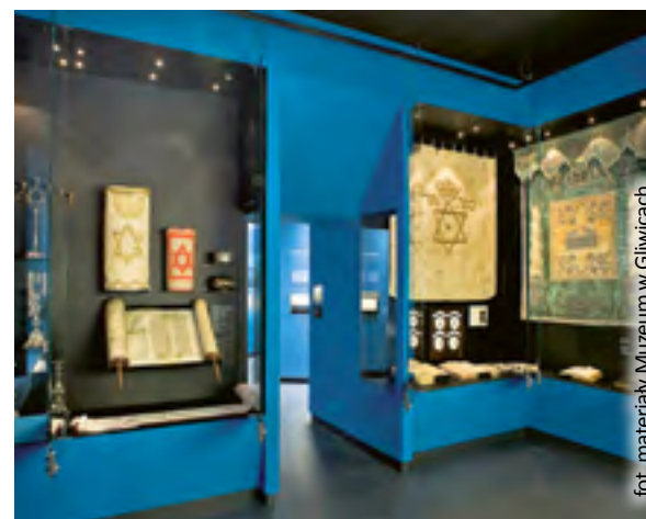
fol. materiały Muzeum w Gliwicach

z oddziałem gliwickiego Muzeum, które od lat opiekują się dziedzictwem żydowskim w regionie.