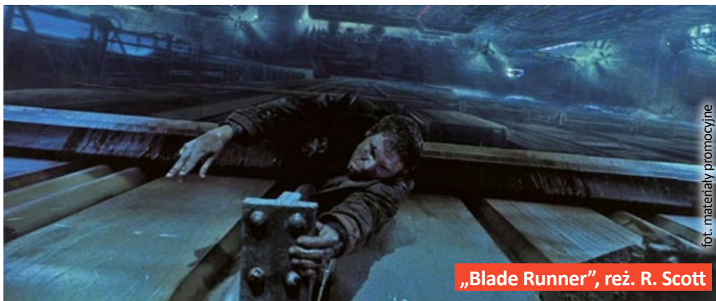
„Blade Runner”, reż. R. Scott