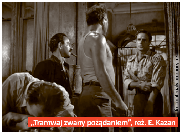
„Tramwaj zwany pożądaniem”, reż. E. Kazan

Warto było zaryzykować, bo to Braciom Warner kinomani z wdzięczającą pierwszy film dźwiękowy: „Śpiewak jazzbandu”. Kino Amok (ul. Dolnych Wałów 3) wyświetli ten obraz w czwartek 5 listopada. Następnie, 19 listopada, widzowie zobaczą niezapomnianą „Casablancę” Michała Curtiza. Na 3 grudnia zaplanowano projekcję „Tramwaju