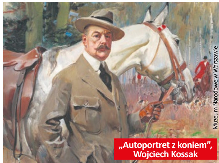
„Autoportret z koniem”, Wojciech Kossak

Muzyka z filmowych adaptacji powieści Henryka Sienkiewicza i Józefa Krzewskiego w połączeniu z historycznymi obrazami Jana Matejki i Wojciecha Kossaka stworzą niesamowity, muzyczno-malarski klimat Narodowego Święta Niepodległości. 11 listopada w Teatrze Miejskim (ul. Nowy Świat 55–57) wystąpi zespół Impresja.