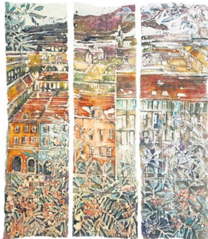
„Odcienie jesieni – Rynek”