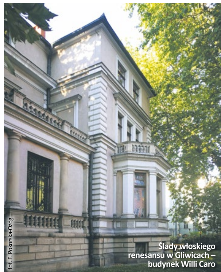
Ślady włoskiego renesansu w Gliwicach – budynek Willi Caro