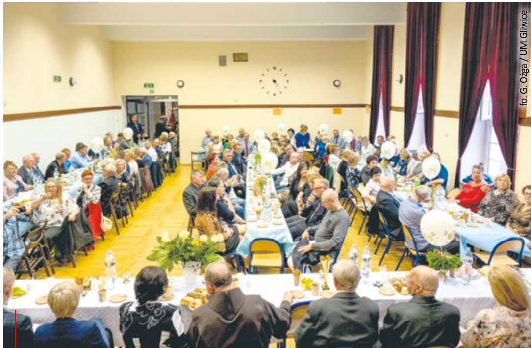
W jubileuszu 40-lecia działalności Klubu Abstynentów „Krokus” uczestniczyło około 140 osób związanych z „Krokusem” i wspierających stowarzyszenie, darczyńcy oraz sympatycy klubu.

– Naszym podstawowym celem jest propagowanie życia wolnego od substancji zmieniających świadomość, prowadzenie działalności integrującej środowiska abstynenckie i pomoc osobom uzależnionym i ich rodzinom. W naszej działalności, poza funkcją czysto terapeutyczną, ogromne znaczenie ma kontakt z drugim człowie-