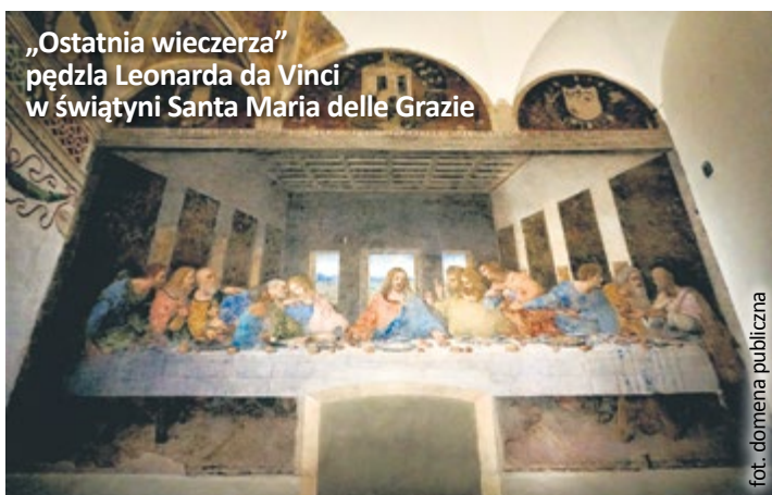
„Ostatnia wieczerza” pędzla Leonarda da Vinci w świątyni Santa Maria delle Grazie

Zwano go il Vate (wieszcz) i dlate- go stanowił niejaki zagrożenie dla pozycji przywódcy narodu, Be- nito Mussoliniego. Oczywiście nie podoobało się to samemu Duce , który otoczył poetę luksusem, a tak naprawdę zamknął w złotej klatce. Spłacając jego długi, jednocześnie go kontrolował. W zadziwiającej, osobliwej, kla- ustrofobicznej rezydencji Vittoriale w Gardone nad jeziorem Garda, pełnej różnorodnych sprzętów, miał miejsce „zimowy romans” sławego artysty i uwodziciela z polską malarką Tamarą Łempic- ką. Romans-nieromans, bowiem Polka jako jedyna z podbijanych przezeń kobiet okazała się od- porna na wdzięki D’Annunzia. To zdarzenie stało się kanwą sztuki „Tamara” kanadyjskiego pisarza Johna Krizanca, wystawionej po