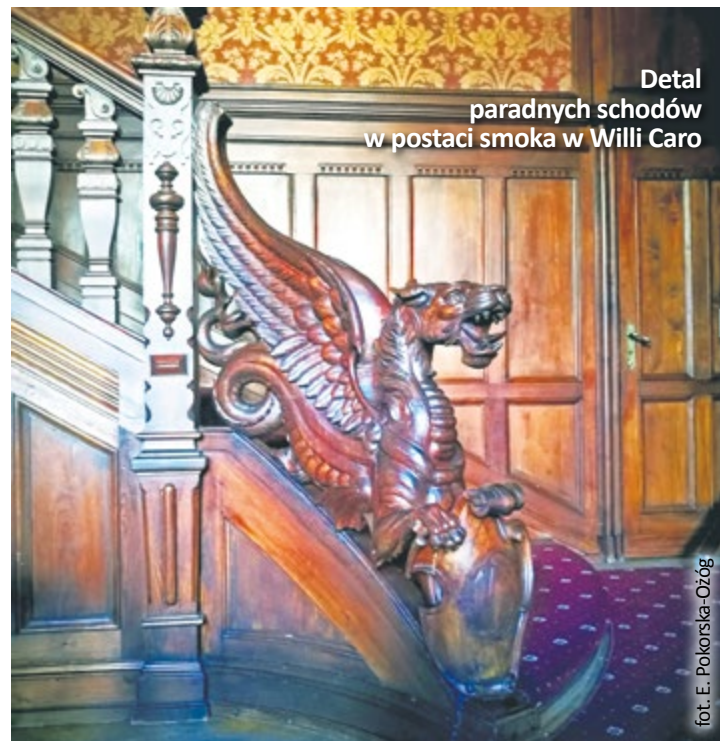
Detal paradnych schodów w postaci smoka w Willi Caro