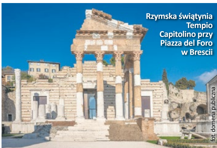
Rzymska świątynia Tempio Capitolino przy Piazza del Foro w Brescii