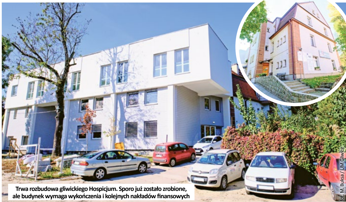
Trwa rozbudowa gliwickiego Hospicjum. Sporo już zostało zrobione, ale budynek wymaga wykończenia i kolejnych nakładów finansowych

W gliwickiej placówce, na oddziale stacjonarnym jest 25 łóżek, które zawsze są zajęte. Dodatkowo, zespół domowej opieki paliatywnej opiekuje się 160 chorymi, a pod opieką poradni medycyny paliatywnej pozostaje około 100 pacjentów. Wszyscy mają zapewnioną opiekę lekarską, pielęgniarską, rehabilitacyjną, psychologiczną i w razie potrzeby – duchownego. Nad chorymi czuwa ponad 50 osób zatrudnionych w Hospicjum Miłosierdzia Bożego i około 40 wolontariuszy, którzy pomagają podczas codziennych czynności, dzieląc się swoją uwagą