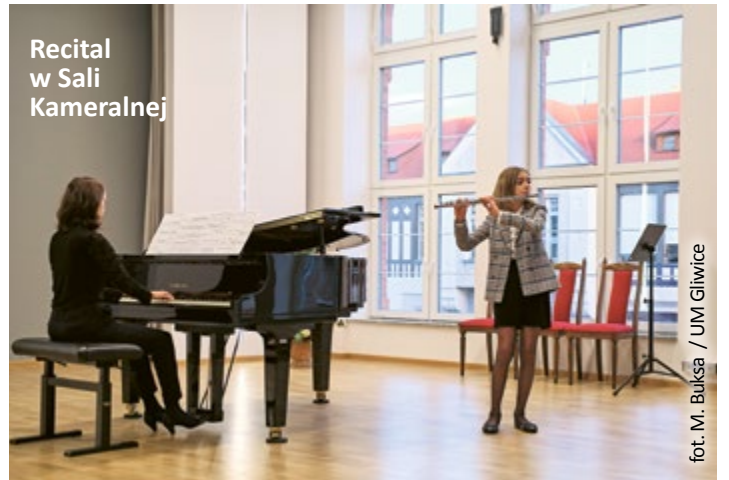
Recital w Sali Kameralnej

Dzień wcześniej, w czwartek 13 października, w gmachu Państwowej Szkoły Muzycznej odbędą się Miejskie Obchody Dnia Edukacji Narodowej z udziałem prezydenta Gliwic Adama Neumanna. Galę uświetnią występy uczniów i absolwentów PSM. Początek uroczystości – godz. 17.00. (kik)