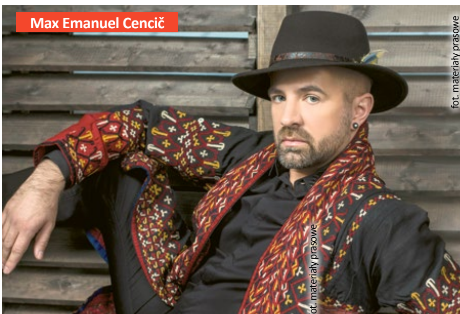
Max Emanuel Cencić

19 listopada w sali koncertowej w nowej siedzibie Państwowej Szkoły Muzycznej I i II stopnia im. L. Różyckiego w Gliwicach (ul. Ziemowita 12) swój recital fortepianowy na instrumencie historycznym wykona laureatka Międzynarodowego