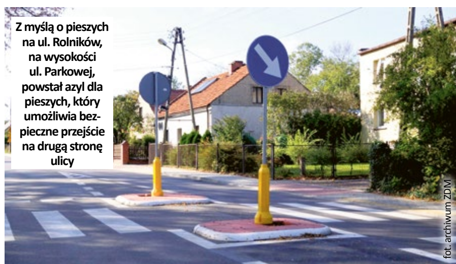
Z myślą o pieszych na ul. Rolników, na wysokości ul. Parkowej, powstał azyl dla pieszych, który umożliwia bezpieczne przejście na drugą stronę ulicy

W ostatnim czasie progi zwalniające pojawiły się też na ul. Tokarskiej w Ostropie. (mf)