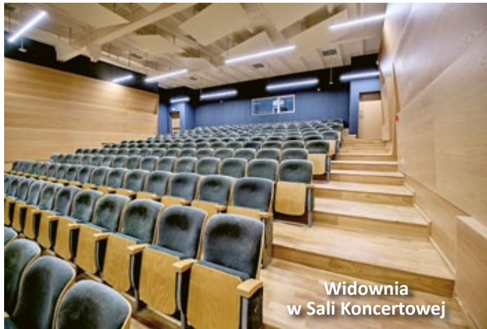
Widownia w Sali Koncertowej

kątem wymogów nowoczesnego kształcenia muzycznego, został w pełni dostosowany do potrzeb osób z niepełnosprawnościami.