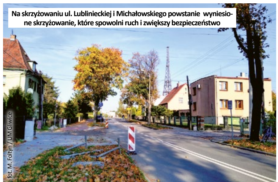
Na skrzyżowaniu ul. Lublinieckiej i Michałowskiego powstanie wyniesione skrzyżowanie, które spowolni ruch i zwiększy bezpieczeństwo

Na czas budowy ruch w obrębie krzyżówki w ciągu ul. Lublinieckiej zostanie zawężony. Zależnie od etapu robót objazd będzie wyznaczony ulicami: Na Miedzy i Polną lub ulicami: Wita Stwosza i Cheł-