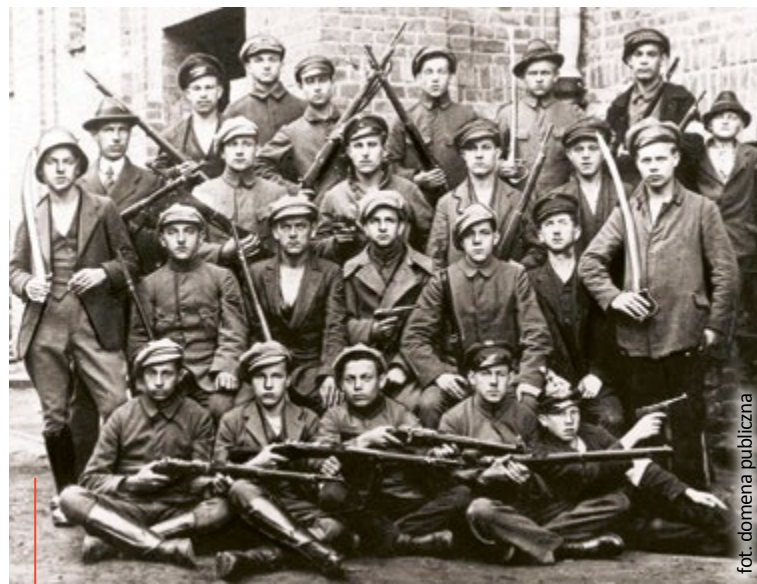
Powstańcy śląscy 1921 r.

Promocja książki połączona z wykładem autora odbędzie się w piątek (14 października) w Willi Caro (ul. Dolnych Wałów 8a). Początek o godz. 17.00. Wstęp wolny. (mm)