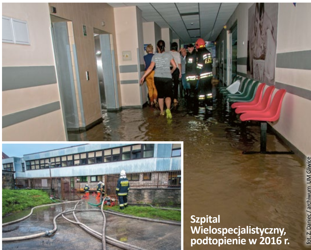
Szpital Wielospecjalistyczny, podtopienie w 2016 r.

Prace nad zagospodarowaniem wskazanym w koncepcji będą prowadzone równolegle z budową zbiornika i zostaną ukończone w zbliżonym czasie – w 2022 roku. (UM)