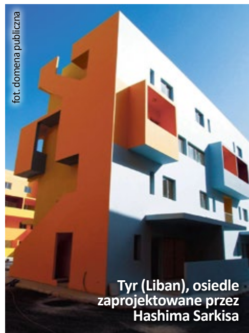
Tyr (Liban), osiedle zaprojektowane przez Hashima Sarkisa