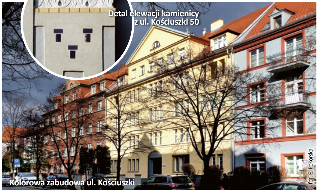
Kolorowa zabudowa ul. Kościuszki

Odnowiona już jakiś czas temu błękitna secesyjna kamienica z ul. T. Kościuszki 50 nie przeszkadza modernistycznej (zielonkawej) zabudowie akcentującej zbieg z ulicą I. Daszyńskiego. Modry, spławiaty kolor ścisza bowiem kremowa tonacja płytek ceramicznych z okładziny fragmentów elewacji, a nieliczne kobalto-we ce-