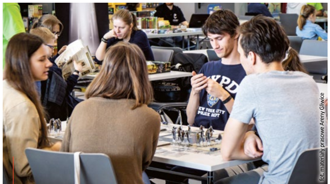
fot. materiały prasowe Areny Gliwice