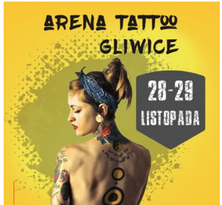
Celem wydarzenia jest pokazanie wyjątkowości ludzkiego ciała oraz trendów w jego ozdabianiu.

Arena Tattoo jest częścią projektu o nazwie BodyMody prowadzonego przez IKG Technology. – BodyMody to tematy takie jak tatuaż i inne modyfikacje, kosmetologia,