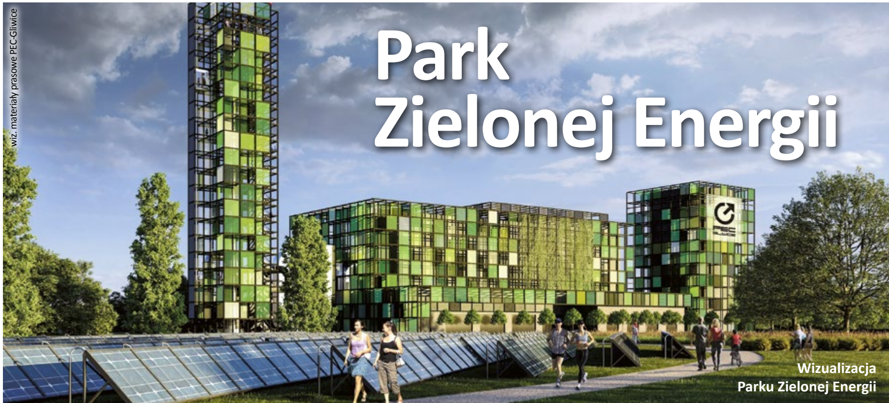
Wizualizacja Parku Zielonej Energii

Gliwicka ciepłownia zostanie rozbudowana o nowy blok z kotłem wielopaliwowym, wytwarzającym ciepło i energię elektryczną. Inwestycja będzie kluczowym elementem gospodarki obiegu zamkniętego miasta Gliwice. Dzięki niej będzie możliwe pełne odzyskanie termicznej energii z odpadów komunalnych, ograniczenie zużycia węgla, obniżenie emisji szkodliwych substancji do środowiska oraz stabilizacja cen produkowanego ciepła. Za przygotowanie projektu, budowę oraz eksploatację Parku Zielonej Energii będzie odpowiedzialna miejska spółka: Przedsiębiorstwo Energetyki Ciepłej – Gliwice!