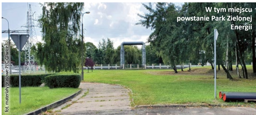
W tym miejscu powstanie Park Zielonej Energii

Ideą PEC – Gliwice jest wyjście z informacją do opinii publicznej, m.in. poprzez wykorzystanie miejskich nośników, zorganizowanie prezentacji na uczelniach, przygotowanie spaceru po terenie inwestycji dla mieszkańców, opracowanie broszury informacyjnej oraz wiele innych, o których spółka będzie informować opinię publiczną. (PEC – Gliwice)