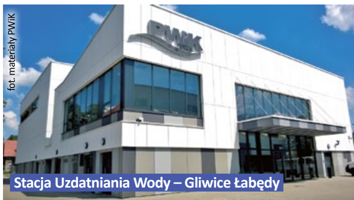
Stacja Uzdatniania Wody – Gliwice Łabędy

Więcej informacji na temat PWiK można znaleźć na stronie internetowej pwik.gliwice.pl . (mf)