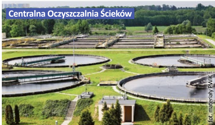
Centralna Oczyszczalnia Ścieków