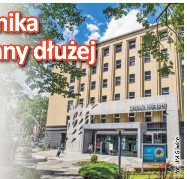
fol. UM Gliwice

W piątek, 1 października, Urząd Miejski w Gliwicach będzie czynny od godz. 8.00 do 16.00. Klienci będą mogli załatwić swoje sprawy urzędowe we wszystkich filiach UM o godzinę dłużej niż zwykle. (UM)