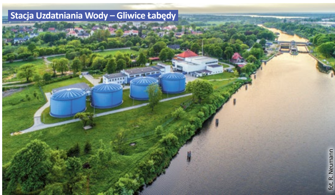
Stacja Uzdatniania Wody – Gliwice Łabędy

Długość obsługiwanej sieci kanalizacji sanitarnej wynosi 687,31 km