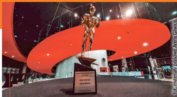
Arena Gliwice została uznana za najlepszy obiekt sportowy w kraju

projekty i organizacje w marketingu sportowym i sponsoringu. Ponownie doceniony został Robert Lewandowski, który dzięki swoim działaniom marketingowym i wizerunkowym jest już globalną gwiazdą, a w kategorii Organizacja Sportowa Nagrodę Biznesu Sportowego otrzymała PGNiG Superliga, za dynamiczny rozwój i profesjonalizację. Najlepszym Sponsorem Sportu został Totalizator