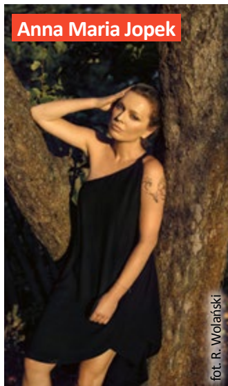
Anna Maria Jopek

Podczas PalmJazzu 2020 publiczność spotka się z kilkoma