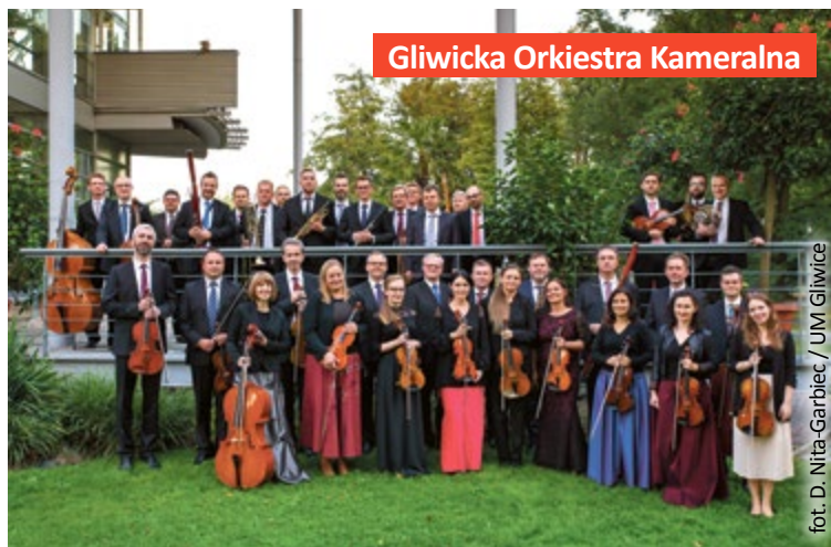
Gliwicka Orkiestra Kameralna

zasilają najlepsze zespoły w kraju, na przykład Narodową Orkiestrę Symfoniczną Polskiego Radia, Sinfonię Varsovię, Filharmonię Śląską. Połączenie ich talentów i doświadczeń zaowocowało wypracowaniem bardzo wysokiego poziomu artystycznego orkiestry. Każdego roku GOK występuje w Gliwicach kilkakrotnie, między innymi podczas „Mistrzowskich interpretacji”, koncertu „Na pożegnania lata” czy występu z cyklu „Estrada młodych”. (mm)