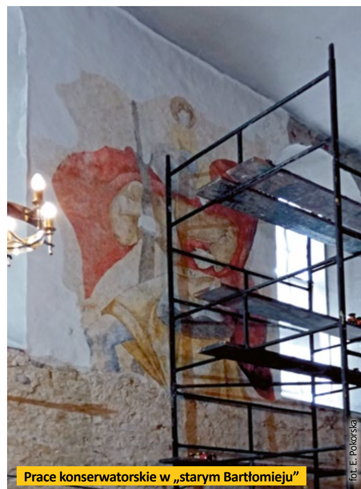
Prace konserwatorskie w „starym Bartłomieju”