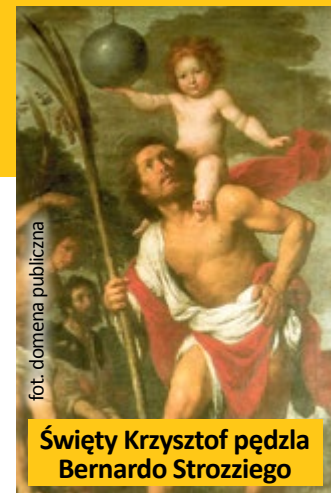
Święty Krzysztof pędzla Bernardo Strozziiego

żar całego świata. Na pamiątkę ofiarowało Ono Krzysztofowi kij (kostur), który ożył – puścił listki i kwiaty. Na gliwickim malowidle to drzewko, którego górną część niestety kiedyś skuto.