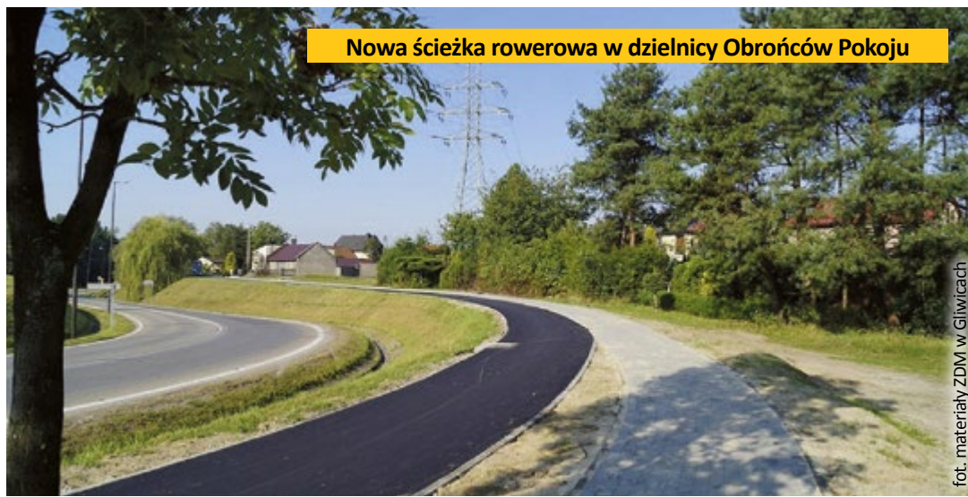
Nowa ścieżka rowerowa w dzielnicy Obrońców Pokoju

miłośników ekstremalnej jazdy na hulajnogach i rolkach. To zamknięta pętla o długości około 120 m, po której można jeździć w obu kierunkach. Tor ma 6 muld i profilowane zakręty umożliwiające rozpędzanie się i utrzymywanie prędkości bez konieczności pedałowania, wyposażono go w przeszkody o wysokości do 120 cm. Skarpa toru została obłożona trawnikiem, w pobliżu znajduje się ławka, kosz na śmieci i stojak na rowery. Inwestycję o wartości 229 tys. zł w ramach GBO 2020 zrealizowała firma VELO PROJEKT Sp. z o.o. z Białogostoku, ta sama, która w 2018 r. zbudowała pierwszy w Gliwicach