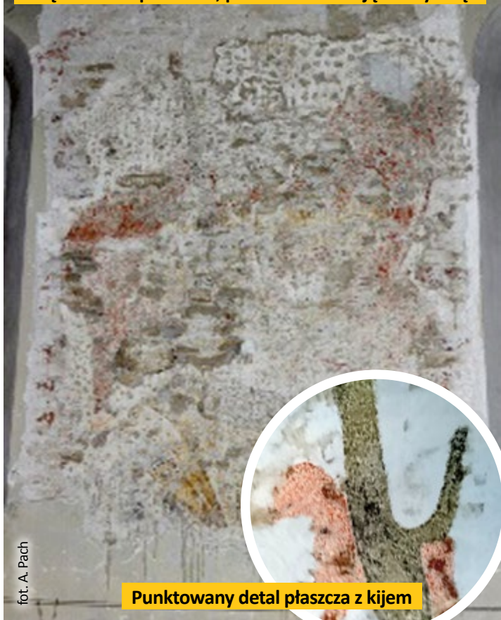
fol. A. Pach

Polichromie w kościółku pw. św. Bartłomieja po odsłonięciu i zabezpieczeniu, przed konserwacją estetyczną