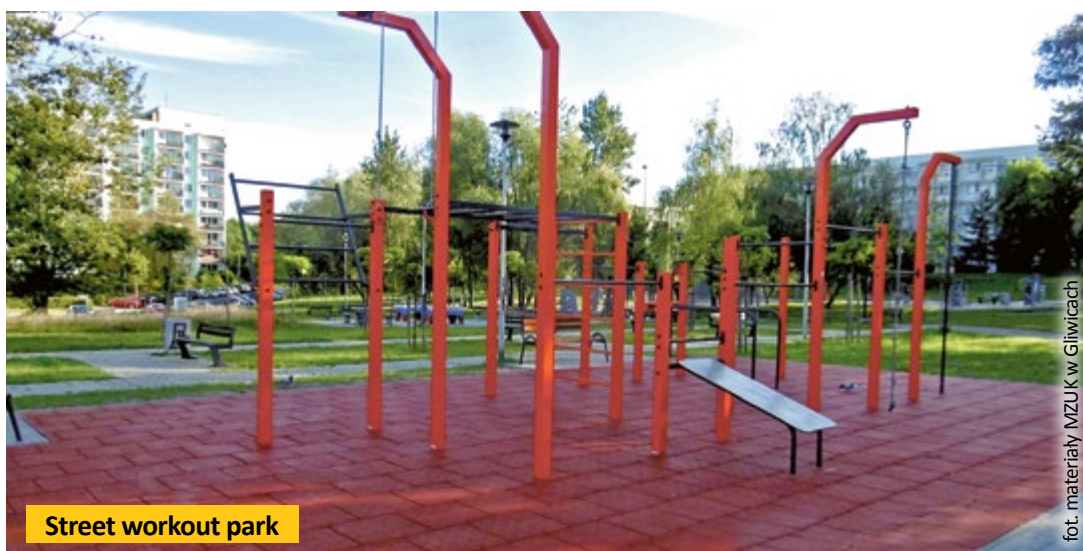
Street workout park

Strefa aktywnej rekreacji powstaje w Sośnicy przy pływalni Neptun. Wcześniej zbudowano tam już siłownię zewnętrzną, plac zabaw i boisko, a od kilkunastu dni można też wykonywać ewolucje i ćwiczyć płynną jazdę bez pedałowania na muldach nowego pumptracku. Z pewnością cieszyć on rowerzystów oraz