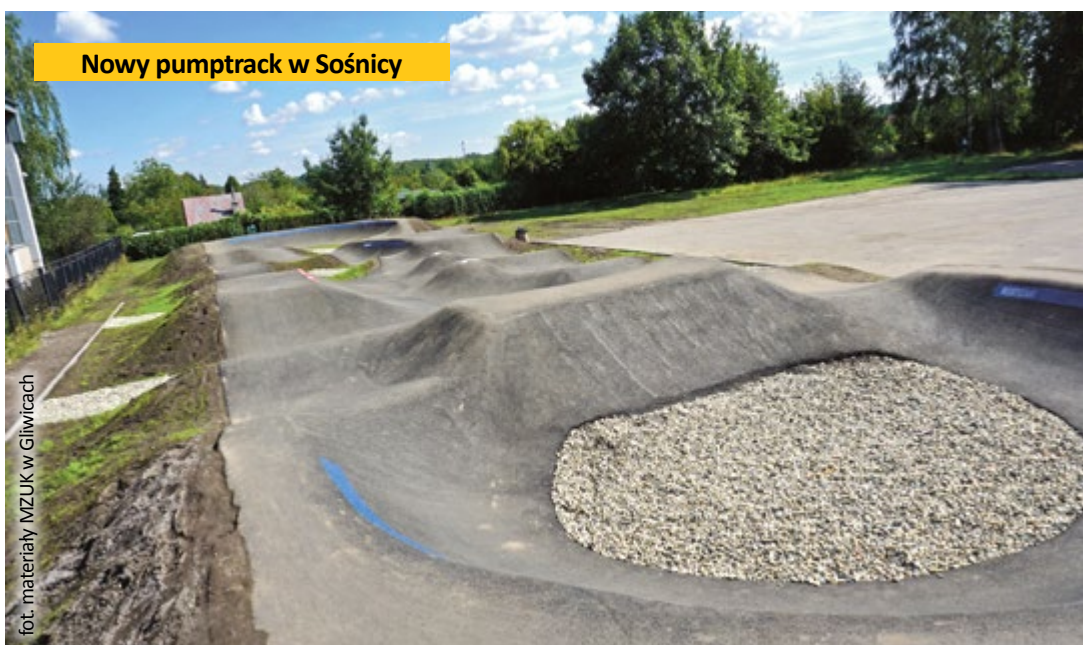
Nowy pumptrack w Sośnicy

W dzielnicy Obrońców Pokoju zakończyła się budowa ścieżki rowerowej od łącznicy DK88 z ul. Tarnogórską do ul. Przydrożnej. Zadanie zrealizowano w ramach Gliwickiego Budżetu Obywatelskiego. Około 200-metrowa ścieżka rowerowa jest komfortowym i bezpiecznym połączeniem z ul. Tarnogórskiej w kierunku dzielnicy Obrońców Pokoju. Przy okazji prac wyremontowano chodnik wzdłuż drogi dla rowerów. Koszt realizacji wyniósł 210 tys. zł. (mf)