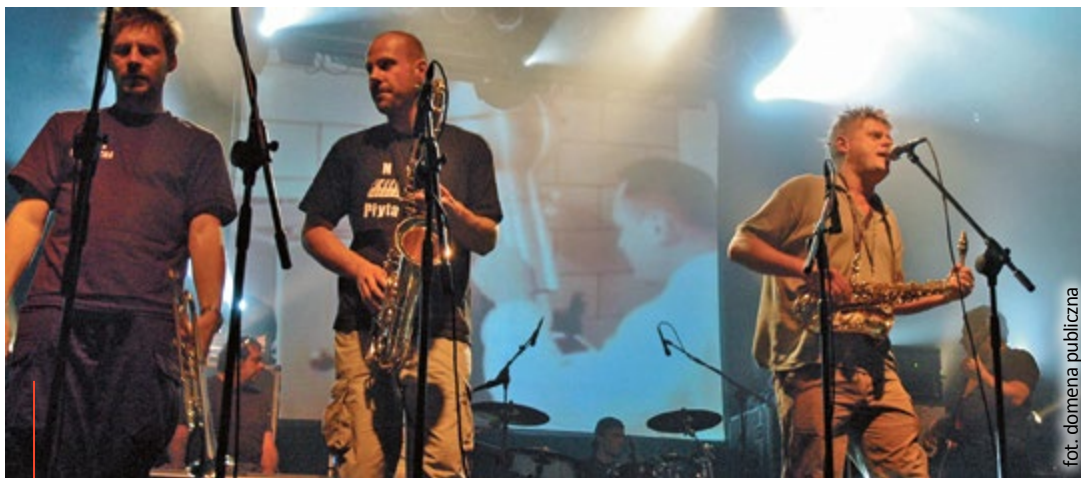
Zespół Kult pojawi się w Arenie Gliwice 14 listopada.

– Koncert Kultu to duże wydarzenie w krajowej skali, więc czujemy się zaszczytzeni, że zespół 14 listopada zagości właśnie u nas. Oczywiście występ odbędzie się z wszystkimi koniecznymi obostrzeniami bezpieczeństwa i troską o gości. Jesteśmy przygotowani na przyjęcie wszystkich, którzy kupią