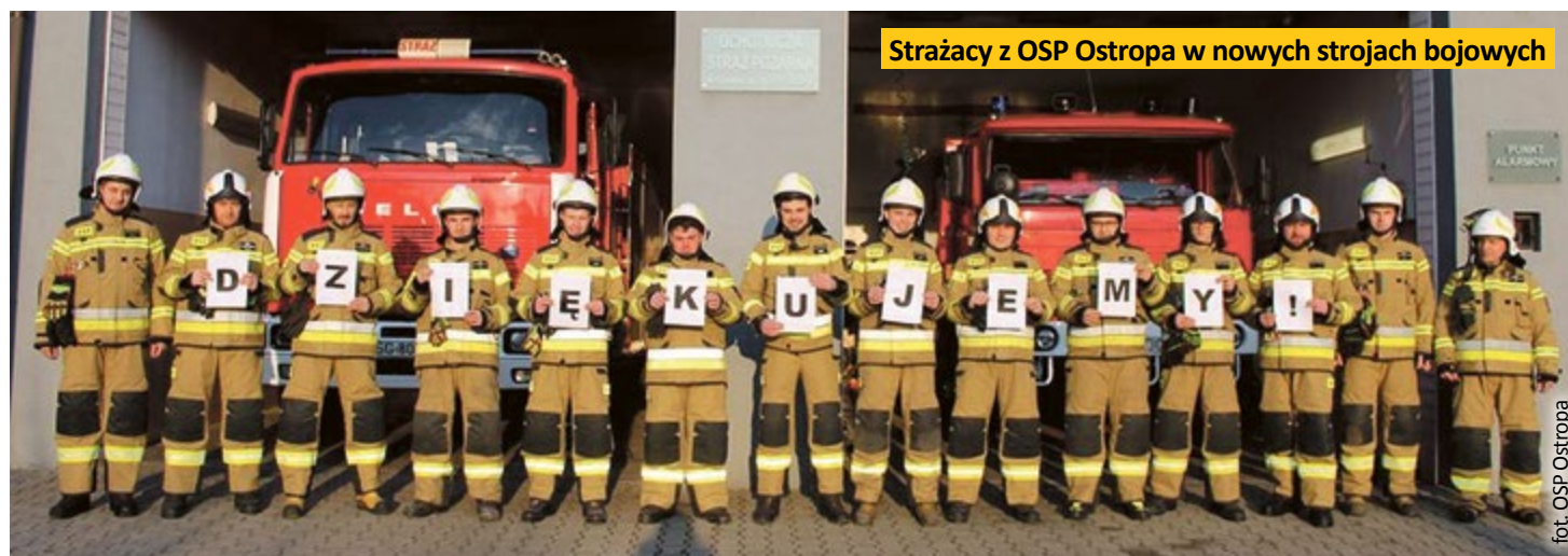
Strażacy z OSP Ostropa w nowych strojach bojowych

Nowa odzież ochronna, przestrzeń do ćwiczeń fizycznych i rowerowych ewolucji, udogodnienia dla osób niepełnosprawnych, strefa rekreacji – to kolejne pomysły, zgłoszone w ubiegłorocznej edycji Gliwickiego Budżetu Obywatelskiego, które w tym roku zostały zrealizowane.