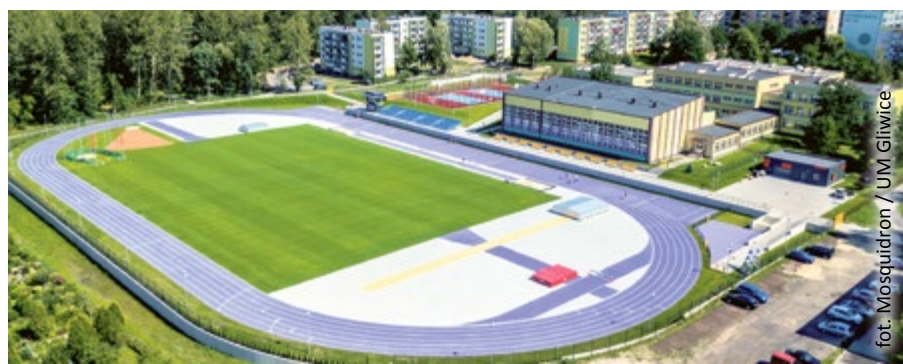
fol. Miosquidron / UM Gliwice

Wariacje na 4 tapy czyli baw się razem z psami