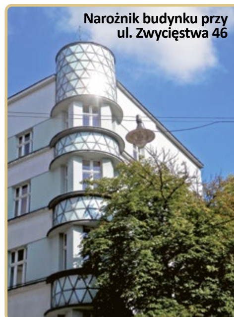
Naroznik budynku przy ul. Zwycięstwa 46