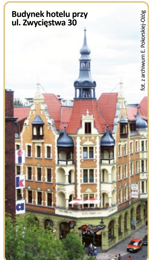
Budynek hotelu przy ul. Zwycięstwa 30