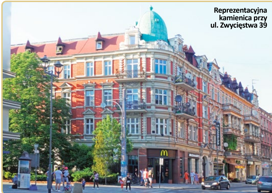
Reprezentacyjna kamienica przy ul. Zwycięstwa 39

À propos moderny – warto sobie uświadomić, że już przed II wojną światową w miastach wznoszono obiekty, których współczesnymi odpowiednikami są dzisiejsze centra handlowe. Taką właśnie rolę pełnił Dom Tekstylny Weichmana (ul. Zwycięstwa 37) projektu Ericha Mendelsohna, powstały w 1922 roku. Zbudowano go przy alei prowadzącej do parku. Taka lokalizacja była celowa. Pod względem architektonicznym budynek był odpowiednio wyeksponowany, a pod względem komercyjnym – umożliwiał łatwiejszy dostęp do sklepu. Podobną funkcję pełnił dom handlowy „Defaka” (ul. Zwycięstwa 23), późniejszy „Ikar”, wzniesiony około 1930 roku w stylu wczesnego funkcjonalizmu według projektu Justusa Fieglera,