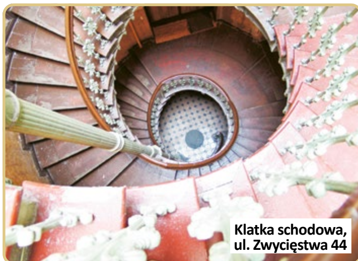
Klatka schodowa, ul. Zwycięstwa 44

czy usytuowany tuż przy Rynku dom towarowy Fedora Karpego z charakterystycznymi tarasami na górze (ul. Zwycięstwa 2).