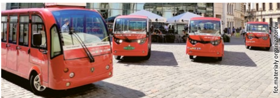
fol. materiały organizatorów