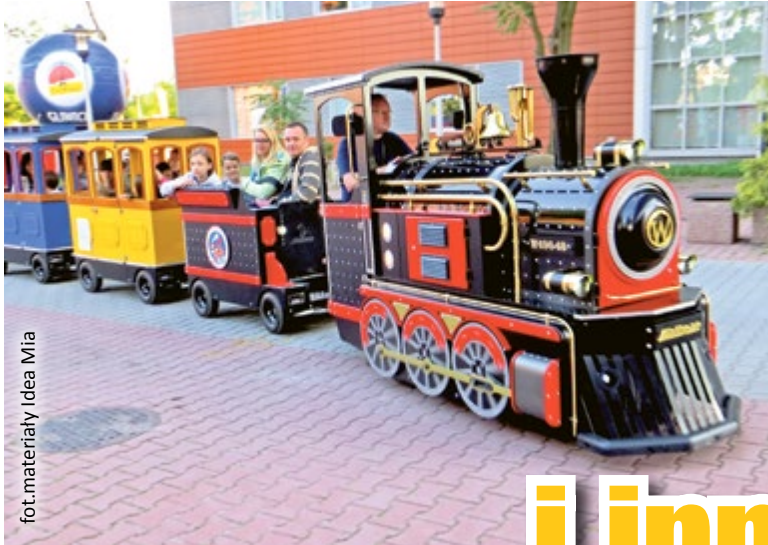
fol. materiały Idea Mia