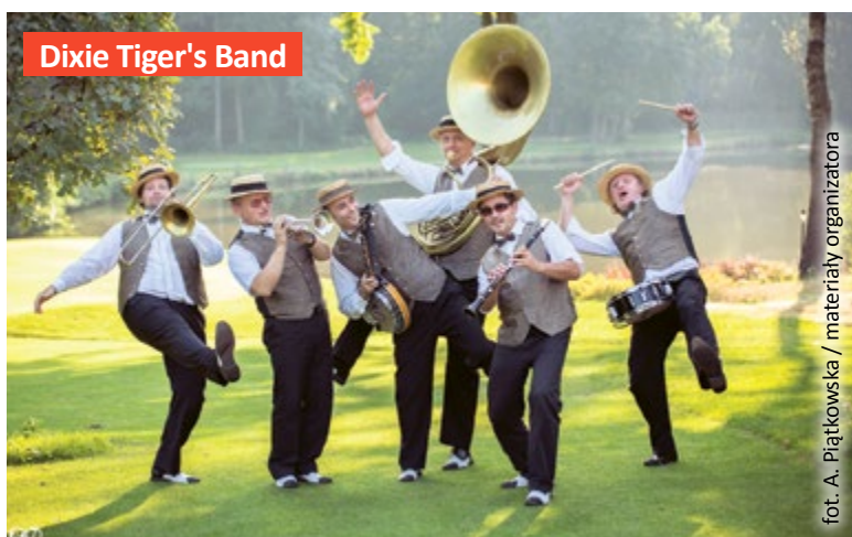
Dixie Tiger's Band