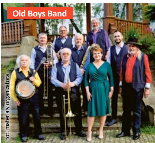
Old Boys Band