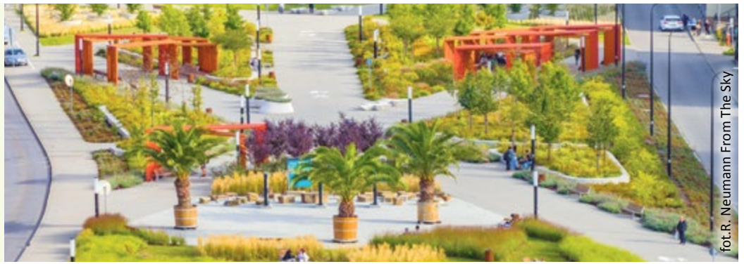
fol. R. Neumann From The Sky

19.00 udostępnienie dla ruchu kołowego odcinków ulic Zwycięstwa i Bohaterów Getta Warszawskiego