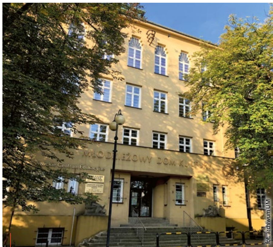
Oferta Młodzieżowego Domu Kultury realizowana jest nie tylko w budynku przy ul. Barlickiego, ale także w innych placówkach w różnych dzielnicach Gliwic

Co teraz? Na postanowienia administracyjne w tego typu sprawach, miastu przysługuje możliwość złożenia zażalenia do Ministra Edukacji i Nauki. Z takiej możliwości Gliwice skorzystały, bo nie zgadzają się z uwagami kuratora. Prezydent wystąpił o zmianę postanowienia i pozytywne za-