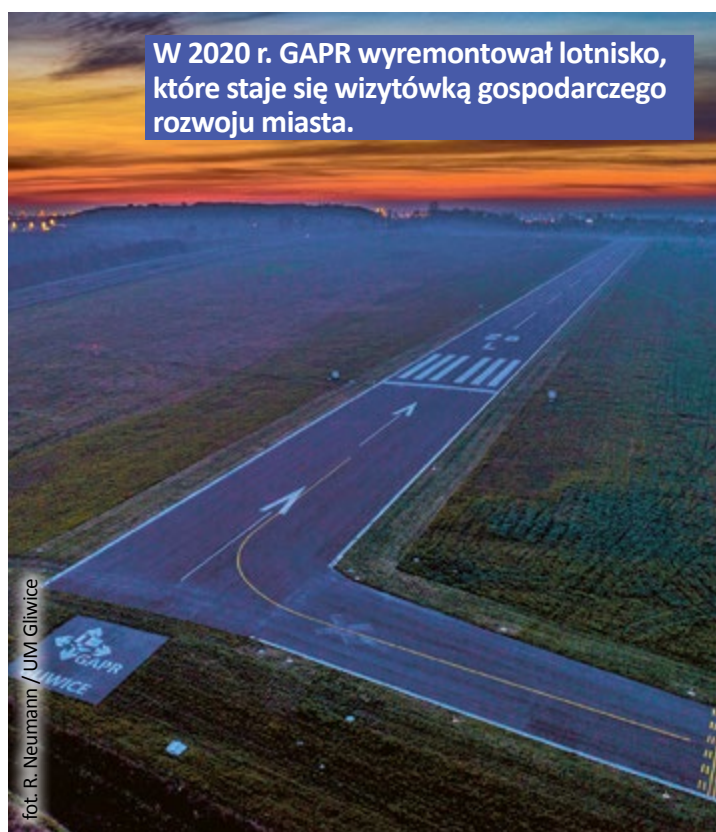
W 2020 r. GPR wyremontował lotnisko, które staje się wizytówką gospodarczego rozwoju miasta.

Więcej informacji na temat GPR można znaleźć na stronie internetowej www.gapr.pl . (mf)