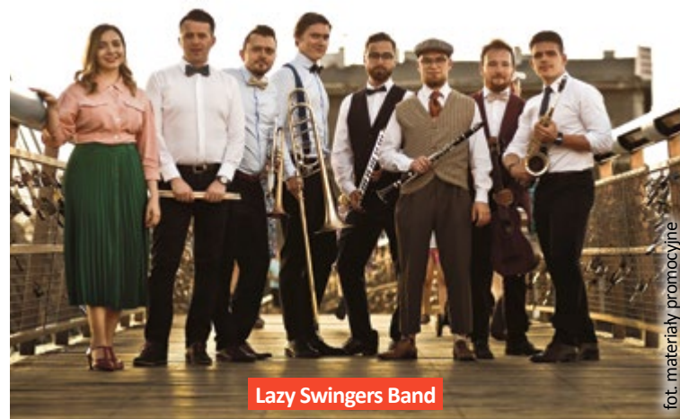
Lazy Swingers Band

Organizatorem festiwalu jest Fundacja Jazzu Tradycyjnego. Wstęp na koncerty jest bezpłatny. Impreza jest dofinansowana z budżetu Miasta Gliwice. (mm)