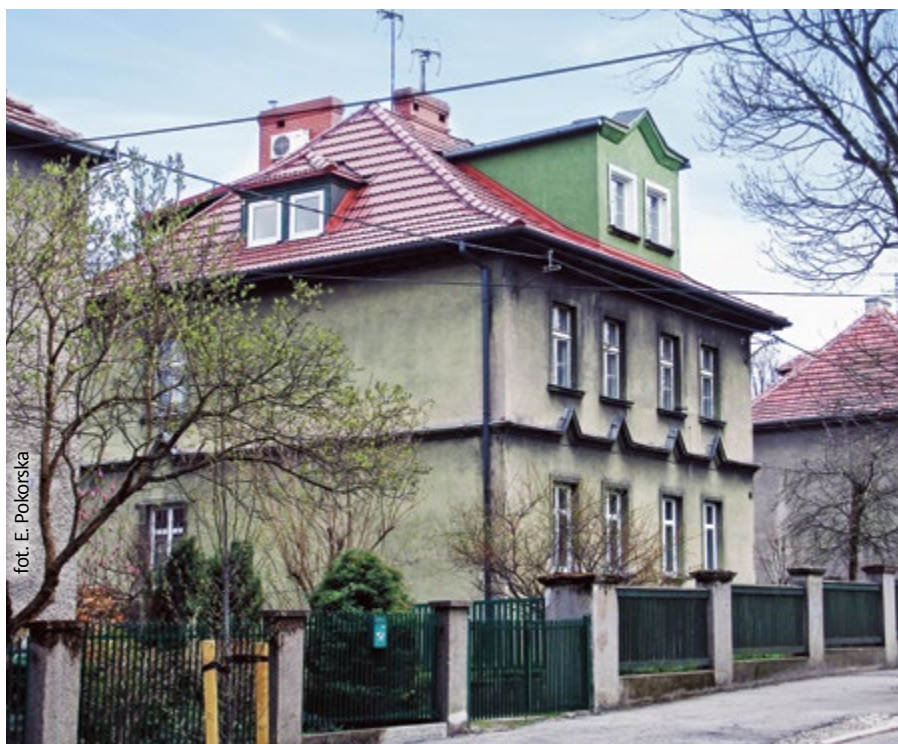
fot. E. Pokorska

Ewa Pokorska miejski konserwator zabytków