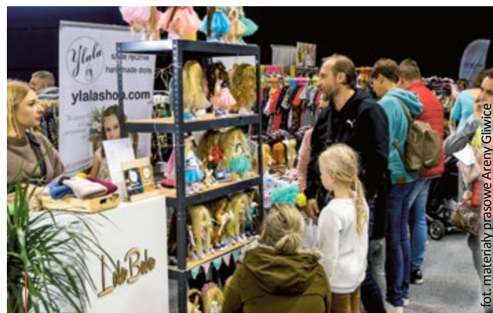
Targi zostaną zorganizowane z zachowaniem wszystkich wymogów bezpieczeństwa