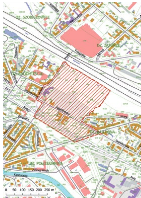
granice opracowania miejscowego planu zagospodarowania przestrzennego miasta Gliwice dla obszaru położonego po południowej stronie terenów kolejowych w rejonie ulicy Piwnej i Drogowej Trasy Średnicowej

Organem właściwym do rozpatrzenia uwag jest Prezydent Miasta Gliwice, a w przypadku uwag nieuwzględnionych przez Prezydenta Miasta Gliwice – Rada Miasta Gliwice.