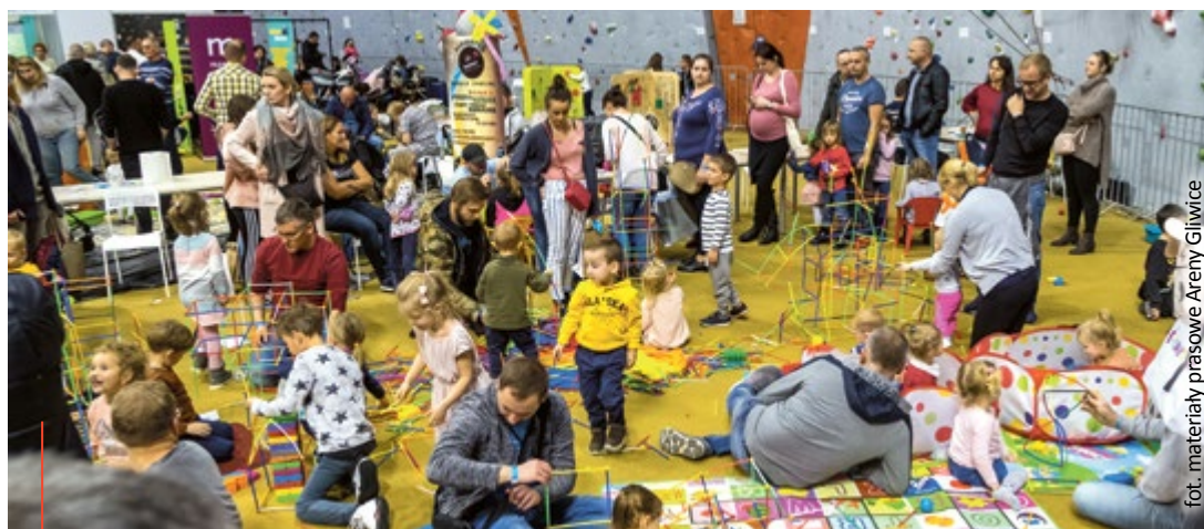
Targi 4 For Kids to ciekawy pomysł spędzenia czasu z rodziną

Podczas wydarzenia spotkamy także postacie ze znanej prawie wszystkim dzieciom „Akademii Pana Kleksa”. Sam Profesor Ambroży Kleks będzie częstował wszystkich swoimi PIEGAMI, a doktor Pai-Chi-Wo przeprowadzi efektowne eksperymenty