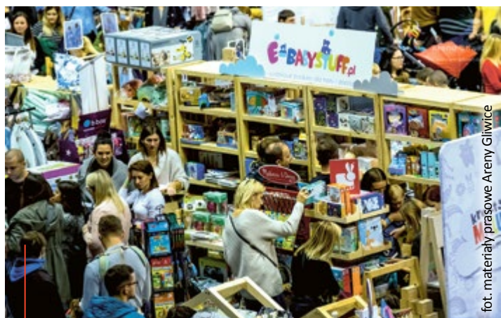
Poprzednie edycje wydarzenia cieszyły się bardzo dużym zainteresowaniem