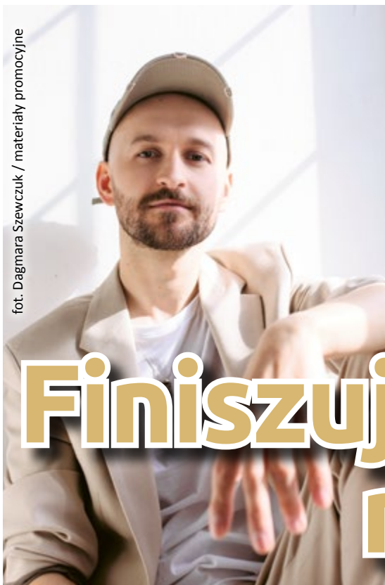
fol. Dagmara Szewczuk / materiały promocyjne