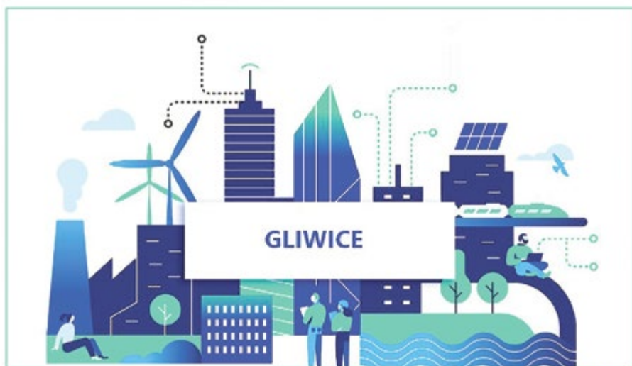
The European Commission's INTELLIGENT CITIES CHALLENGE #IntelligentCitiesChallenge #SingleMarket

Przypomnijmy, że w pierwszej edycji ICC Gliwice współpracowały z europejskimi specjalistami i innymi miastami, wykorzystując uzyskane wsparcie doradcze przy tworzeniu strategii „Gliwice 2040” oraz przy projektowaniu i wdrażaniu Gliwickiej Platformy Partycypacyjnej „DecydujMY!razem” ( decydujmyrazem.gliwice.pl ). Oprócz Gliwic, w europejskim programie uczestniczyły również Gdańsk, Poznań, Białystok i Bytom. W drugiej edycji do inicjatywy Intelligent Cities Challenge 2.0 przystąpiły z Polski Gliwice, Poznań i Gdańsk. Więcej informacji na ten temat można znaleźć na stronie intelligentcitieschallenge.eu . (kik)