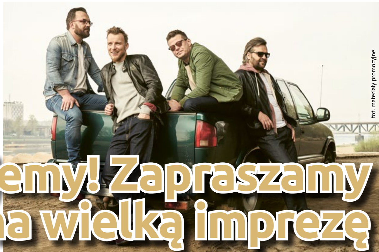
fol. materiały promocyjne