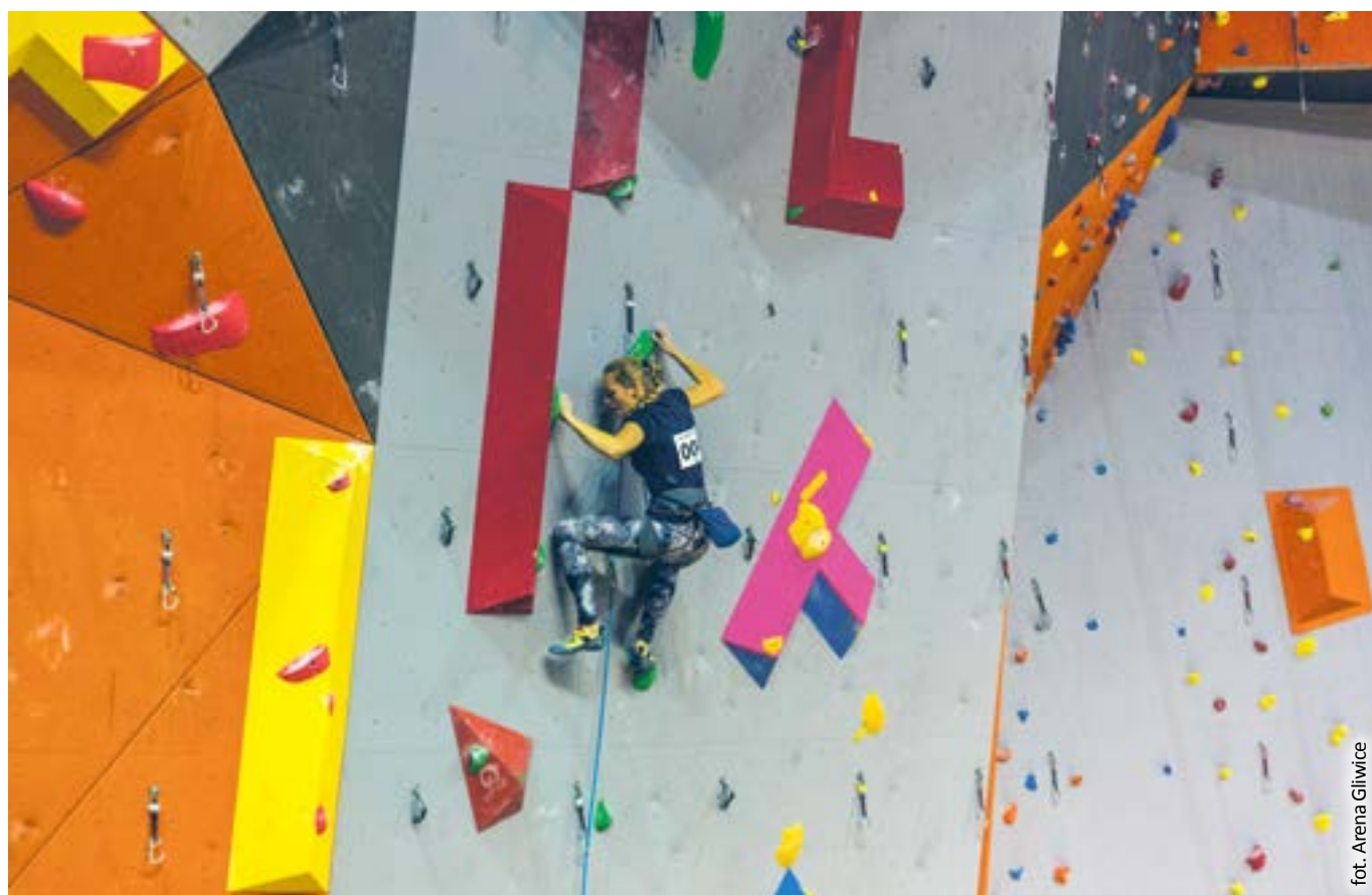
fol. Arena Gliwice