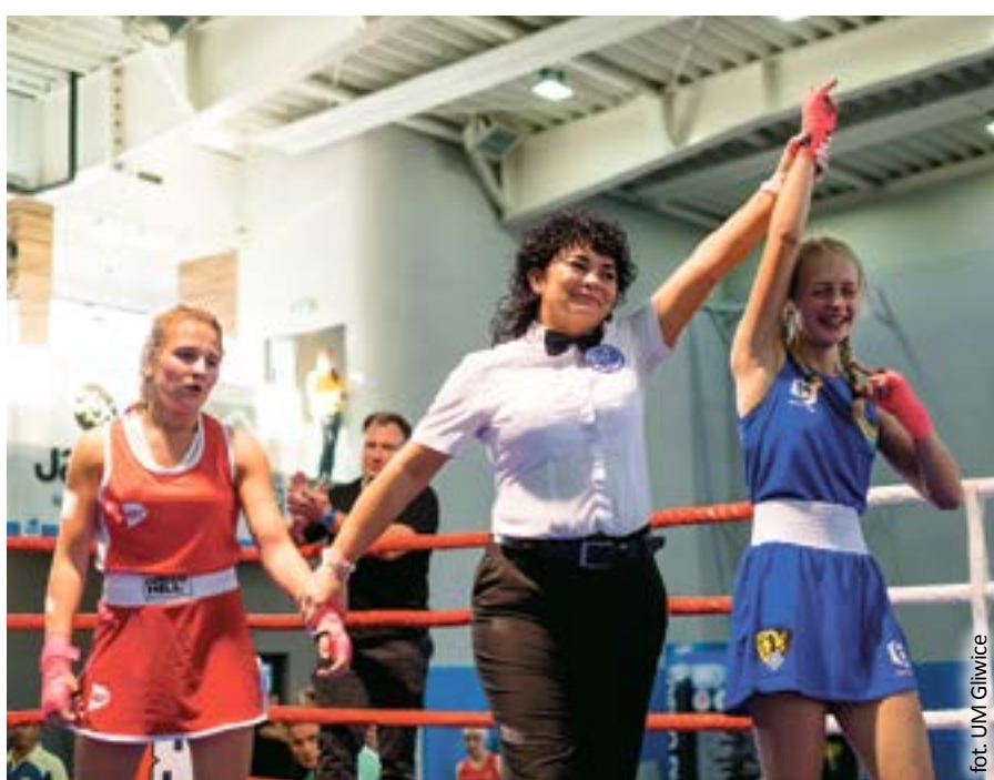
fol. UM Gliwice