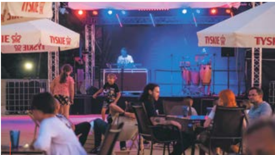
Arena Gliwice co tydzień stawia na inny rodzaj muzyki – każdy znajdzie coś dla siebie