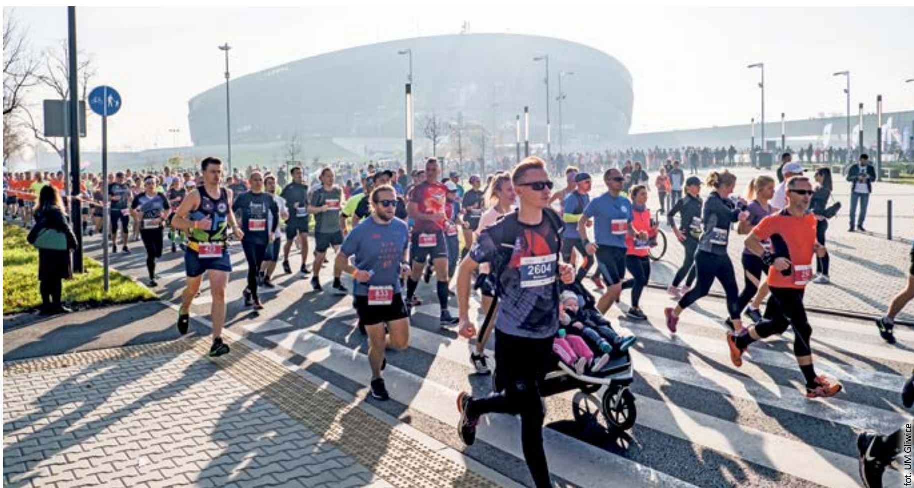
fol. UM Gliwice