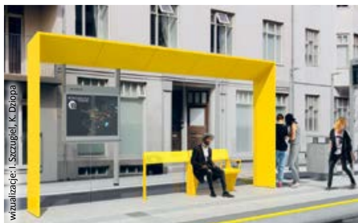
wizualizacja: I. Szczugiel, K. Dziopa

Kilka elementów zaprezentowanych w koncepcji mogłoby zostać wprowadzone w Polsce bez konieczności większych modyfikacji projektowych. – Elementy małej architektury zostały zaprojektowane w taki sposób, by korespondować z wyglądem wiaty przystankowej. Są one zaprojektowane w oparciu o europejskie standardy dotyczące ergonomii w zakresie wymiarów i materia-