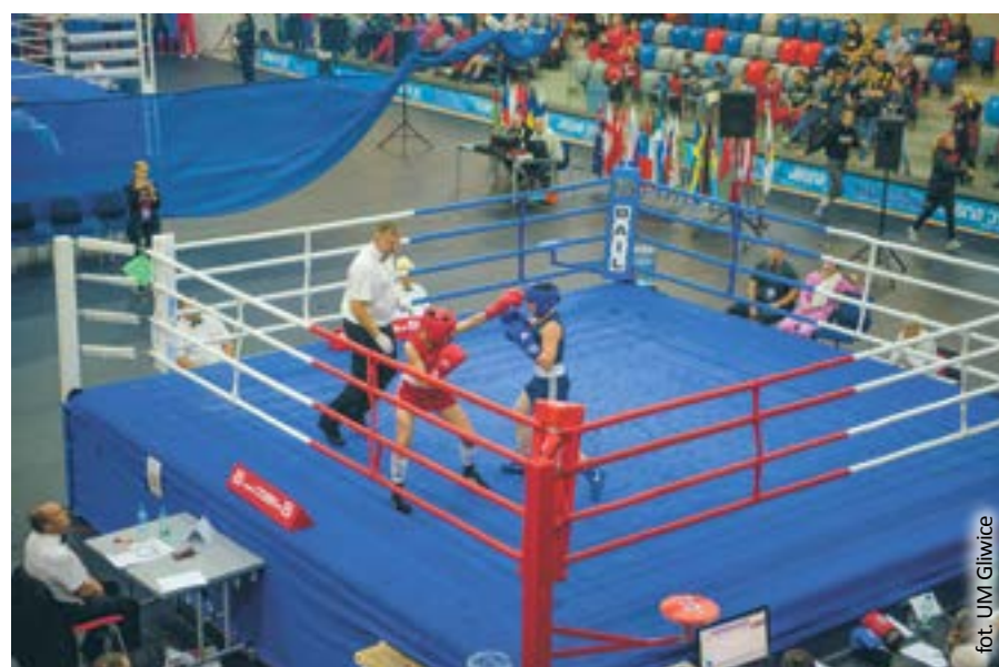
fol. UM Gliwice