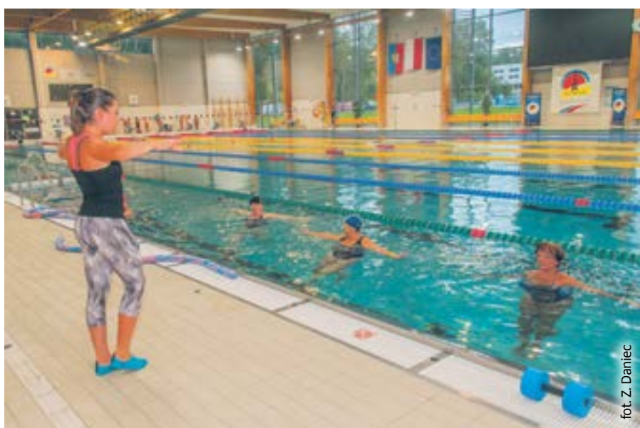
fol. Z. Daniec