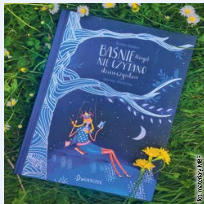
fol. materiały MBP

Baśnie to ponadczasowe i uniwersalne opowieści, które poruszają ważne problemy i przekazują pewne prawdy życiowe w prosty i zrozumiały sposób.