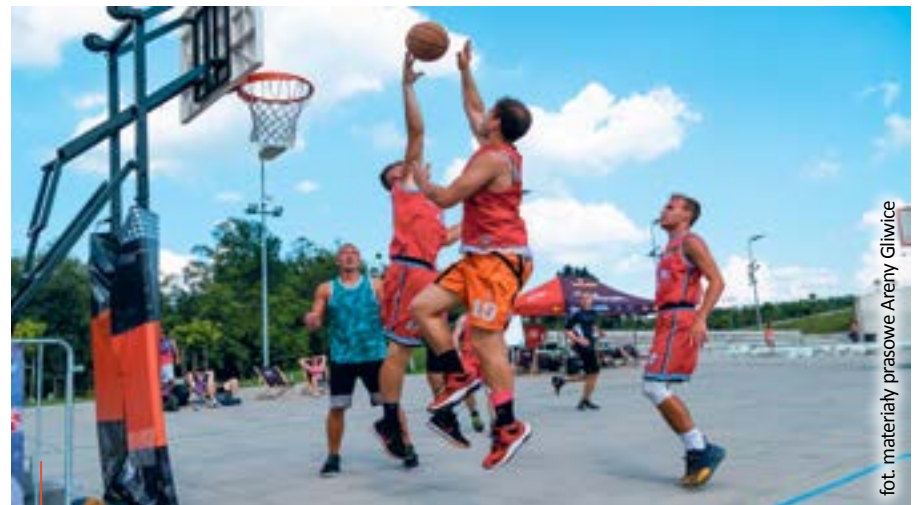
Na miłośników aktywnego wypoczynku czeka też boisko do streetballa