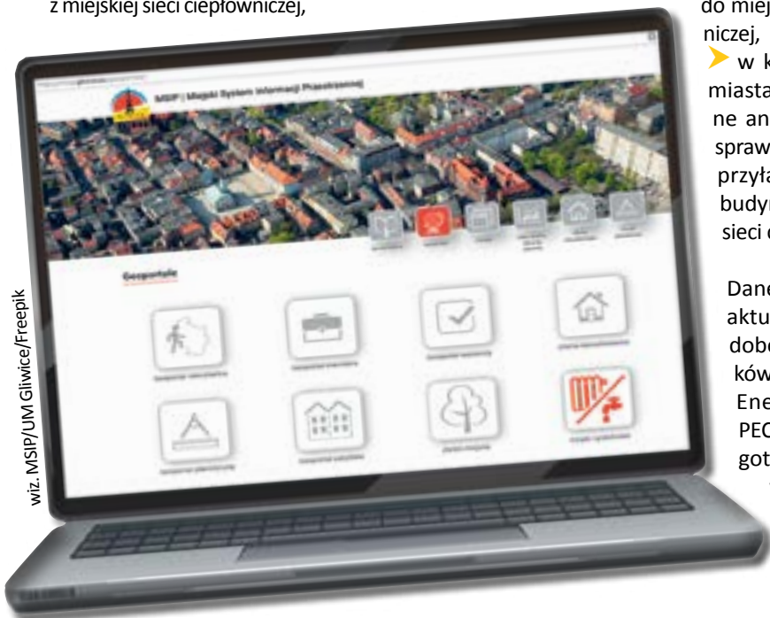
wiz. MSIP/UM Gliwice/Freeplik