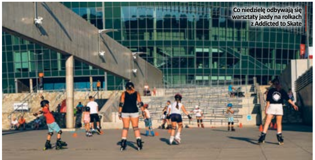
Co niedzielę odbywają się warsztaty jazdy na rolkach z Addicted to Skate

Pod znakiem sportu upłynęła także niedziela. Od rana do popołudnia