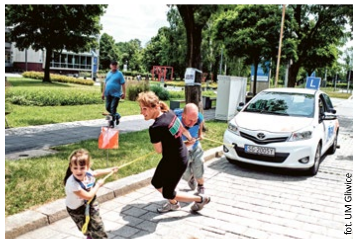
fol. UJM Gliwice