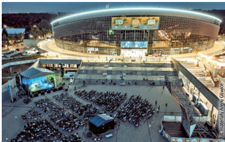
fol. materiały Areny Gliwice

Niedzielę zaczęliśmy w sportowym duchu. Zawody Streetballowe i Grand Prix w siat-