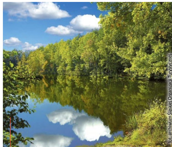
Stawy w Arboretum Bramy Morawskiej, Racibórz

Szlak Przyrody Województwa Śląskiego opracowała Śląska Organizacja Turystyczna, której Miasto Gliwice jest członkiem. (mm)