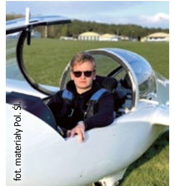
fort. materiały Pol. Śl.

Lotnictwem zaczął się interesować we wczesnym dzieciństwie. Kurs szybowcowy rozpoczął, mając lat 15, licencję SPL zrobił w wieku lat 18, natomiast rok później miał już także licencję