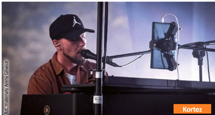
fol. materiały Areny Gliwice