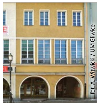
fol. A. Wiśniewski / UJM Gliwice

didżeje. Organizatorzy ze Stowarzyszenia GTW zapowiadają, że będzie bardzo różnorodnie. Przyjdź posłuchać, kiedy chcesz i z kim chcesz – nie ma biletów ani zapisów. (mm)