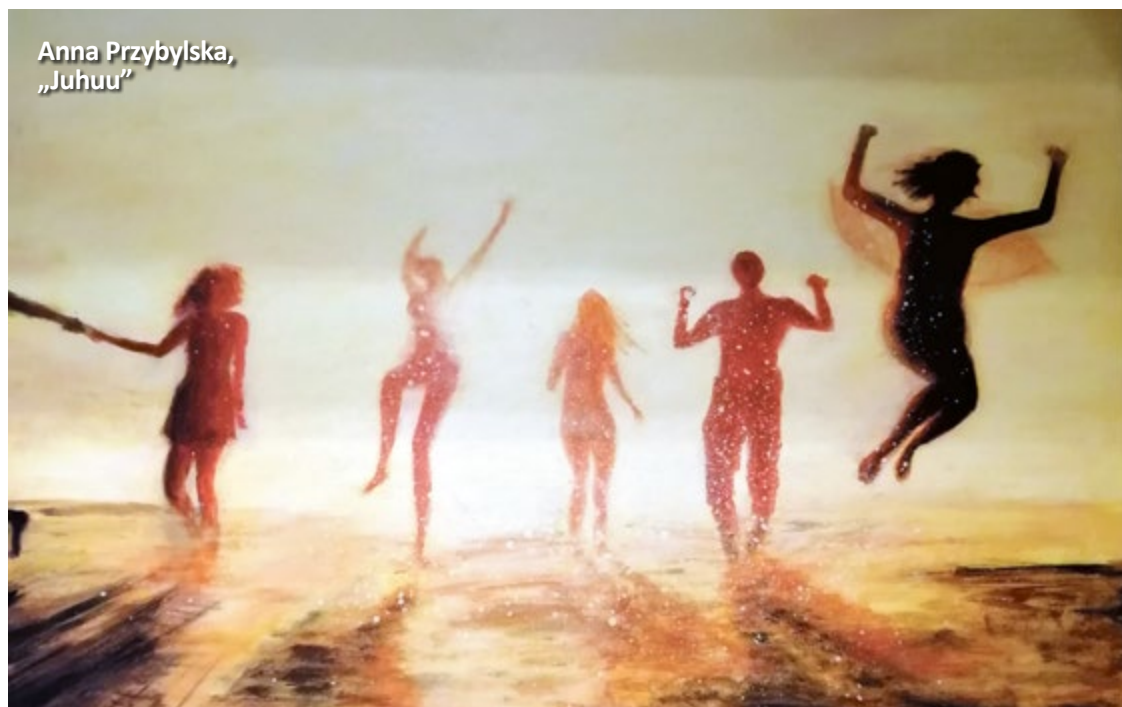
Anna Przybylska, „Juhuu”