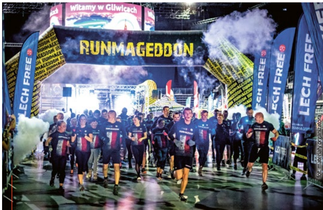
Sukces ubiegłorocznej edycji zachęcił organizatora Runmageddonu do ponownej organizacji ekstremalnego biegu z przeszkodami w Gliwicach.

Rekrut, czyli 6 kilometrów z 30 przeszkodami. Co więcej, zwolennicy dłuższego dystansu będą mogli zdecydować się na start za dnia lub nocy, a na rodziny czekać będzie formuła Family, czyli 2 kilometry wyjątkowej, błotnej zabawy z 15 ekscytującymi przeszkodami.