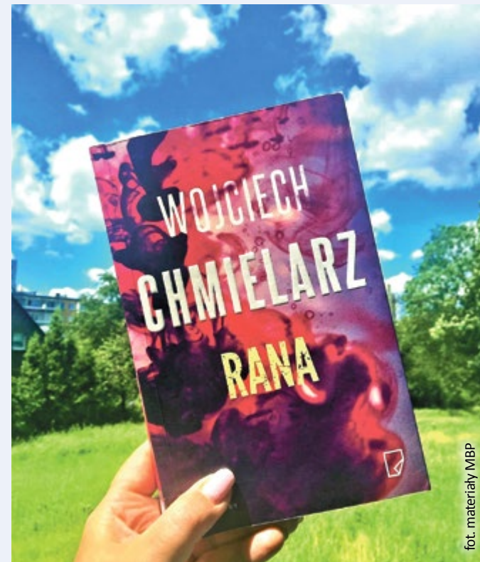
fol. materiały MBP

Wojciecha Chmielarza kochamy za cały cykl gliwicki, za wszystkie części opowiadające o Jakubie Mortce, za głośne ostatnio „Żmijowisko”. Jego najnowsza powieść „Rana” tylko to uczucie podsyca!