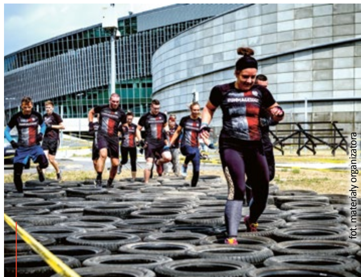
Fani ekstremalnych doznań będą mogli wybrać jedną z 5 formuł i sprawdzić się na runmageddonowej trasie.

Dzieci będą mogły przebiec kilometr najeżony wymyślnymi przeszkodami. Młodzież i dorośli będą mogli wybrać pomiędzy formułą Intro – 3 kilometry z 15 utrudnieniami, a nieco większym wyzwaniem jakim będzie