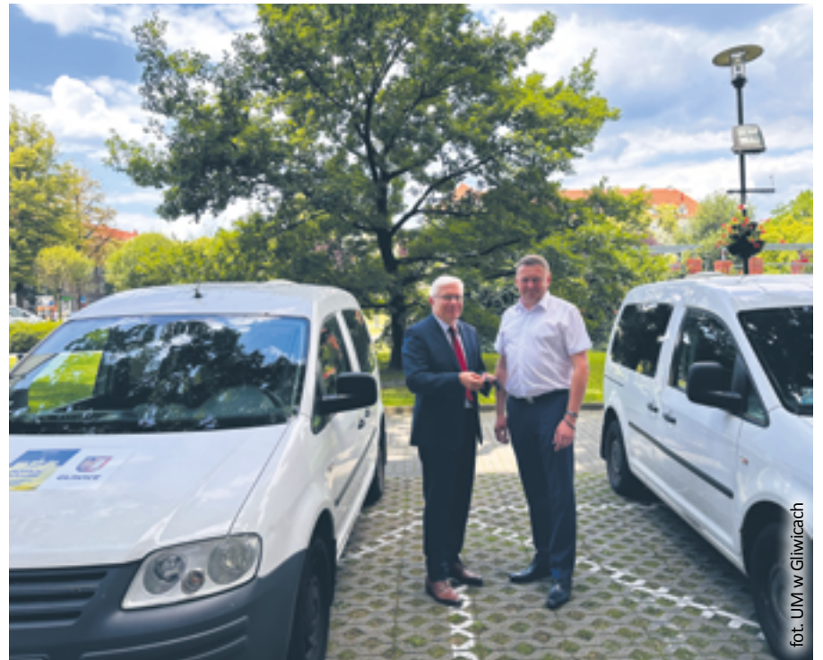
fol. UM w Gliwicach

O skali pomocy świadczą liczby. Do uruchomionej przez Centrum 3.0 – Gliwicki Ośrodek Działań Społecznych elektronicznej Gliwickiej Bazy Wsparcia trafiło łącznie blisko 500 ofert, a prawie połowę z nich (243) stanowiły