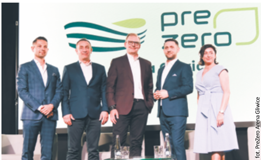
fol. PreZero Arena Gliwice