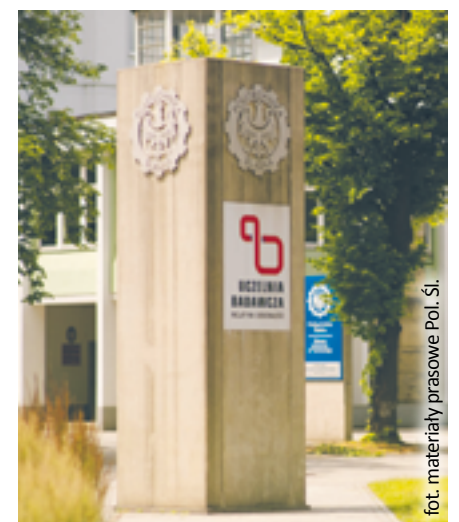
fol. materiały prasowe Pol. Śl.

Więcej informacji o wynikach i metodologii rankingu można znaleźć na stronie 2023.ranking.perspektywy.pl . (Pol.Śl./kik)