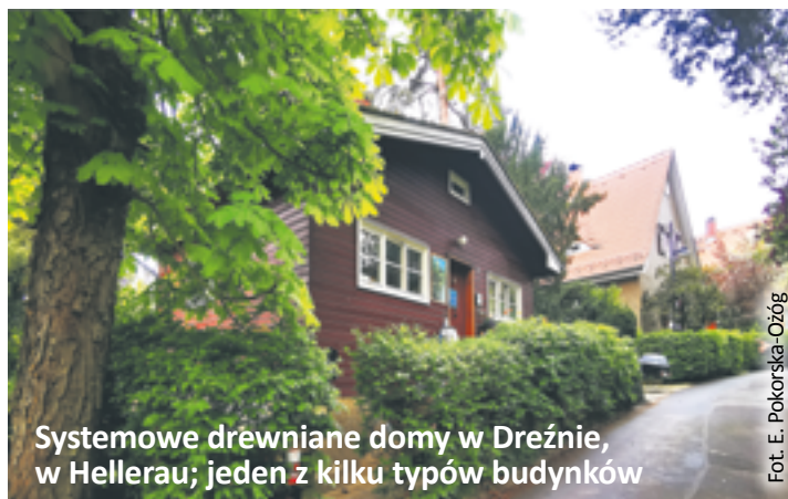
Systemowe drewniane domy w Dreźnie, w Hellerau; jeden z kilku typów budynków