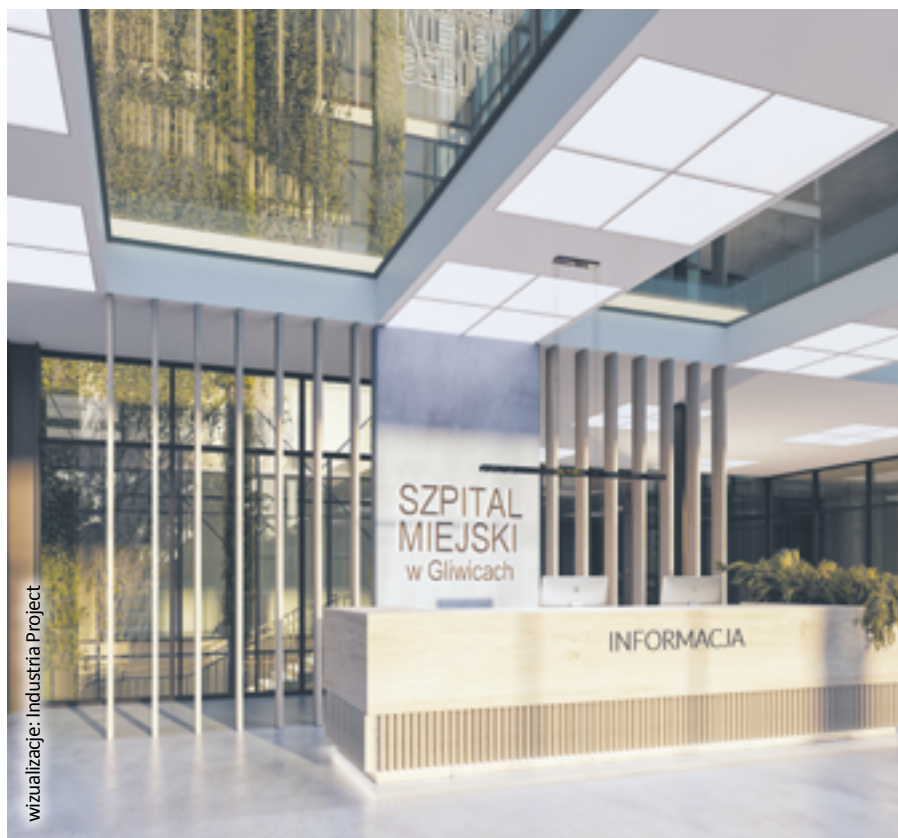
wizualizacja: Industria Project

W sumie na terenie inwestycji przewidziane są 353 miejsca parkingowe . (UM)