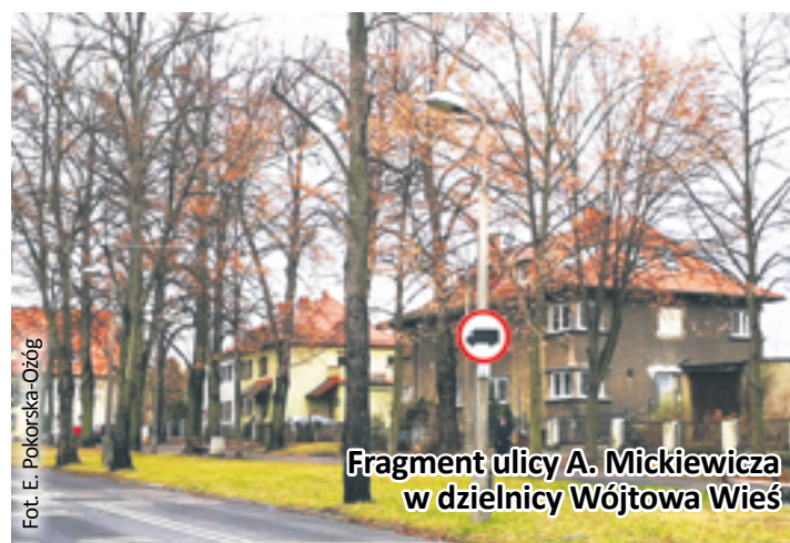
Fragment ulicy A. Mickiewicza w dzielnicy Wójtowa Wieś