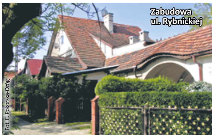
Zabudowa ul. Rybnickiej

Wzorcowym przykładem zabudowy mieszkaniowej jest również osiedle DAF w Brzezince, charakteryzujące się bardzo prostymi formami z detalem architektonicznym sprowadzonym do minimum. Projektanci narzucili nawet szczegółowo gatunki roślin, które można było posadzić w przydomowych ogródkach. Relatywnie niedrogie, ale funkcjonalne rozwiązania architektury mieszkaniowej zachowały się częściowo do naszych czasów. Dziś, jadąc ul. Płocką, podziwiam harmonię