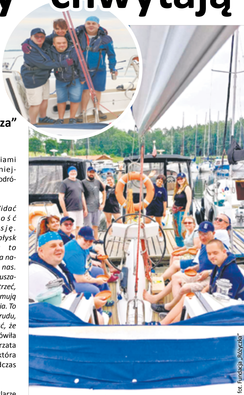
fol. Fundacja „Różyczka”

Żeglarska wyprawa sześciu wspaniałych to kolejne wyzwanie, którego podjęli się podopieczni WTZ „Tęcza”. Ich koledzy – jako pierwsi z warsztatów zajęciowych w Polsce