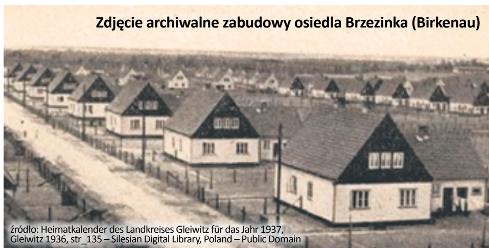
Zdjęcie archiwalne zabudowy osiedla Brzezinka (Birkenau)