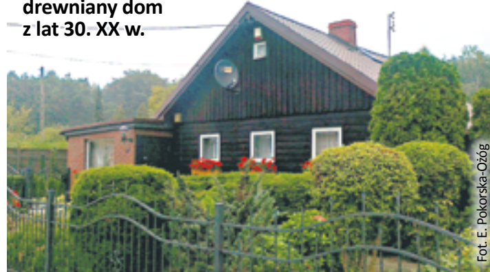
Ul. Las Łąbędzki w Gliwicach, drewniany dom z lat 30. XX w.