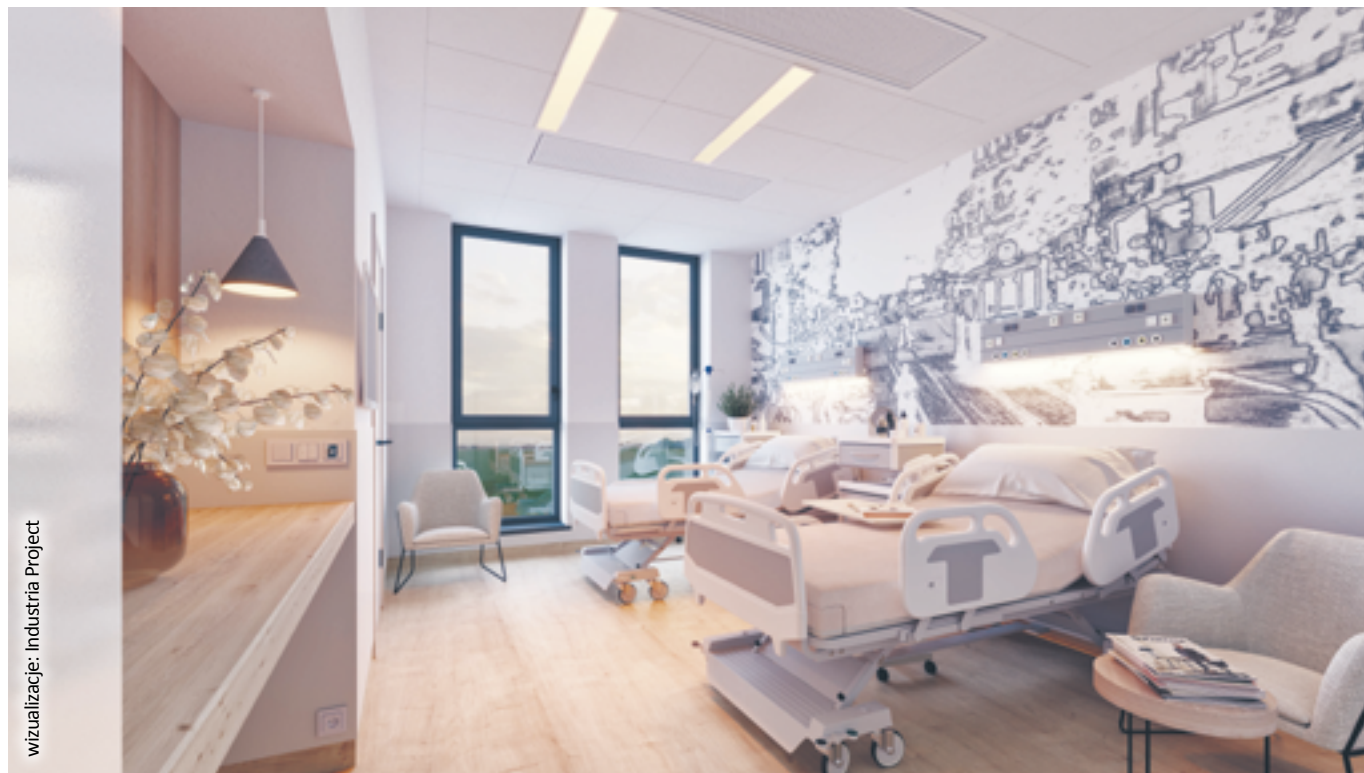
wizualizacja: Industria Project

– Jednym z głównych argumentów przemawiających na korzyść takiej formy przetargu jest fakt, że to zamawiający, czyli Miasto Gliwice, może decydować w dowolnym momencie, które z opcji – oprócz części podstawowej – ma realizować wykonawca i w jakim zakresie. Dzisiaj gliwicki szpital posiada bardzo dobry sprzęt specjalistyczny. Prawdopodobnie po zakończeniu robót budowlanych nie będzie więc potrzeby wyposażania nowego szpitala w 100% w nową aparaturę medyczną. Innym przykładem zakresu, który może nie zostać dokończony w ramach