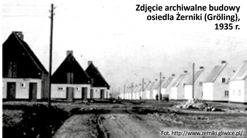
Zdjęcie archiwalne budowy osiedla Żerniki (Gröling), 1935 r.