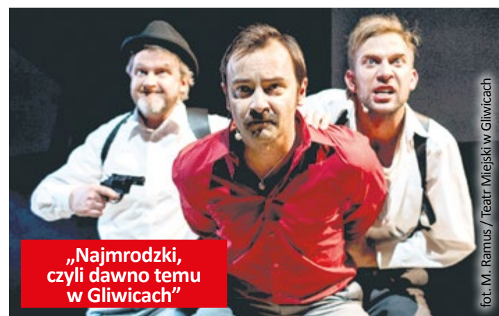
„Najmrodzki, czyli dawno temu w Gliwicach”