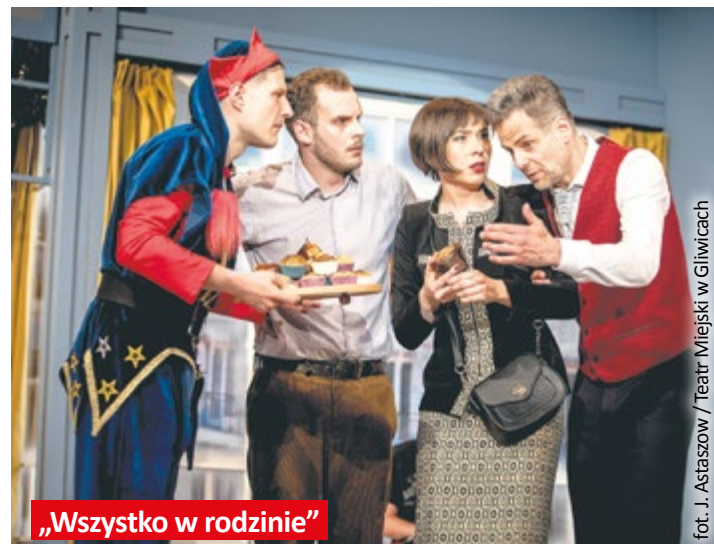
„Wszystko w rodzinie”

„Dziwny przypadek psa nocną porą” zaczyna się jak w dobrym kryminale – piętnastoletni autystyczny Christopher znajduje się w złym miejscu i złym czasie, co ściąga na niego oskarżenia o zabicie ukochanego psa sąsiadki. Zarówno policja jak i reszta świata nie potrafi poradzić sobie z dziwnie zachowującym się chłopcem. Christopher postanawia, wzorem Sherlocka Holmesa,