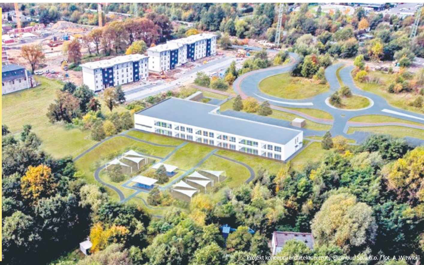
Projekt koncepcji architektonicznej: Ekoinbud Sp. z o.o.