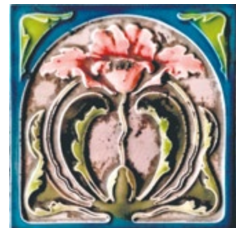
Florystyczne zdobienie z kamienicy w Bytomiu...