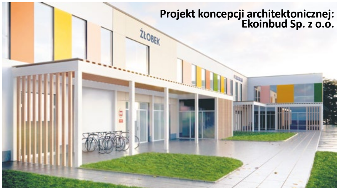
Projekt koncepcji architektonicznej: Ekoinbud Sp. z o.o.

Ponad połowa z przyznanego Gliwicom pieniędzy – ok. 8,9 mln zł – ma pokryć część wydatków związanych z budową żłobka przy ul. Zbożowej dla 218 dzieci, szacowaną obecnie na ok. 17 mln zł. Pozwoli też na jego odpowiednie wyposażenie. Pozostałą część przyznanej dotacji z programu „MALUCH+” w wysokości ok. 6,5 mln zł stanowią środki na dofinansowanie po-