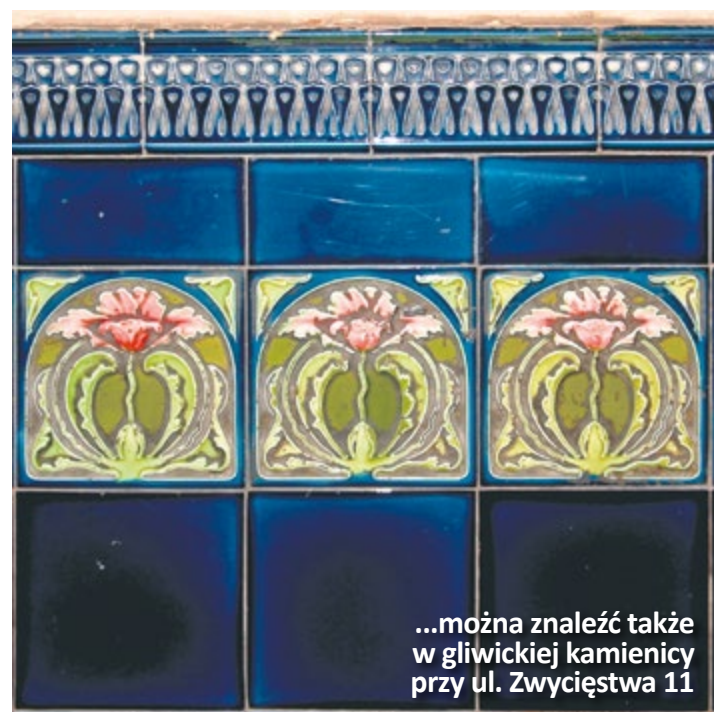
...można znaleźć także w gliwickiej kamienicy przy ul. Zwycięstwa 11