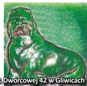
Motywy zwierzęce są ozdobą wnętrza kamienicy przy ul. Dworcowej 42 w Gliwicach