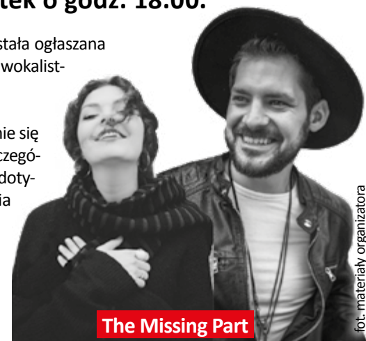
The Missing Part