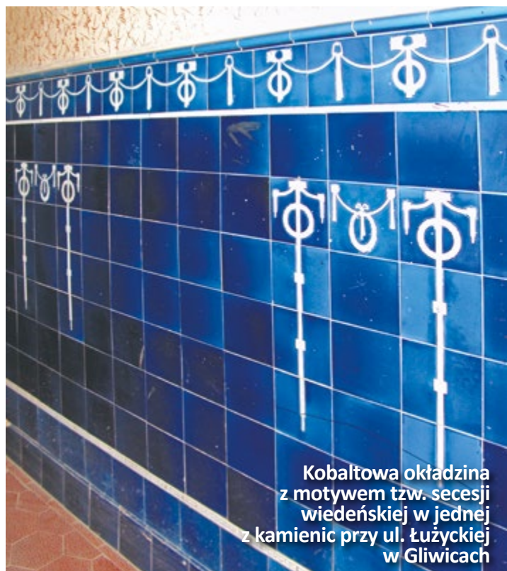
Kobaltowa okładzina z motywem tzw. secesji wiedeńskiej w jednej z kamienic przy ul. Łużyckiej w Gliwicach