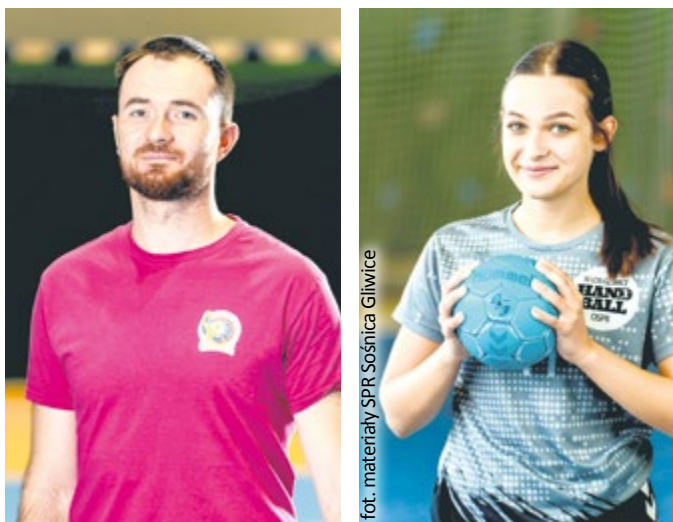
fol. materiały SPR Sośnica Gliwice