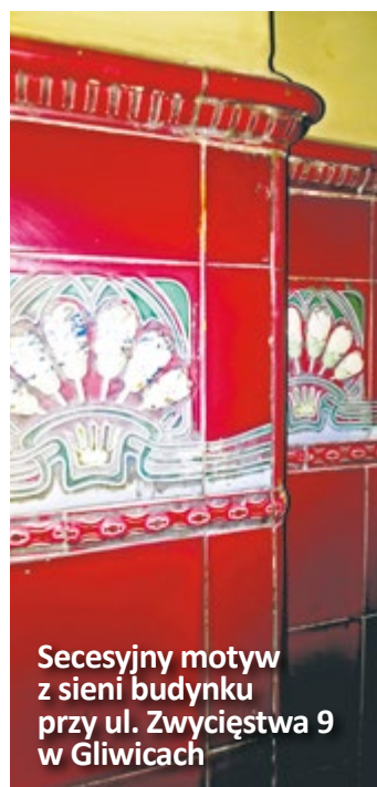
Secesyjny motyw z sieni budynku przy ul. Zwycięstwa 9 w Gliwicach