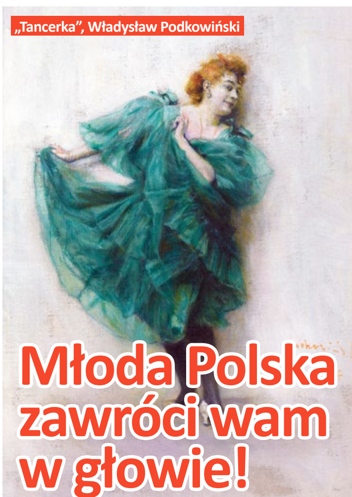
„Tancerka”, Władysław Podkowiński