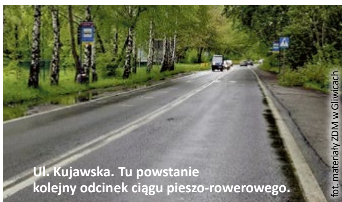
Ul. Kujawska. Tu powstanie kolejny odcinek ciągu pieszo-rowerowego.

Przypominamy, że trwa też budowa nowego ciągu pieszo-ro-