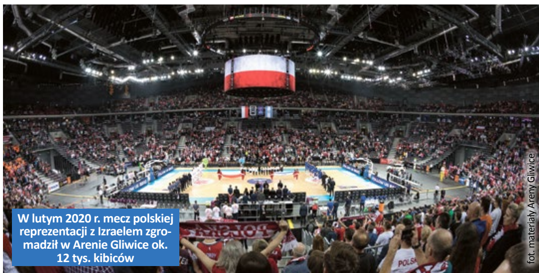
W lutym 2020 r. mecz polskiej reprezentacji z Izraelem zgromadził w Arenie Gliwice ok. 12 tys. kibiców