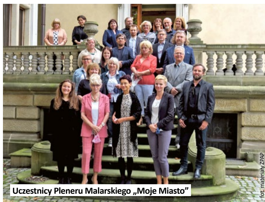
Uczestnicy Pleneru Malarskiego „Moje Miasto”