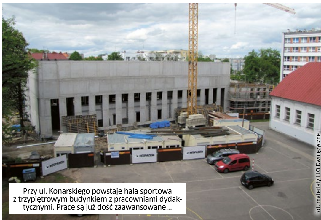
Przy ul. Konarskiego powstaje hala sportowa z trzypiętrowym budynkiem z pracowniami dydaktycznymi. Prace są już dość zaawansowane...

siłownię, szatnie z natryskami i toaletami oraz magazyn na sprzęt sportowy. Będzie też winda, pokoje dla nauczycieli wychowania fizycznego, trenerów i sędziów oraz kawiarenka. W pobliżu zostaną wybudowane boiska ze sztuczną nawierzchnią trawiastą o wymiarach do piłki ręcznej, boisko do koszykówki i siatkówki, a parking i zieleniec zostaną zmodernizowane. Powstanie też wiata rowerowa. Termin zakończenia inwestycji to początek 2021 r. Projekt wykonała Autorska Pracownia Projektowa Manecki z Krakowa. Inwestycja o wartości ponad 22 mln zł (nie licząc przyszłorocznych środków na jej wyposażenie) zostanie sfinansowana z budżetu Miasta Gliwice. Zadanie realizuje konsorcjum firm Interhall z Katowic i Łęgrzem z Krakowa.