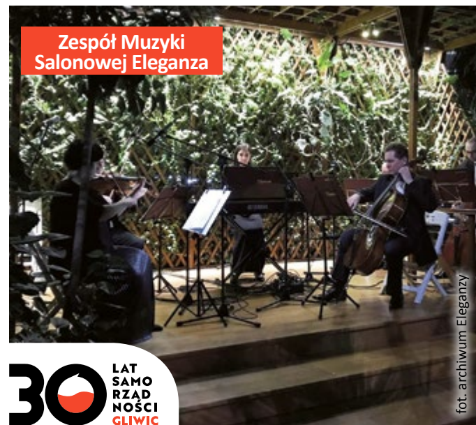
Zespół Muzyki Salonowej Eleganza