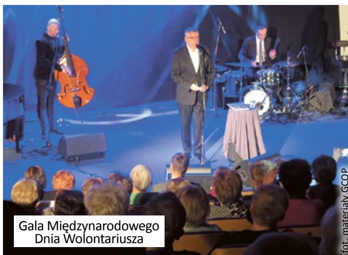
Gala Międzynarodowego Dnia Wolontariusza

Wspieranie organizacji pozarządowych to nie tylko udostępnianie zasobów GCOP, ale także możliwość wymiany doświadczeń, promocja, specjalistyczne szkolenia i porady. Dzięki wsparciu GCOP w 2019 r. zostało zarejestrowanych 11 nowych organizacji. Okazją do wymiany wiedzy i doświadczeń była zorganizowana jesienią konferencja #coNoweGO, a wielkim świętem wszystkich wolontariuszy – grudniowe miejskie obchody Międzynarodowego