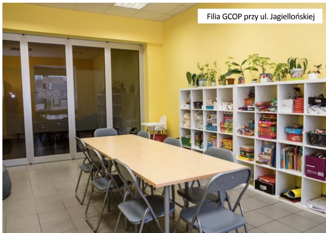
Filia GCOP przy ul. Jagiellońskiej

Bazując na ustawie o działalności pożytku publicznego i o wolontariacie, Miasto ogłosiło 38 otwartych konkursów ofert, w ramach których przekazało 4 578 069,64 zł oraz 198 479,00 zł w postaci tzw. małych grantów.