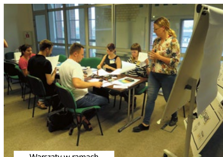
Warsztaty w ramach konferencji #coNoweGO

dowymi na rok 2019 , które jest udostępnione na stronie http://gcop.gliwice.pl/sprawozdanie-z-realizacji-programu-wspolpracy-za-2019-rok/ . (gcop)