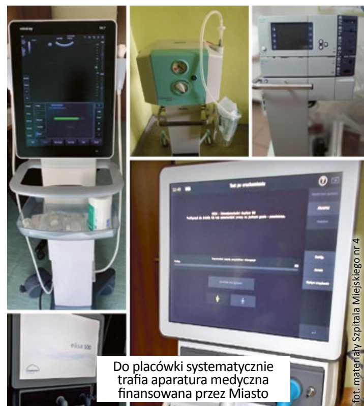
Do placówki systematycznie trafia aparatura medyczna finansowana przez Miasto

Na zakupy sprzętu i wyposażenia pomagającego w walce z COVID-19 Gliwice przeznaczyły już ponad 1,9 mln zł, w tym pozyskane przez miasto dodatkowe środki finansowe z Górnośląsko-Zagłębiowskiej Metropolii. Nowe urządzenia medyczne bardzo przydadzą się pacjentom oczywiście także po zakończeniu walki z COVID-19. (al)