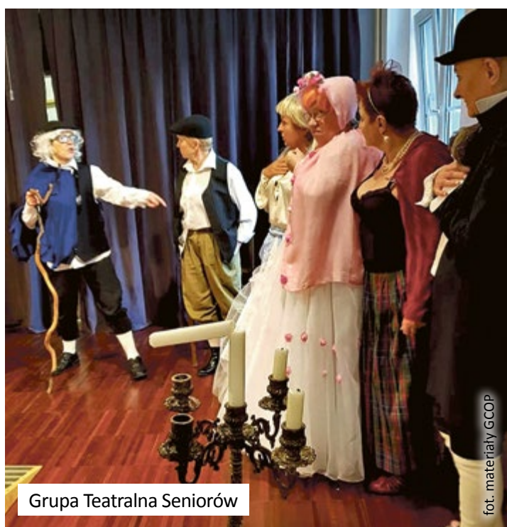
Grupa Teatralna Seniorów

Do dyspozycji gliwickich organizacji oddano zasoby Gliwickiego Centrum Organizacji Pozarządowych.