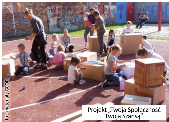
Projekt „Twoja Społeczność Twoją Szansą”

Warto wspomnieć jeszcze o projektach unijnych, związanych z aktywnością społeczną i wspieraniem organizacji. W 2019 r. Gliwickie Centrum Organizacji Pozarządowych realizowało dwa takie projekty: „Twoja Społeczność Twoją Szansą. Etap I” (związany z aktywizacją mieszkańców dzielnicy Baildona) i „Regionalny Ośrodek Wsparcia Ekonomii Społecznej 2.0”.