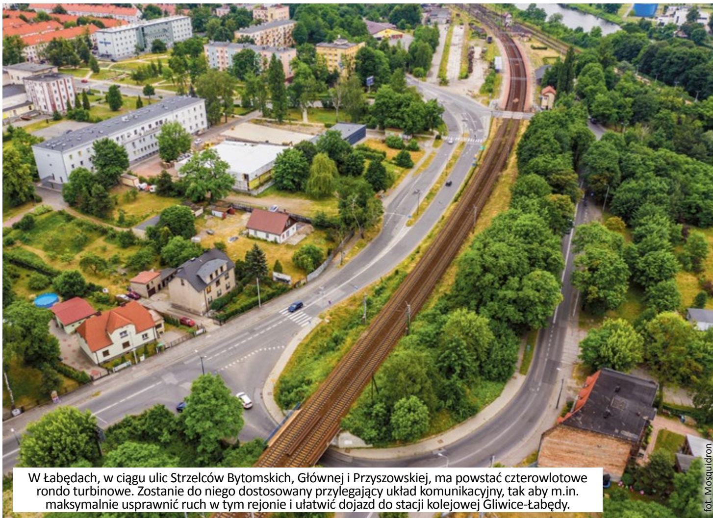
W Łąbędach, w ciągu ulic Strzelców Bytomskich, Głównej i Przyszowskiej, ma powstać czterowlotowe rondo turbinowe. Zostanie do niego dostosowany przylegający układ komunikacyjny, tak aby m.in. maksymalnie usprawnić ruch w tym rejonie i ułatwić dojazd do stacji kolejowej Gliwice-Łąbędy.

Trwają również przygotowania do przebudowy układu drogowego w rejonie stacji PKP przy ul. Głównej w Łąbędach. Różnica poziomów między starym a nowym układem drogowym zostanie zniwelowana murami oporowymi. Uzgodniona jest już geometria układu drogowego, projekt budowlany został zaakceptowany. Po zakończeniu robót ta część dzielnicy zyska nowe, atrakcyjne oblicze. Tymczasem trwają prace projektowe związane z przebudową infrastruktury podziemnej. W toku są skomplikowane procedury podziału zamkniętych terenów kolejowych. Gdy się zakończą, rozpocznie się przebudowa terenu – powstaną nowe miejsca postojowe, oświetlenie uliczne, odcinki dróg rowerowych i ciągi piesze, teren zostanie zagospodarowany zielenią. Ponadto zostaną wyznaczone miejsca dla stacji rowerów wraz z możliwością ładowania pojazdów elektrycznych.