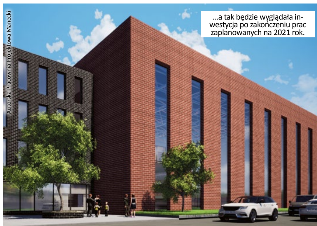
...a tak będzie wyglądała inwestycja po zakończeniu prac zaplanowanych na 2021 rok.