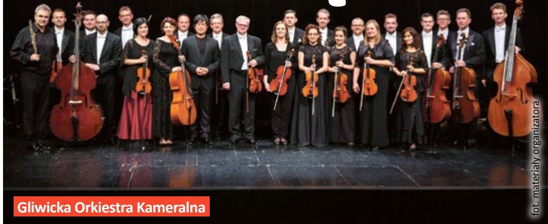
Gliwicka Orkiestra Kameralna