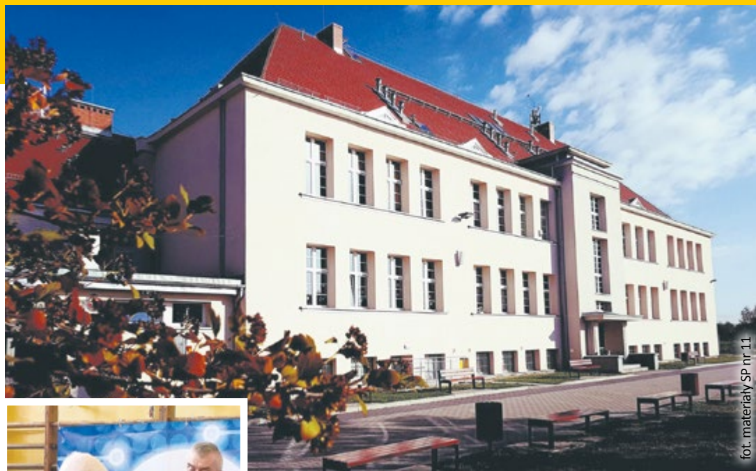
fol. materiały SP nr 11

Nie zabrakło w niej wspomnień o pierwszej, utworzonej przy dzisiejszej ul. Pocztowej, Katolickiej Szkole Powszechnej (1872 r.),