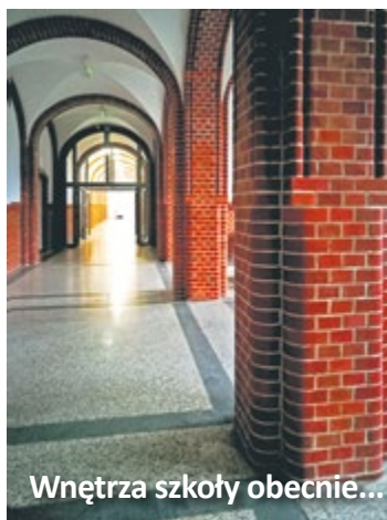
Wnętrza szkoły obecnie...