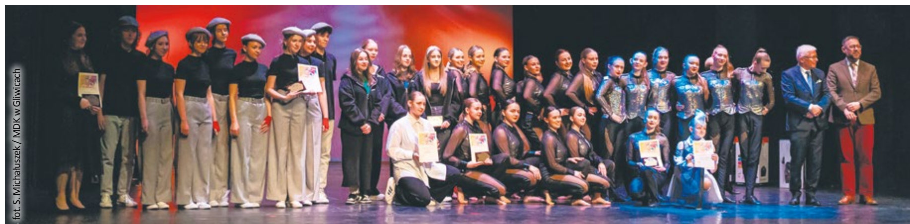
fol. S. Michalczuk / MDK w Gliwicach