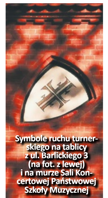
Symbole ruchu turnerskiego na tablicy z ul. Barlickiego 3 (na fot. z lewej) i na murze Sali Koncertowej Państwowej Szkoły Muzycznej