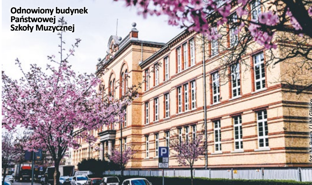
Odnowiony budynek Państwowej Szkoły Muzycznej

Świetnym przykładem na potwierdzenie tych słów jest zakończone w ubiegłym roku, zrealizowany przez miasto kosztem ok. 27 mln zł, remont siedziby Państwowej Szkoły Muzycznej zlokalizowanej przy ul. Księcia Ziemowita. To jeden z ciekawszych rejonów naszego miasta. Tam znajdują się bogate w secesyjne detale kamienice mieszkalne, modernistyczne budynki, katedra pw. św. Apostołów Piotra i Pawła oraz dwa budynki szkolne. Jednym z nich jest właśnie nowe lokum PSM – powstały w latach 1892–1894 gmach dawnej koedukacyjnej i prawdopodobnie też wielowyznaniowej szkoły powszechnej. Jej uczniowie – z 6 klas przeznaczonych dla chłopców, 6 dla dziewcząt i 5 wspólnych – mieścili się w 14 pomieszczeniach lekcyjnych. Nie wszystkim się to podobało, a nawet budziło zgorznienie. W jednej z najliczniejszych klas znajdowało się aż 72 uczniów, a w najmniejszej (!) – 53. Szybko okazało się, że budynek szkolny jest za mały na rosnące potrzeby. Dlatego już w 1902 roku nastąpiła jego rozbudowa.