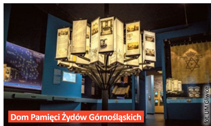
Dom Pamięci Żydów Górnośląskich