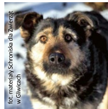
fol. materiały Schroniska dla Zwierząt w Gliwicach

W gliwickim schronisku zwierzęta przebywają w ogrzewanych pomieszczeniach, mają do dyspozycji duże wybiegi. Koty mieszkają w kilku przystosowanych dla nich pomieszczeniach, tzw. kociarniach. Psy kwaterowane są zgodnie z charakterem – niektóre potrzebują samotności, socjalizacji i czasu, by nabrać zaufania. Schronisko stale usprawnia swoją działalność i podejmuje prace modernizacyjne. Obecnie planowany jest remont jednego z pawilonów. Na ten cel z miejskiego budżetu zostanie przeznaczony około 200 tys. zł.