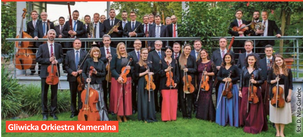
Gliwicka Orkiestra Kameralna