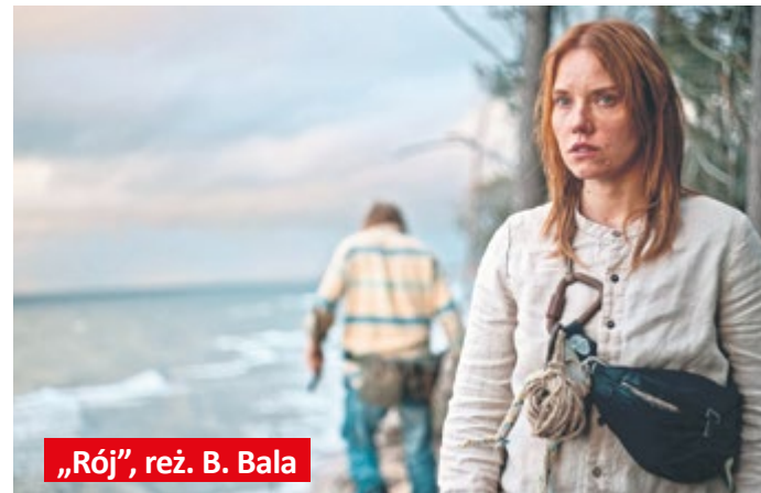
„Rój”, reż. B. Bala

– Jest wiele powodów, dla których chcę opowiedzieć tę historię. Przede wszystkim chcę pokazać kobietę, która podejmuje ekstremalną próbę zmiany swojego życia. Chcę pokazać świat, o którym ludzie