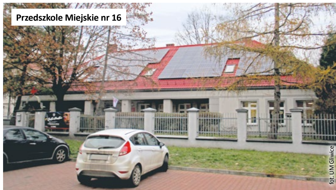
Przedszkole Miejskie nr 16