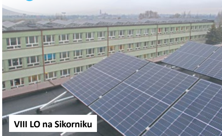
VIII LO na Sikorniku